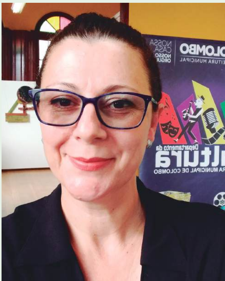
A Secretária agora intensifica o mapeamento e desenvolvimento de iniciativas culturais em Colombo.

Após 40 anos, o Departamento de Cultura de Colombo passa a ter status de Secretaria de Cultura.