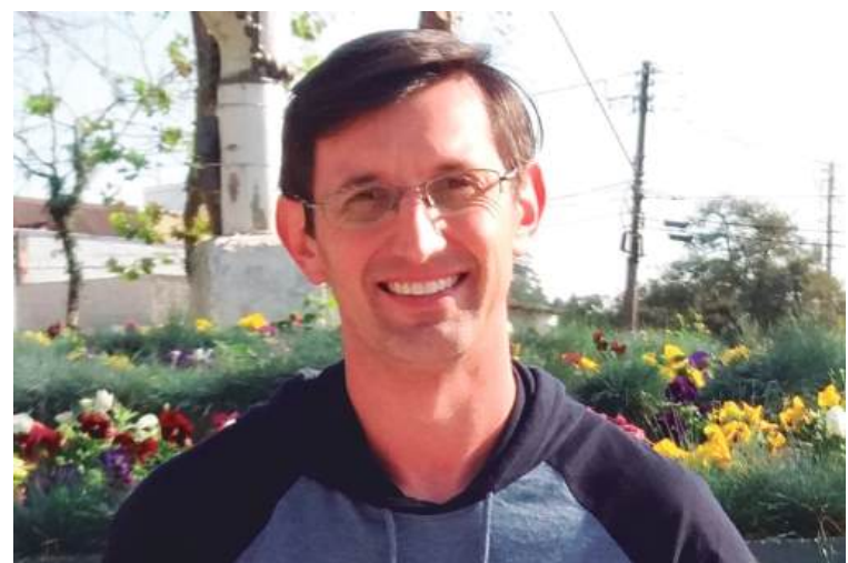
A cultura italiana é visível na gastronomia, com destaque para o risoto, e na manutenção da agricultura familiar.

Para resgatar a tradição, é essencial envolver as famílias italianas, grupos folclóricos e associações culturais. Jogos típicos como Boccia e Escopa, missas em italiano e desfiles alegóricos também devem ser incentivados para manter viva a identidade histórica da cidade.