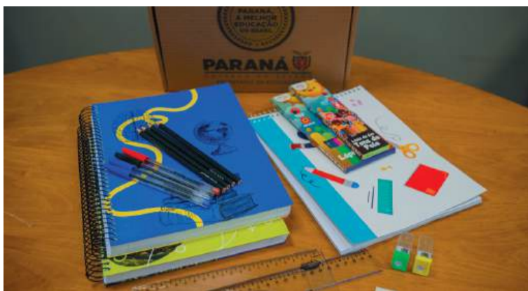
É a primeira vez que o Governo distribui kits escolares para todos os alunos, com investimento de R$ 43 milhões. Serão 910.979 kits para 2025.

Os kits serão entregues diretamente nas escolas, onde estarão disponíveis para retirada pelos estudantes no início das aulas,