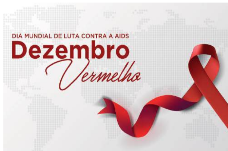
A Sesa iniciou as ações do Dezembro Vermelho e Dia Mundial de Luta contra a Aids, com atividades de conscientização, prevenção e testagem para HIV em todo o Paraná.

A Secretaria da Saúde do Paraná realiza ações contínuas de prevenção, com capacitações para as Regionais de Saúde e municípios sobre diagnóstico precoce, prevenção e saúde. Desde 2019, o Estado expandiu a Profilaxia Pré-Exposição (PrEP) para pessoas com maior risco de HIV.