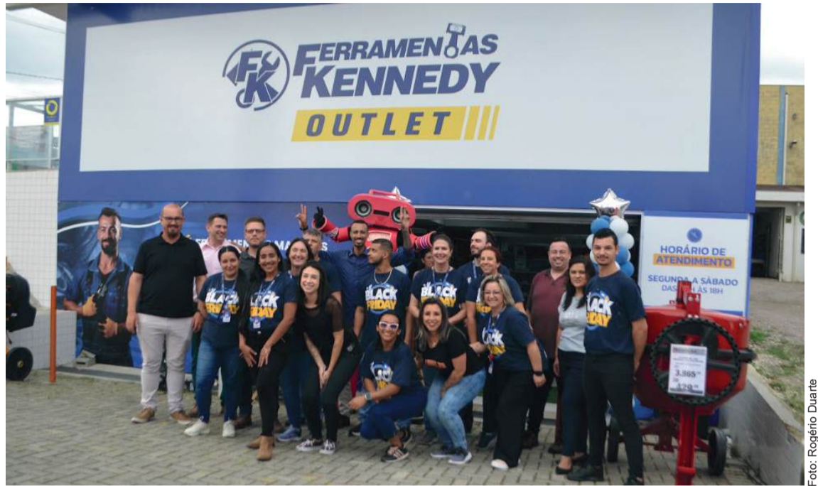
Nova unidade da Ferramentas Kennedy em Colombo oferece variedade, qualidade e um outlet exclusivo para produtos com preços especiais.

A unidade de Colombo também traz o conceito de prateleira infinita, que expande a variedade de produtos disponíveis na loja física para até 25 mil itens. Essa integração permite que o cliente encontre na