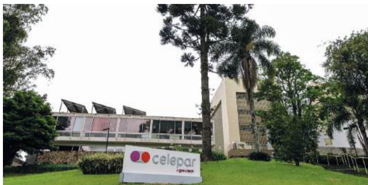
Os salários dos 40 cargos comissionados na Celepar variam de R$ 7 mil a R$ 31 mil, com a maioria acima de R$ 16 mil.

O processo de desestatização começou oficialmente com o envio de um projeto de lei para a Assembleia Legislativa, o qual já passou por sua primeira vota-