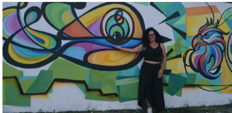
O lançamento será uma ocasião para ressaltar o valor da cultura local e a importância de apoiar e reconhecer Colombo como um espaço fértil para o desenvolvimento artístico.

Colombo, muitas vezes à sombra de centros cul-