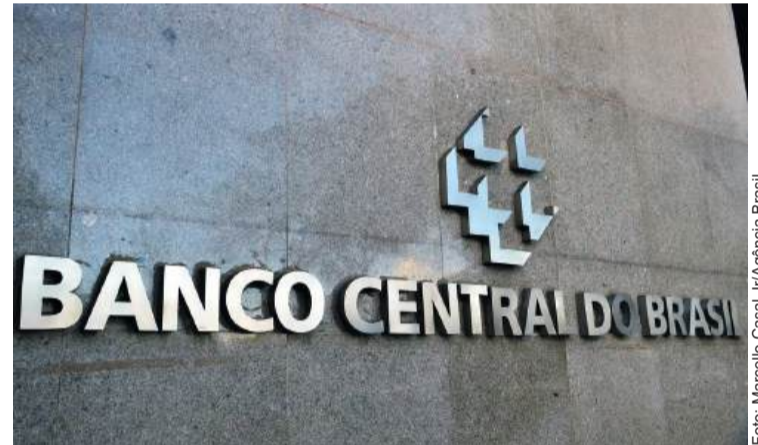
O Copom reforça o compromisso com o controle da inflação e alerta para o risco de prolongamento da alta da Selic.

O ciclo de alta da Selic começou após um longo período de redução, iniciado em agosto de 2022, quando a taxa estava em 13,75%. Entre agosto de 2023 e maio de 2024, o Copom fez cortes sucessivos, totalizando sete reduções. A Selic foi mantida em 10,5% em junho e julho, até ser elevada novamente em setembro, com aumento de 0,25 ponto.