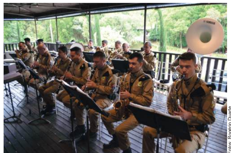
A trilha sonora do evento ficou por conta da Banda da Polícia Militar do Paraná, que brilhou com seu repertório musical.