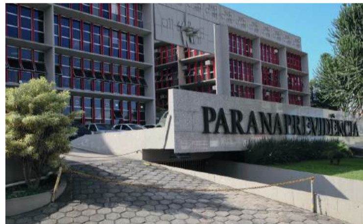
Inscrições começam em 18 de novembro, com vagas imediatas e cadastro de reserva.

Os salários iniciais variam de acordo com o cargo e o nível de escolaridade. Para os cargos de nível técnico, o valor inicial é de R$ 5.186,86, enquanto os cargos de nível superior oferecem salários a partir de R$ 7.780,28. O salário para os cargos de Médico Perito e Atuário é de R$ 9.336,34.