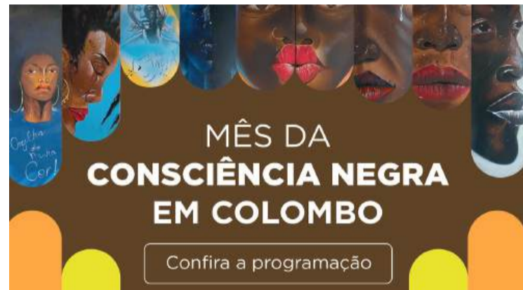
Em Colombo, a programação em comemoração ao Mês da Consciência Negra inclui exposições, rodas de conversa e eventos culturais.

O dia 23 de novembro será marcado pela Feira de Cultura e Gastronomia Afro-Colombense, que ocorre na Avenida Espírito