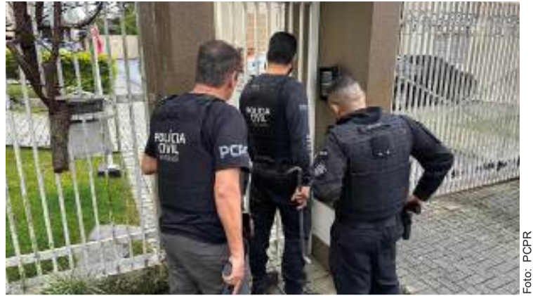
Policiais da PCPR durante operação contra fraudes financeiras que vitimaram mais de 100 idosos na Grande Curitiba.

A PCPR segue as investigações para identificar todos