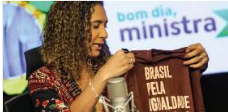
Ministra Anielle Franco destaca ações do governo para ampliar o ensino da história e cultura afro-brasileira nas escolas.

Como parte das ações do governo, foi lançado o programa Caminhos Americanos, um intercâmbio educacional entre países latino-americanos e africanos, com o objetivo de capacitar estudantes e docentes. No próximo dia 21, ocor-