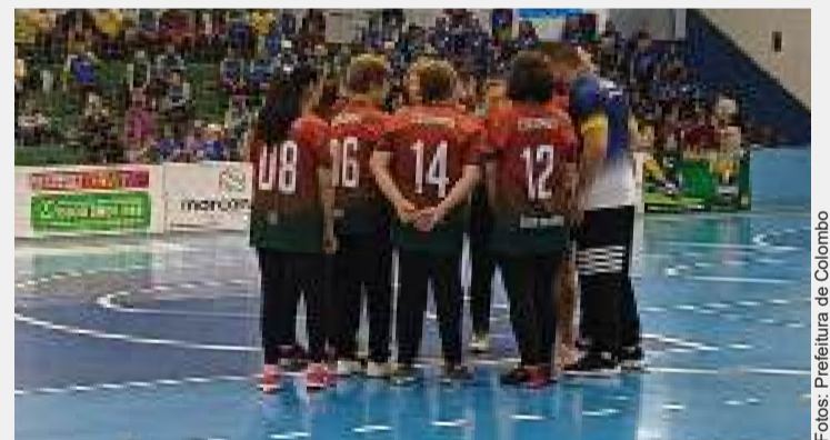
O JIIDOS contará com a participação de uma delegação colombense de mais de 30 atletas.

Além dos benefícios físicos, como a melhoria da coordenação motora, do equilíbrio e da resistência, o esporte tem papel fundamental na promoção do bem-estar mental e emocional. Atividades físicas regulares contribuem para a saúde emocional dos participantes, combatendo o isolamento social e criando oportunidades para novas amizades e experiências de convivência. Iniciativas como o JIIDOS comprovam que o esporte é um valioso aliado na qualidade de vida dos idosos.