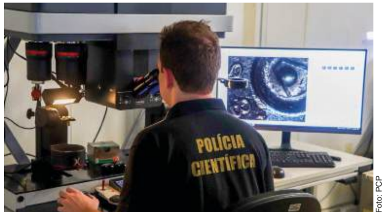
Peritos da Balística Forense do Paraná analisam projéteis e estojos, fortalecendo investigações criminais no estado.

Ao identificar compatibilidades balísticas, realiza-se uma nova análise microscópica, gerando laudos que ajudam a resolver crimes de forma mais ágil. A PCP possui dois equipamentos IBIS TRAX HD3D, um cedido pela SENASP e outro adquirido pelo Governo do Paraná, além