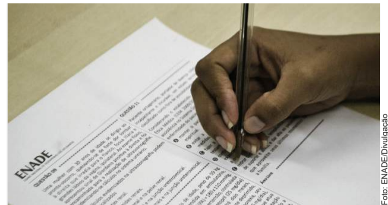
O exame agora abrange duas modalidades de avaliação, prática e teórica, com cronogramas definidos para cada uma.

A edição de 2024 avaliará licenciaturas em 17 áreas: artes visuais, ciências biológicas, ciências sociais, computação, educação física, filosofia, física, geografia, história, letras (inglês), letras (português), letras (português e espanhol), letras (português e inglês), matemática, música, pedagogia e química.