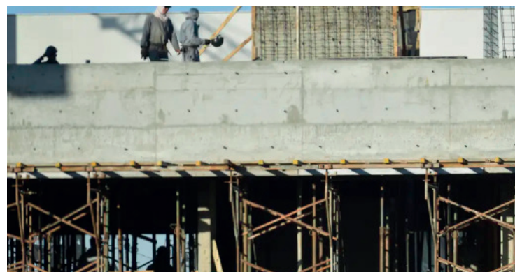
Dados do Caged mostram crescimento no emprego formal, com destaque para os setores de serviços e indústria.