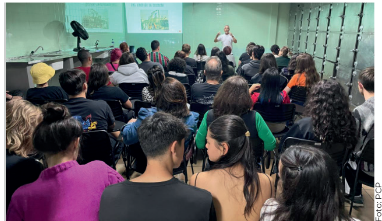
Nos dias 31 de outubro e 2 de novembro, o antigo necrotério na Avenida Visconde de Guarapuava, em Curitiba, sediará duas exibições do Cineclube da Polícia Científica.

O evento também contará com exibições em outros espaços conhecidos da cidade, como o Cine Passeio, a Cinemateca de Curitiba e o Teatro da