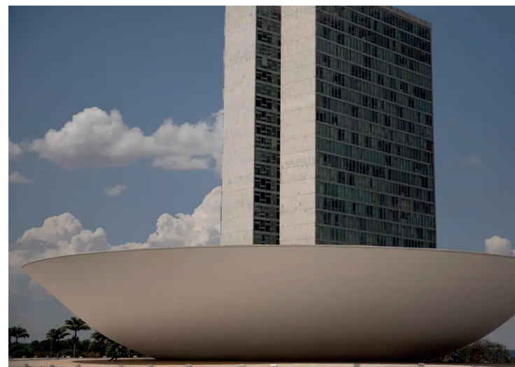
Câmara dos Deputados decide não permitir a taxaço de heranças de planos de previdência privada, seguindo para apreciação do Senado.