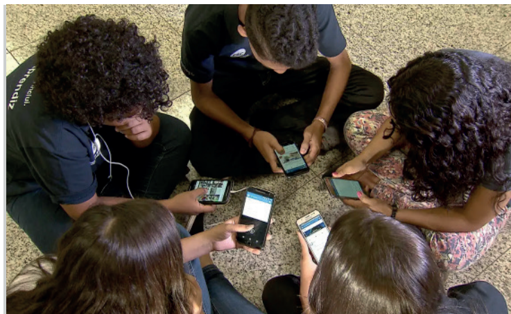
Câmara dos Deputados aprova projeto que proíbe celulares nas escolas, protegendo crianças até 10 anos e permitindo o uso pedagógico.

Para crianças a partir dos 11 anos, a proposta reconhece uma maior autorregulação e a necessidade de interações digitais. O uso