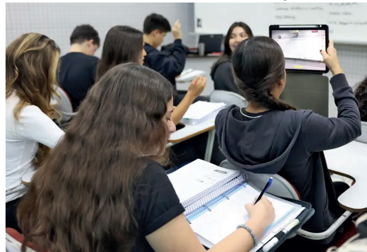
Especialistas orientam candidatos a controlar o estresse e obter equilíbrio emocional.