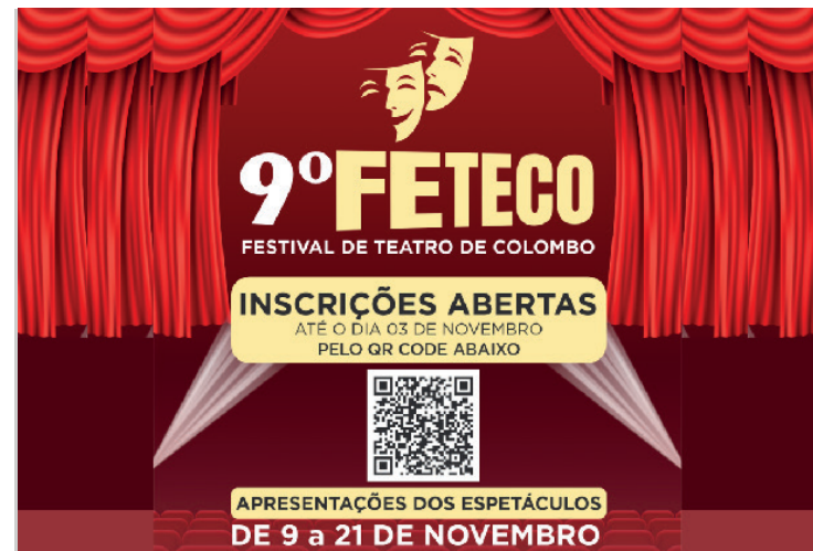
O FETECO busca descobrir novos talentos e proporcionar maior interação entre artistas e público.

contro cultural que ajuda a fortalecer as identidades e laços comunitários.