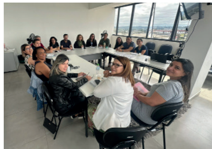
O objetivo é estruturar um calendário que equilibre o tempo letivo com as demandas da comunidade escolar.

Colombo às expectativas e necessidades da população, fortalecendo a participação democrática nas decisões sobre o ensino. Para os conselheiros, esse diálogo entre comunidade e gestão educacional é essencial para garantir uma educação de qualidade que atenda à diversidade do município. A próxima reunião do Conselho Municipal de Educação já está agendada para o dia 26 de novembro, ocasião em que novas pautas serão discutidas com foco em estratégias para a me-