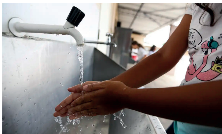
Parceria entre BNDES e Caixa mobiliza R$ 12 bilhões do FGTS para impulsionar saneamento e mobilidade no Brasil.

neamento e mobilidade urbana, promovendo o desenvolvimento sustentável do Brasil”, destacou. Além disso, os dois ban-