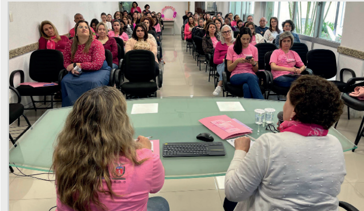
Nesta edição, o governo ampliou em 30% o repasse para exames preventivos.

contínuo com a saúde das mulheres. “A prevenção é um ato de amor e autocuidado. Vamos continuar promovendo a saúde ao longo do ano, porque cuidar de si é um gesto de amor”, disse. Nesta edição, o governo ampliou em 30% o repasse para exames preventivos, possibilitando a realização de 80 mil exames citopatológicos e 15,4 mil mamografias mensais. Além disso, o “Desafio dos 21 Dias”, divulgado nas redes sociais e site oficial, incentivou a prática de exercícios físicos, alimentação saudável e cessação do tabagismo, entre outras ações de prevenção a doenças crônicas. A última edição, em Nova Esperança, somou 5.438 atendimentos e promoveu uma palestra socioeducati-