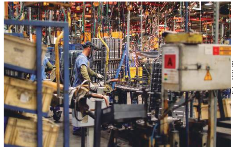
Os dados fazem parte de uma análise do Instituto Paranaense de Desenvolvimento Econômico e Social (Ipardes).

Outro fator que impulsionou o desempenho econômico do estado foi o baixo índice de desemprego, que atingiu 4,4%, a menor taxa