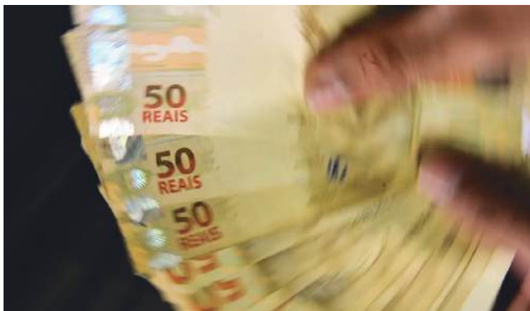
Os fatores que contribuíram para essa arrecadação recorde em 2024 incluem um crescimento real no Imposto de Renda Retido.