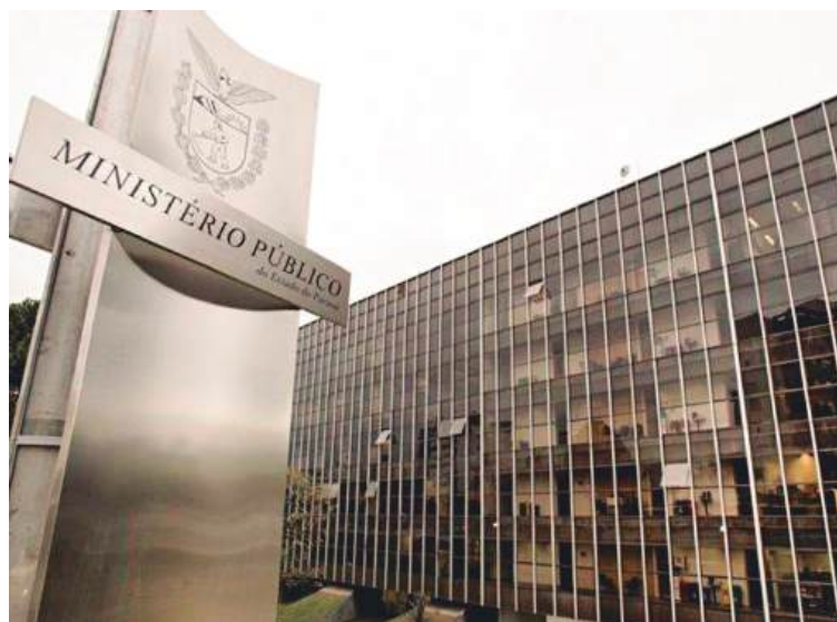
O assessor, contratado como funcionário público, desempenhava suas funções em um aviário e pet shop pertencente ao vereador.

Pesquisar o histórico dos candidatos é essencial para uma escolha consciente. Conhecer a trajetória política, suas propostas e eventuais envolvimento em escândalos ou atos ilícitos ajuda o eleitor a identificar quem realmente está comprometido com o bem público. Essa prática fortalece a democracia, evitando a eleição de candidatos despreparados ou corruptos.