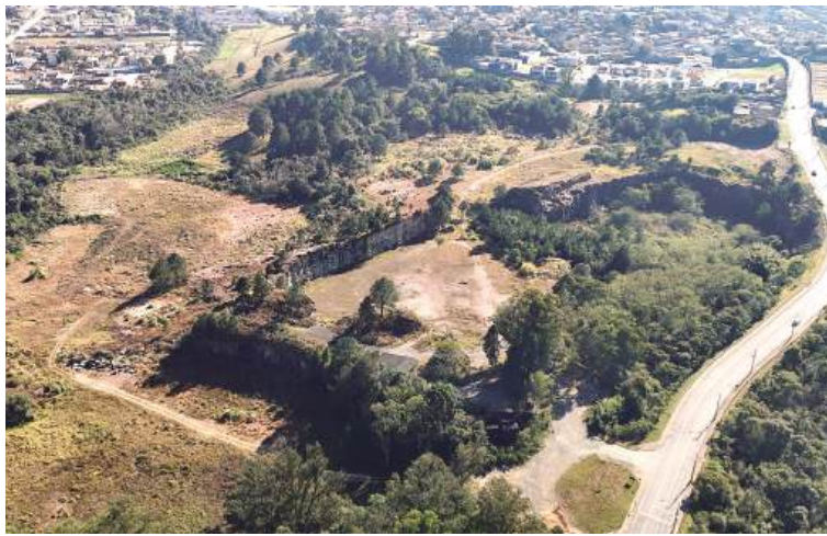
Novas atrações e infraestrutura, do Governo e da iniciativa privada, estão transformando o turismo no Paraná com atividades culturais e opções de lazer.