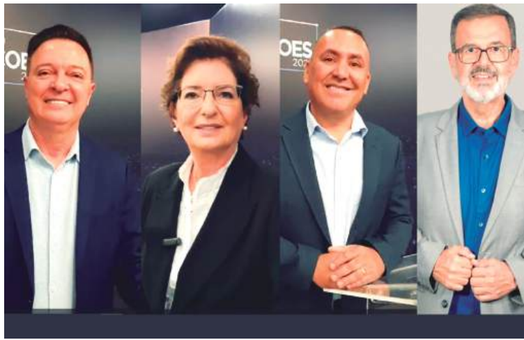
A sabatina durou 5h30 e foi transmitida pelo canal da ACIC no YouTube, onde segue disponível.

Cada candidato teve uma hora para apresentar sua trajetória, responder perguntas da associação e destacar pontos de seus planos de governo. Confira