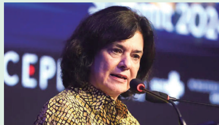
Ministra da Saúde intensifica apelo para vacinação de grávidas e crianças após óbito de bebê de 6 meses em Londrina, PR.