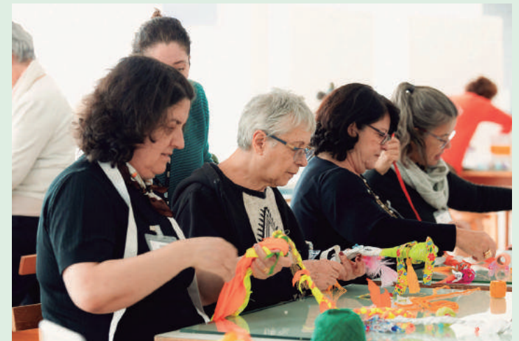
Os encontros serão em 6 e 13 de agosto, com visita mediada e oficina artística, explorando obras que refletem a vida e memórias do artista.

Arte para Maiores Exposição "O Jardim Efrain Almeida" - Visitas mediadas e oficinas: 6 e 13 de agosto, 14h às 17h, Espaço de Oficinas - Subsolo do MON Videoconferência: 20 de agosto, 14h às 15h30.