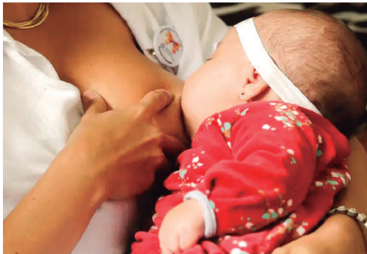
Estudo revela que amamentação prolongada reduz risco de câncer de mama em até 50% e traz benefícios adicionais para mães e crianças.

O mastologista Afonso Nazário destacou que o efeito protetor é mais significativo em mulheres abaixo dos 25 anos, pois o epitélio mamário é mais suscetível ao câncer nessa fase. "Acima dos 35 anos, o efeito da amamentação de-