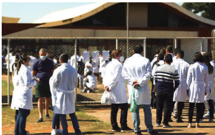
Inep libera cartão de confirmação do Revalida 2024.2; prova será em 25 de agosto.