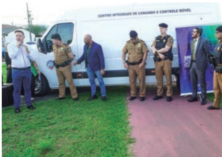
Operação Cidade Segura: Policiais reforçam patrulhamento com medidas preventivas e repressivas, incluindo policiamento aéreo, uso de cães policiais, bloqueios e fiscalizações, coordenados pelo CICCR.

A colaboração entre diferentes órgãos de segurança pública será uma característica essencial da operação,