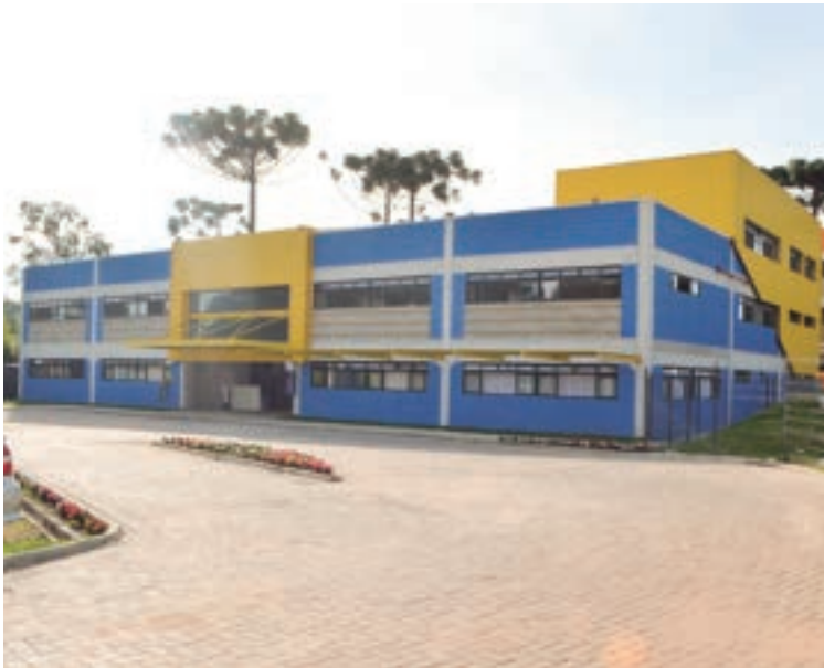
Trinta anos de educação inovadora e compromisso social: Escola Interativa expande sua missão para Colombo, uma jornada de transformação educacional e preparação para o futuro.

O coração da educação interativa desde o princípio,