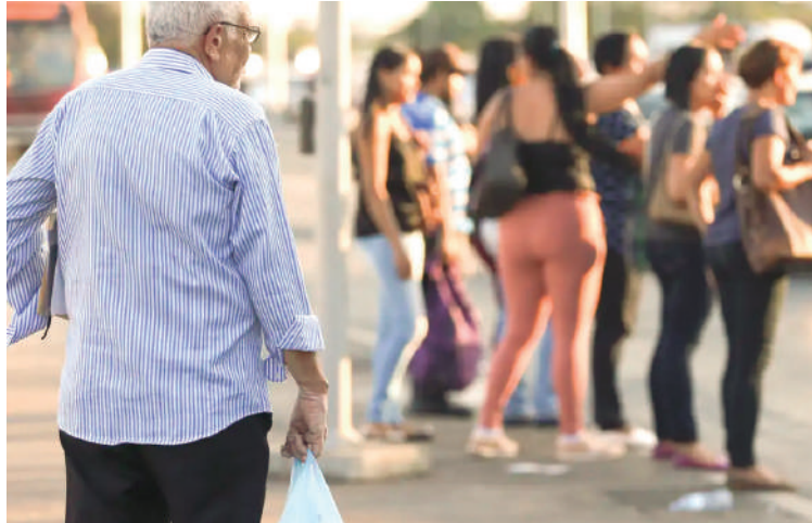
Antecipação do décimo terceiro, medida governamental alivia pressão financeira dos beneficiários do INSS.

Esta antecipação representa um esforço do governo para oferecer um suporte financeiro adicional em um momento desafiador para a economia e para as finanças das famílias brasileiras. Tradicionalmente, o décimo terceiro salário é um recurso muito aguardado, muitas vezes utilizado para o pagamento de dívidas, despesas extras ou para proporcionar um maior conforto nas festividades de final de ano. Ao antecipá-lo, o governo busca aliviar as tensões financeiras e