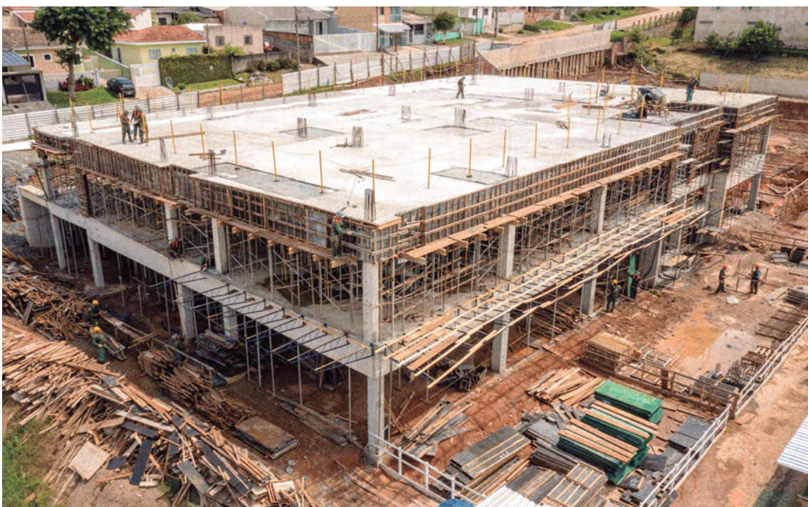
Operários trabalham diariamente para erguer as novas estruturas.