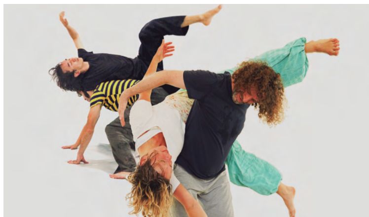
A oficina "Contato Improvisação", aborda um estilo de dança de contato com o outro e com o espaço.

Com um limite de 15 vagas, as inscrições serão aceitas por ordem de chegada, dando prioridade ao rodízio de participantes. Aqueles que já participaram de uma oficina anterior ficarão em lista de espera para possíveis vagas em futuras edições.