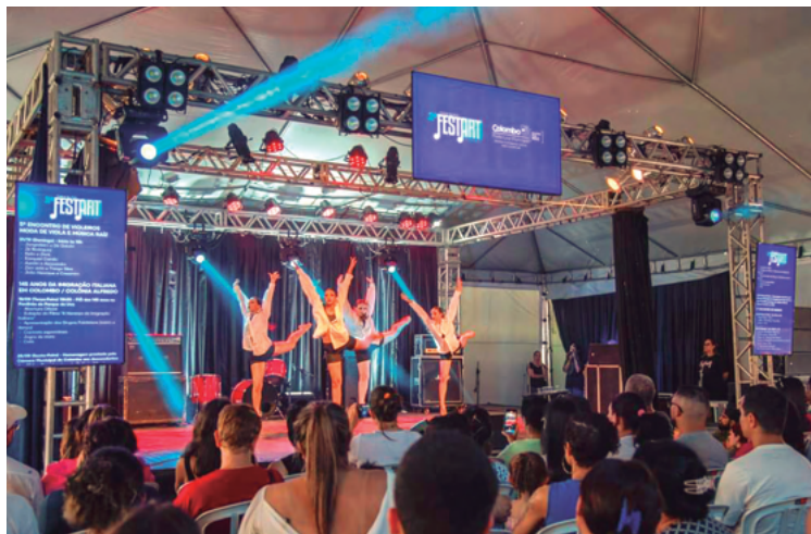
Cultura de Colombo caminha a passos largos nos últimos anos. São dezenas de ações que chegam a milhares de pessoas em diferentes segmentos.

O Departamento de Cultura promoveu eventos atrativos e acessíveis à população, como a apresentação memorável da Orquestra Sinfônica do Paraná. O Natal Mágico de Colombo foi celebrado por uma grande participação, enquanto o Festival Infância Feliz encantou mais de 40 mil pessoas com espetácu-