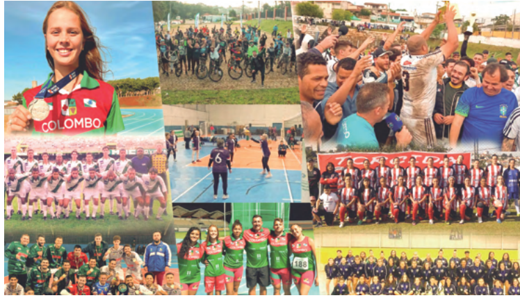
Colombo, o berço de talentos e histórias extraordinárias.