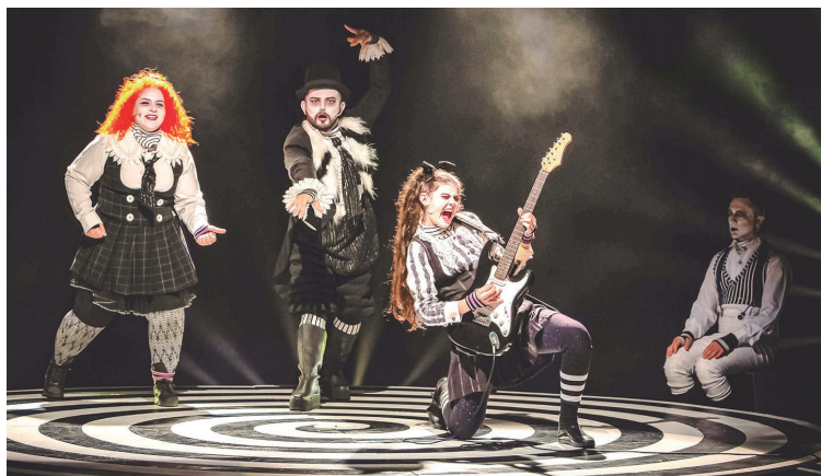
A CAIXA Cultural Curitiba apresenta “Cabelos Arrepiados”, O premiado espetáculo da Cia. Buia Teatro, de Manaus (AM).

A cenografia da peça é inspirada no universo da patafísica, a ciência das soluções imaginárias, do dramaturgo