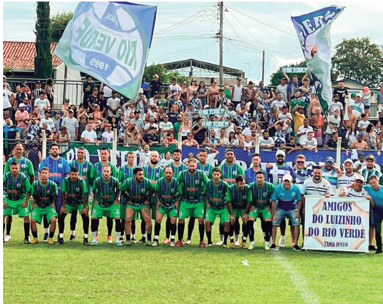
EC Rio verde Campeão série ouro 2023

A Liga de Futebol de Colombo umas das mais tradicionais do Paraná, cuja fundação remonta a 12 de outubro de 1981, por iniciativa dos clubes Colombo