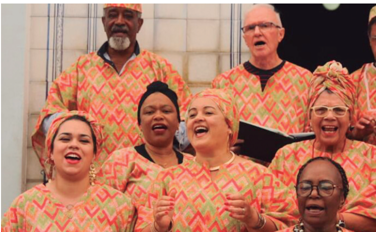
O Coral Negro de Curitiba iniciou as inscrições para este ano. As vagas são para cantores (as) e instrumentistas e podem ser feitas até dia 31 de janeiro. O grupo tem como objetivo colaborar com a ampliação do alcance da cultura negra na capital paranaense.