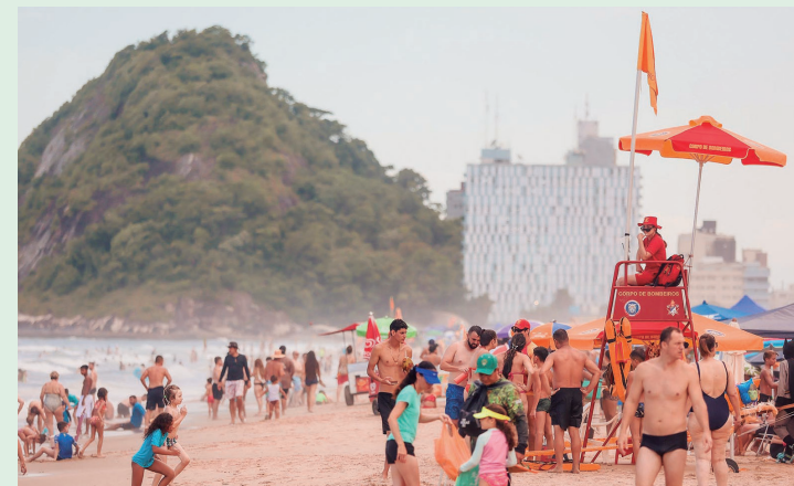
A câmera capta e transmite imagens de maneira instantânea ao CCO, o que proporciona uma visão mais ampla para os bombeiros e guarda-vidas.

Em outro caso, os bombeiros foram informados de um desaparecimento na Praia Brava, também em Matinhos, e a equipe deslocou o drone numa área de 3,5 quilômetros, sobrevoando a região e alimentando com informações equipes com motos aquática. As equipes acharam o corpo de um jovem de 17 anos.