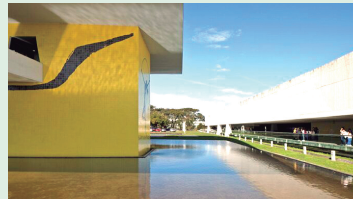
O Museu Oscar Niemeyer terá uma intensa programação em janeiro. A partir do dia 10, haverá diversas oficinas e ações para o público infanto-juvenil e famílias. As atividades acontecem até o dia 27.

Os ateliês abertos que acontecem na quarta-feira (dia em que a entrada é sempre gratuita) são isentos para todos e obedecem à ordem de chegada para a atividade. Nas quartas-feiras, os ingressos devem ser retirados diretamente na bilheteria e estão sujeitos a lotação de espaço.