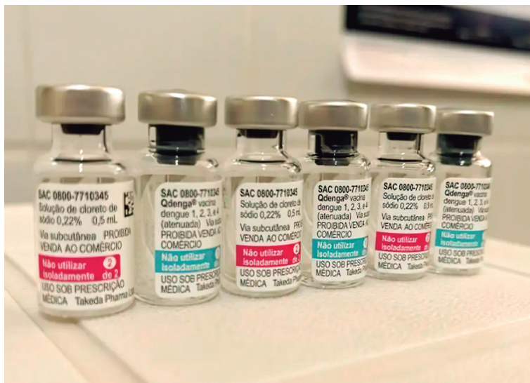
Previsão é iniciar imunização em fevereiro.

ou não contraído a doença anteriormente. O Brasil, sendo o primeiro país a oferecer a vacina no sistema público e universal, busca conter a escalada da dengue, que atingiu um recorde de 1.079 mortes em 2023, representando metade do total global de casos, segundo a OMS. Autoridades de saúde já alertaram para a possibilidade de uma epidemia da doença em 2024.