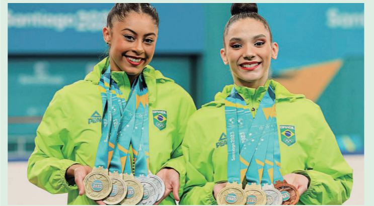
Maior programa de incentivo ao esporte na modalidade bolsa-atleta do País, o Geração Olímpica e Paralímpica recebeu R$ 5,2 milhões na sua 12ª edição.

No ano de 2023, o Paraná se destacou no cenário esportivo ao alocar mais de R$ 60 milhões para programas como o Proesporte e Geração Olímpica e Paralímpica, consolidando seu compromisso com atletas, técnicos e o desenvolvimento esportivo nas escolas estaduais. Um marco foi atingido com a destinação de R$ 50 milhões ao Proesporte, cujo edital 05 registrou um recorde de 302 projetos selecionados em dezembro, abrangendo até modalidades como esportes a motor. O aporte total do Estado atingiu a expressiva marca de R$ 78 milhões, fortalecendo ainda mais a posição do Paraná no mapa esportivo nacional. O Geração Olímpica e Paralímpica, com um investimento de R$ 5,2 milhões, concedeu 1.276 bolsas a atletas e técnicos, impulsionando conquistas nos Jogos Pan-Americanos e Parapan. Além disso, os bolsistas garantiram 14 vagas para Paris 2024. Ao longo de seus 12 anos, o programa já distribuiu mais de 15 mil bolsas, investindo R$ 50 milhões e beneficiando mais de 8,2 mil talentos, solidificando seu papel fundamental no cenário esportivo paranaense.