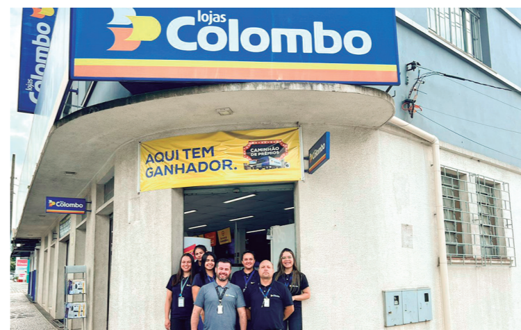
Lojas Colombo, renomada rede de varejo, anuncia a reinauguração de sua loja no Centro de Colombo.

Para marcar a reinauguração, a Lojas Colombo preparou ofertas exclusivas, incluindo condições especiais de pagamento. Durante a abertura, os clientes poderão desfrutar da menor parcela em 15X no Carnê fácil, com a opção de