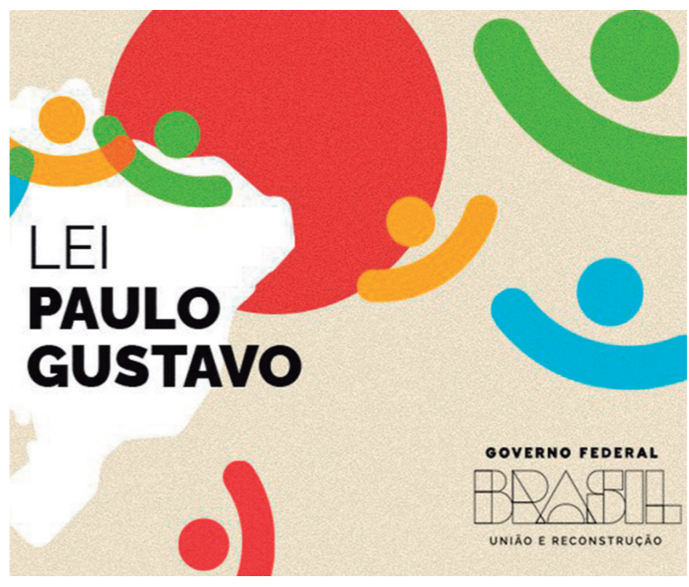
A Lei Paulo Gustavo (Lei Complementar nº 195, de 08 de julho de 2022) dispõe sobre ações emergenciais destinadas ao setor cultural a serem adotadas em decorrência dos efeitos econômicos e sociais da pandemia da covid-19.

O município de Colombo está prestes a vivenciar uma significativa transformação no cenário cultural, impulsionada pelos recursos da Lei Paulo Gustavo. Com um investimento direto que ultrapassa a marca de dois milhões de reais, provenientes do Governo Federal através da Lei Complementar nº 195/2022 - LPG, esta iniciativa representa um marco histórico para a cultura brasileira. Este importante financiamento, baseado na densidade populacional, visa revitalizar o setor cultural de Colombo. Trata-se de um apoio direto à cidade, concedido após o município atender a todos os requisitos preestabelecidos. O Edital de Chamamento Público de Fomento Direto em Audiovisual, por exemplo, distribui um total de R$1.180.000,00, enquanto os projetos de Fomento Direto em Outras Áreas de Cultura recebem aportes de R$ 567.000,00. E mais R$ 240.000,00 serão destinados aos projetos relacionados a Salas de Cinema e Cinema Itinerante. A captação destes recursos iniciou-se em abril de 2023, com o Departamento de Cultura da Prefeitura de Colombo mobilizando a Classe Artística Colombense. Desde então, essa comunidade dedicou es-