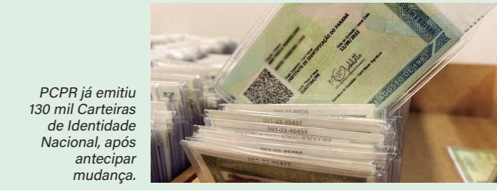
PCPR já emitiu 130 mil Carteiras de Identidade Nacional, após antecipar mudança.

Em 2023, foram emitidas 984.349 carteiras de identidade, um aumento de 19,28% em relação ao ano anterior. A média de expedição ultrapassou 980 mil, destacando o esforço conjunto da Polícia Civil, papiloscopistas e funcionários, atingindo quase 1 milhão de carteiras expedidas no ano.