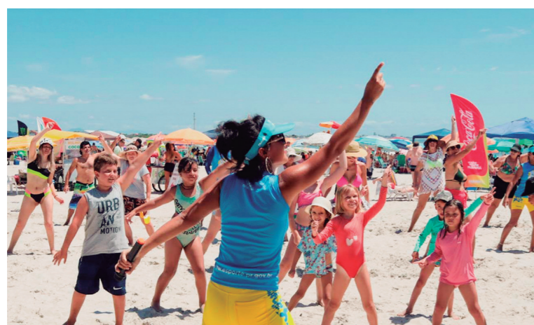
Veranistas e moradores do Litoral do Paraná, em diversão garantida com esporte, lazer e cultura.

para veranistas locais e de todo o Brasil. Helio Wirbiski, Secretário Estadual do Esporte, expressa satisfação ao ver o evento em pleno funcionamento, recebendo visitantes locais e internacionais, impulsionados pela chegada de cruzeiros no Porto de Paranaguá. A novidade deste ano é a Arena Gamer em Guaratuba, aberta das 14h às 22h, com três estações de jogos, incluindo 10 computadores gamers e 20 consoles PlayS-