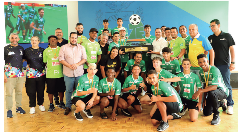
Governador recebe jovens paranaenses que levantaram a Taça das Favelas, em conquista inédita.

Ratinho Junior recebeu com entusiasmo a seleção paranaense que conquistou a Taça das Favelas em evento na quarta-feira (17). A vitória em 2023, ao derrotar o Espírito Santo por 2 a 1 na final em São Paulo, foi um marco celebrado. Ratinho Junior destacou o projeto além do esporte, promovendo a cidadania entre jovens. O Governo do Estado tem sido parceiro crucial, fornecendo suporte à Cufa e material esportivo. A seleção vitoriosa, composta por jovens de 15 a 17 anos de diversas comunidades paranaenses, enfrentou competição acirrada com mais de 11 mil participantes. Helio Wirbiski, secretário estadual do Esporte, ressaltou a inclusão de jovens não matriculados em eventos esportivos. José Antônio Jardim, presidente da Cufa no Paraná, enfatizou