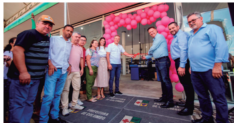
Juntamente, com a reabertura da unidade, foram lançados os Programas Direto do Campo e Linha do Armazém.

O Programa Linha do Armazém introduz uma nova linha de ônibus destinada a percorrer os Centros de Referência de Assistência Social (CRAS) e Centros de Convivência, ampliando o acesso