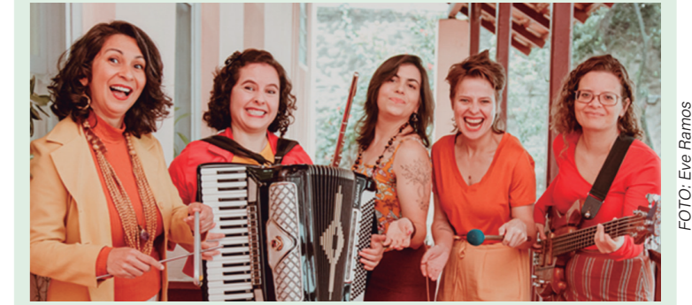
Muitas opções de shows e concertos com entrada grátis, na Oficina de Música de Curitiba.

A 41ª Oficina de Música de Curitiba apresenta 11 dias de programação repletos de shows e concertos gratuitos. Com 147 eventos no total, sendo 112 deles de acesso livre, a diversidade musical se estende por diferentes estilos, do erudito ao popular. Os palcos estão distribuídos pela cidade, incluindo locais como o Memorial Paranista, Teatro da Vila, Capela da Glória, Igreja Luterana, Bosque Alemão, Solar do Rosário, Biblioteca Pública, Con-