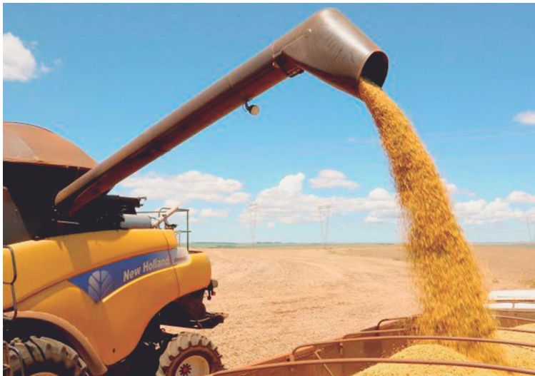
PIB do Paraná cresce mais do que o dobro da média nacional nos primeiros trimestres de 2023.

O levantamento do Ipardes aponta que todas as grandes atividades econômicas tiveram impacto positivo no crescimento do PIB estadual nos três primeiros trimestres. Na agropecuária, o Valor Adicionado Bruto (VAB), que difere do PIB apenas pela não incorporação dos impostos, cresceu 34,89%, como resultado principalmente