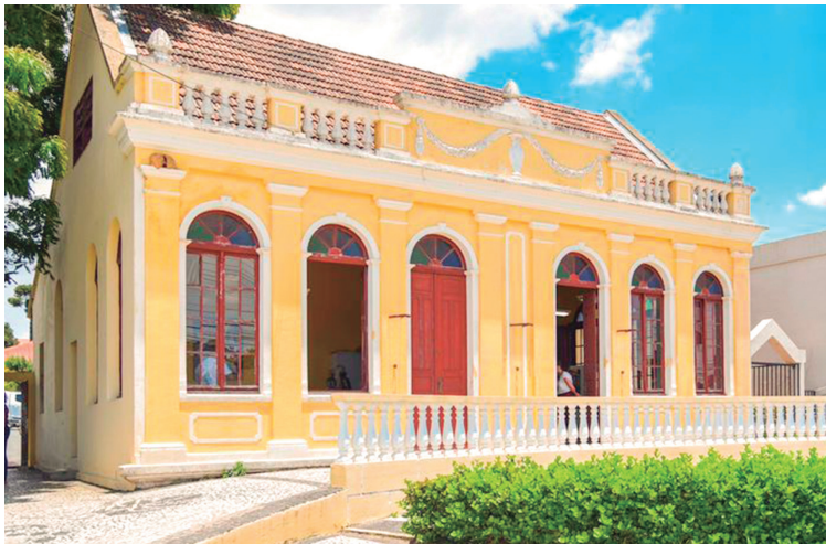
Prefeitura divulga projetos aprovados dentro da Lei Paulo Gustavo.

Além disso, o Departamento de Cultura alerta os