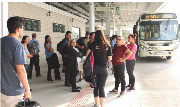
Amp divulga horários do transporte coletivo na RMC para o Natal e Ano-Novo

• 31/12/2023 - Domingo. Na véspera no Ano Novo vai vigorar a tabela de horários