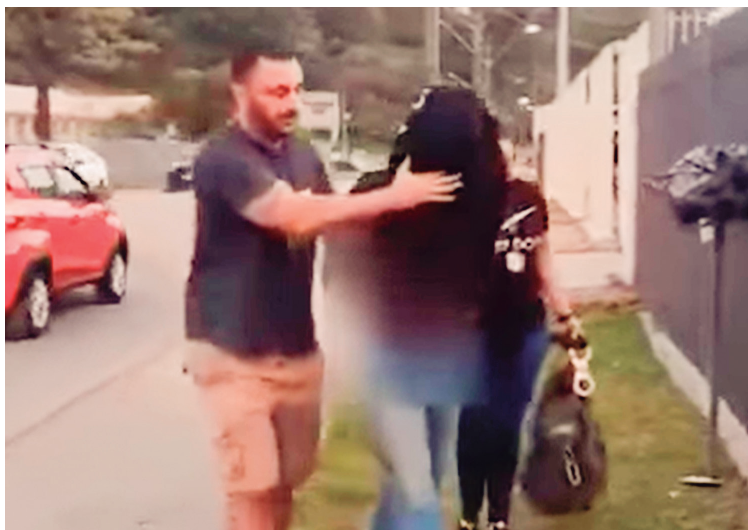
O homem de 48 anos foi preso por suspeita de estupro e gravidez de menor de 12 anos em Colombo. O crime teria ocorrido este ano.

Além do atual caso, o homem já era investigado por outros dois crimes de estupro de vulnerável contra meninas de sua própria família. Na delegacia, o suspeito admitiu os crimes imputados a ele durante o interrogatório conduzido pelo delegado. Após a prisão, o indivíduo foi encaminhado à Cadeia Pública de Colombo, onde permanecerá à disposição da Justiça para responder pelos terríveis atos cometidos.