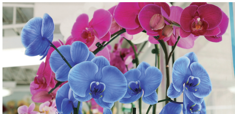
Orquídeas, crisântemos e roseiras se destacam nesse cenário.

A floricultura, que tem seu período mais representativo na primavera, estação que se inicia neste sábado (23), alcançou Valor Bruto da Produção Agropecuária (VBP) de R$ 224 milhões em 2022, de acordo com o Departamento de Economia