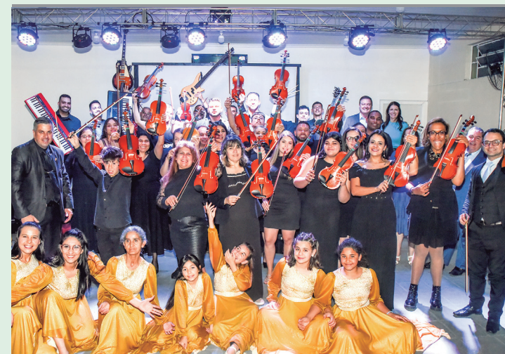
O projeto oferece aulas de flauta doce, violino e instrumentos de sopro. Gratuito e aberto para toda a comunidade.

Atividades: Aulas de flauta doce, violino e instrumentos de sopro;