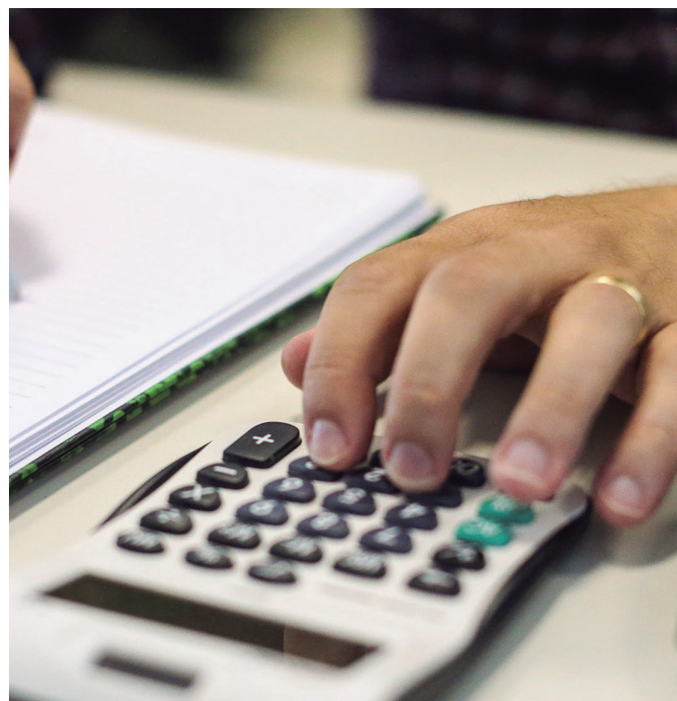
O prazo para adesão ao programa se encerra em 21 de dezembro de 2023.

a regularização de créditos junto à Secretaria Municipal de Fazenda, referentes a impostos (IPTU, ISS, ITBI), taxas, contribuições de melhoria e outros débitos de natureza não tributária acumulados até 31 de dezembro de 2022.