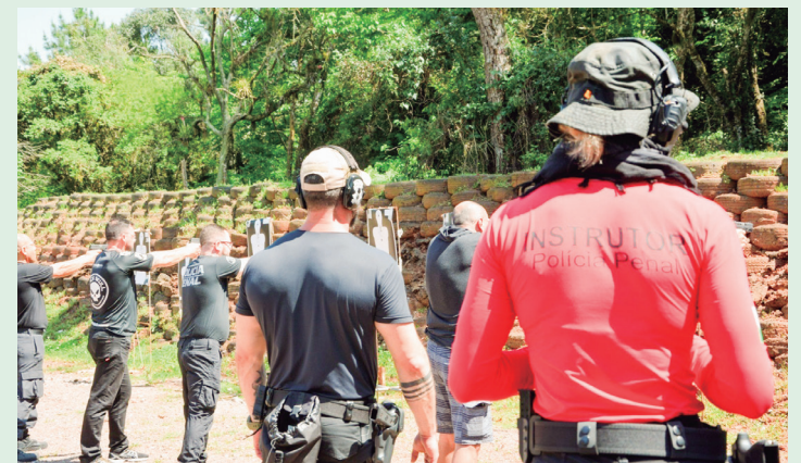
A Polícia Penal do Paraná (PPPR) formou 140 policiais no curso de Habilitação

Para ingressar no curso, os servidores apresentaram laudo individual com avaliação psicológica. A capacitação teve início com conteúdo teórico e o conteúdo prático só foi aplicado após aprovação em teste sobre os conteúdos ensinados. Junto às aulas práticas, os policiais passaram por teste de aptidão de tiro.