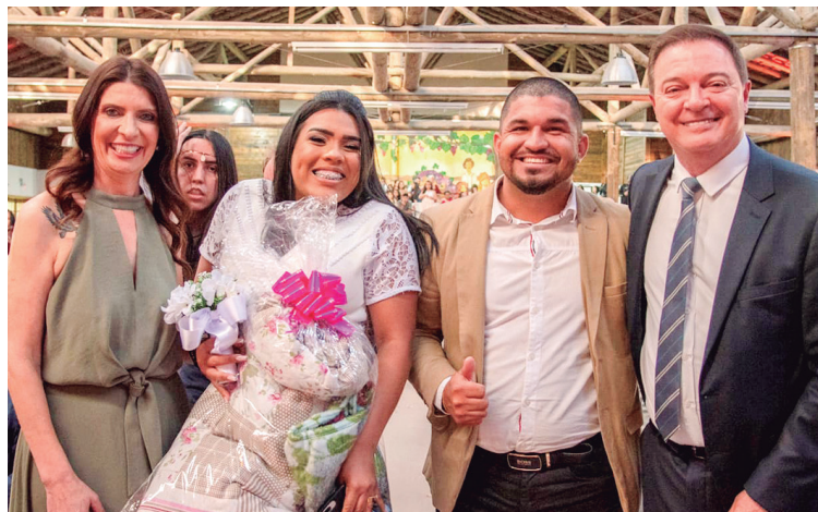
A cerimônia contou com a presença do Prefeito de Colombo, Helder Lazarotto, e da secretária de Assistência Social e primeira-dama, Elis Lazarotto.

Esse programa, uma iniciativa do Tribunal de Justiça do Paraná com o apoio da Prefeitura de Colombo