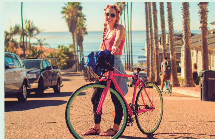
Em 22 de setembro, o mundo se une para celebrar o Dia Mundial Sem Carro, incentivando formas mais sustentáveis de locomoção e promovendo um meio ambiente mais limpo e saudável.

O Dia Mundial Sem Carro serve como um lembrete anual de que pequenas mudanças em nossos hábitos de locomoção podem ter um grande impacto no meio ambiente e na qualidade de vida das futuras gerações.