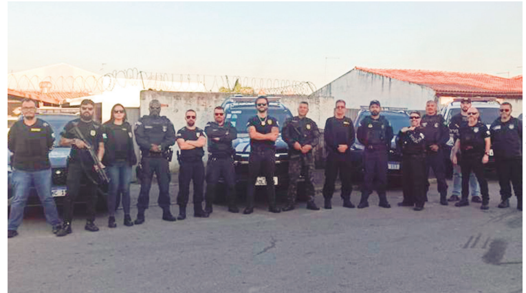
"Operação Saturação", é uma iniciativa vigorosa de combate à criminalidade, focada especialmente no tráfico de drogas e outros delitos.