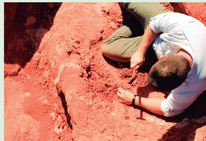
Fóssil tem características inesperadas, e é o mais bem preservado deste tipo já encontrado no Brasil.

"Pela primeira vez na história, a gente está conseguindo ter uma visão mais clara de que foram essas formas primitivas aos pterossauros. Ele é um fóssil muito importante, porque mostra onde foi que surgiram os pterossauros", concluiu Müller.