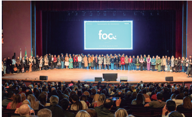
Atividades do seminário seguem até sexta-feira na sede da Unicesumar, no bairro Portão. Mais de dois mil professores de todo o Estado participam.

"Por isso é necessário investir em métodos que aprimorem a visão estratégica, a capacidade de tomada de decisões e as habilidades de gestão na criação de um ambiente propício ao aprendizado. A escolha dos temas