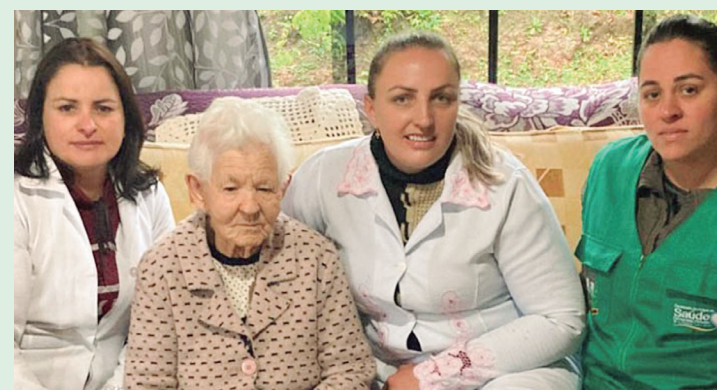
Mapeamento da população idosa ajuda a fazer o planejamento das ações da Secretaria de Estado da Saúde.

Um levantamento da equipe epidemiológica da Sesa apontou que as doenças do aparelho circulatório, infecciosas e parasitárias, além das neoplasias, são as causas mais frequentes de morte de pessoas acima dos 60 anos, no Paraná.