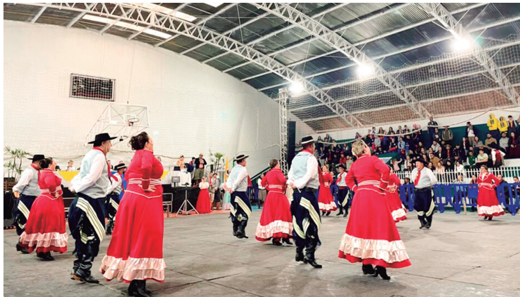
FEMOART fez parte da terceira etapa de classificação do Festival Paranaense de Arte e Tradição Gaúcha

Uma das responsáveis pela a organização do FE-