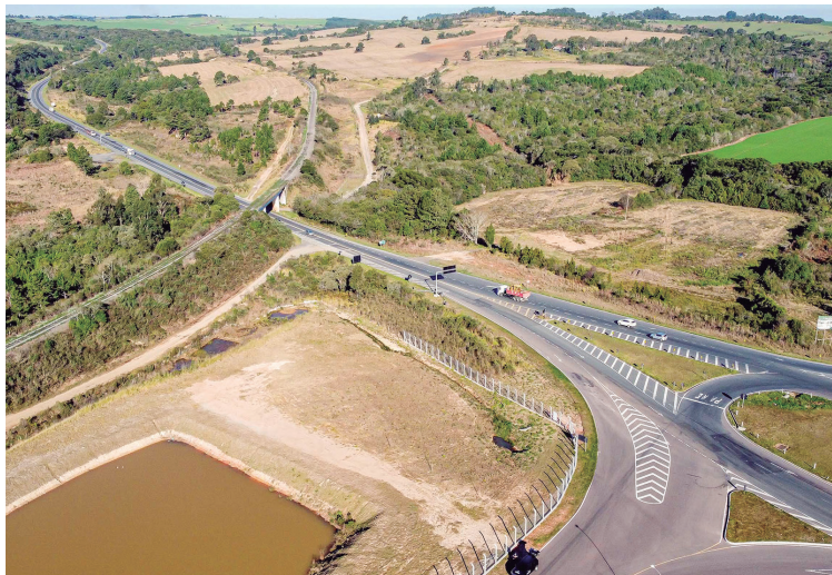
Definição da empresa ou consórcio vencedor acontecerá no dia 25 de agosto, na Bolsa de Valores de São Paulo, a partir das 14h.

Os contratos preveem que as principais intervenções sejam executadas nos primeiros