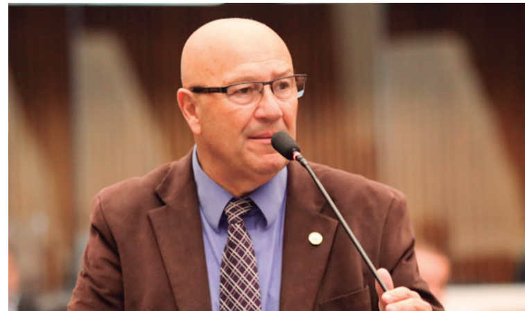
Rota turística começa em Colombo e passa por Tunas do Paraná, Bocaiúva do Sul e chega até Adrianópolis, para depois seguir pelo estado de São Paulo.

A rota, afirmou o deputado, começa em Colombo e passa por Tunas do Paraná, Bocaiúva do Sul e chega até Adrianópolis,