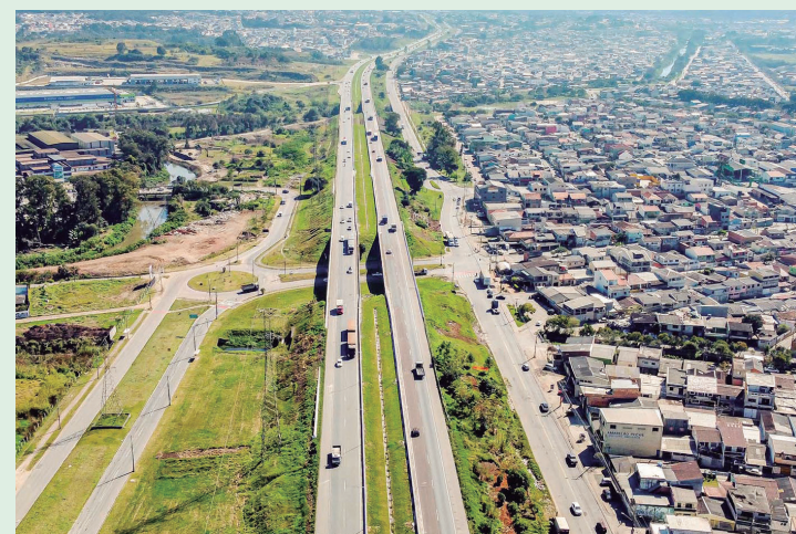
O Contorno Norte será duplicado inteiramente, desde o entroncamento com Colombo até a pista dupla já existente próximo ao trevo para Campo Largo.

Entre as obras de arte especiais, está previsto um novo viaduto do tipo diamante no km 6+920, atual trevo da Coopercarga, e outro no km 12+520, substituindo o trevo da Rua das Amoreiras. Também serão implementadas duas novas trincheiras, uma no km 1+330, no trevo ao término da pista dupla, e outra no km 17+890, substituindo a estrutura já existente.