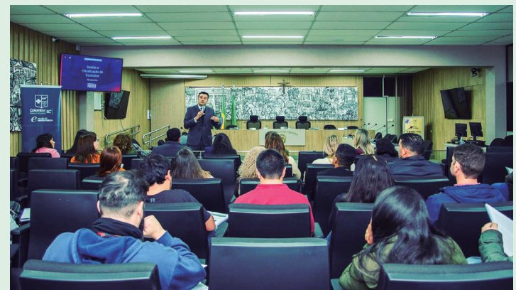
Por meio da Escola de Gestão, prefeitura promove iniciativa a todas as secretarias, visando a excelência do serviço público.

O curso ofertado, conta com aulas presenciais e pretende capacitar o servidor público em relação à execução contratual e orientar sobre as novas leis vigentes. Além de garantir a eficiência, potencializará os serviços da administração pública.