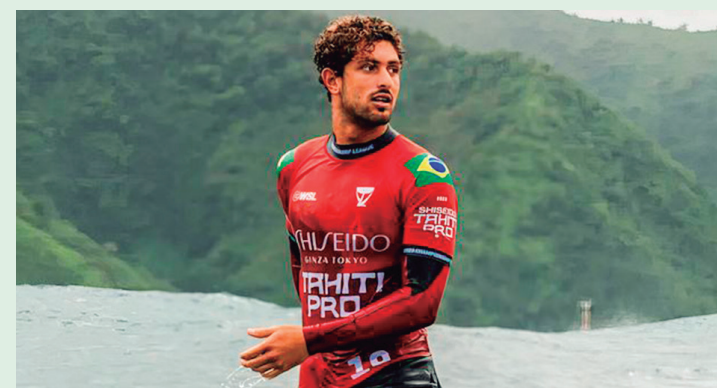
O WSL Finals está programado para o período de 8 a 16 de setembro, na praia de Lower Trestles, na cidade californiana de San Clemente.

O WSL Finals está programado para o período de 8 a 16 de setembro, na praia de Lower Trestles, na cidade californiana de San Clemente (Estados Unidos).