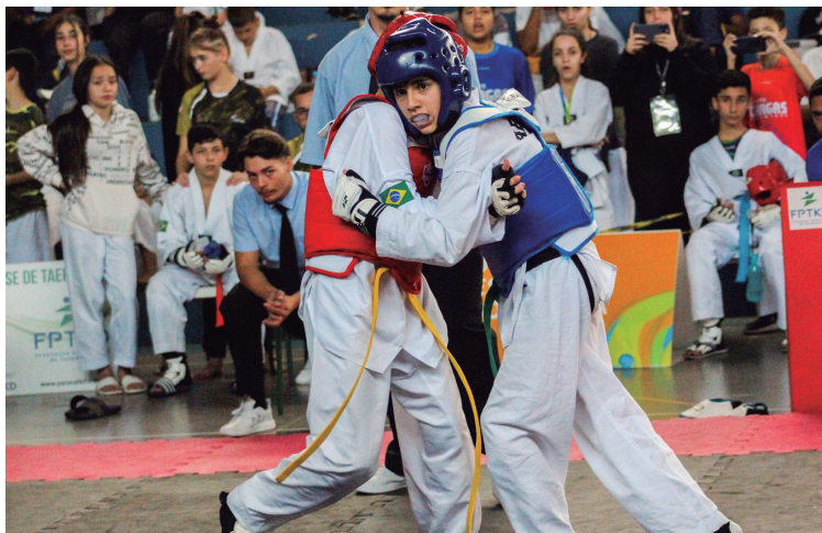
Escola Estadual Djalma Johnsson ficou no terceiro lugar masculino. Grande campeão foi colégio de Vitorino, que levou o masculino e feminino.

nadora dos JEPS, afirmou que os jogos foram um sucesso. "O saldo do evento foi altamente positivo, com índice técnico muito bom. Várias escolas públicas conseguiram o primeiro lugar nas modalidades coletivas", destacou. "Percebemos que precisamos nos adequar para um quantitativo maior de atletas. Os professores e as crianças