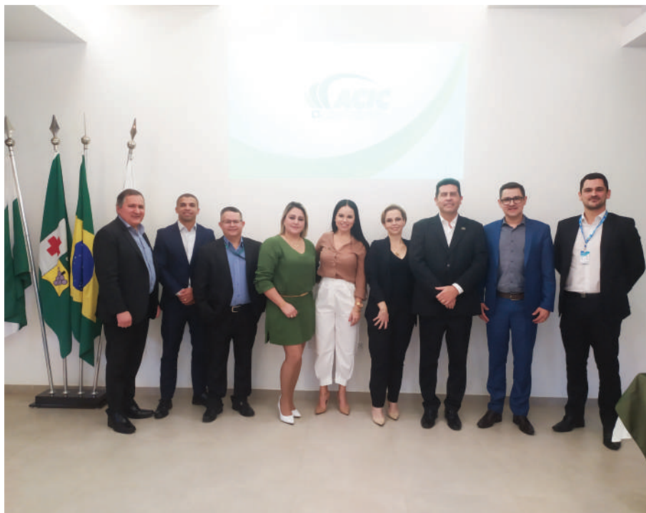
Reunião foi realizada na manhã desta quarta-feira (26), na sede da ACIC, no Jardim Arapongas.

Na manhã da última quarta-feira (26), a Associação Comercial, Industrial, Agronegócio e Serviços de Colombo (Acic) promoveu uma reunião para apresentação de um projeto de parceria com instituições financeiras que atuam no município. O objetivo é formar um grupo dessas instituições, e oferecer seus benefícios aos membros da Acic.