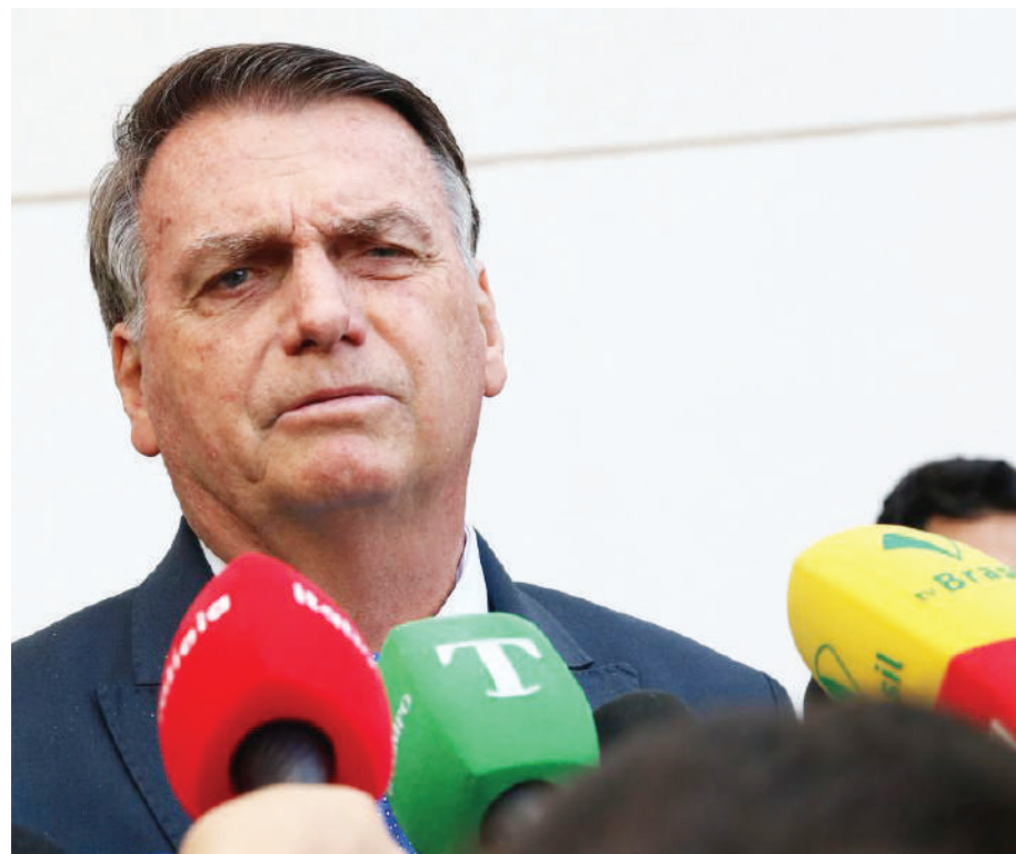
Bolsonaro confirmou encontro com senador Marcos do Val e ex-deputado Daniel Silveira, que atualmente está preso, mas negou conchavo golpista.

"Nada aconteceu no dia 8 de dezembro. Até porque não tinha nenhum vínculo com o senhor Marcos do Val. Que eu me lembre, nunca tive uma reunião com ele, nunca o recebi