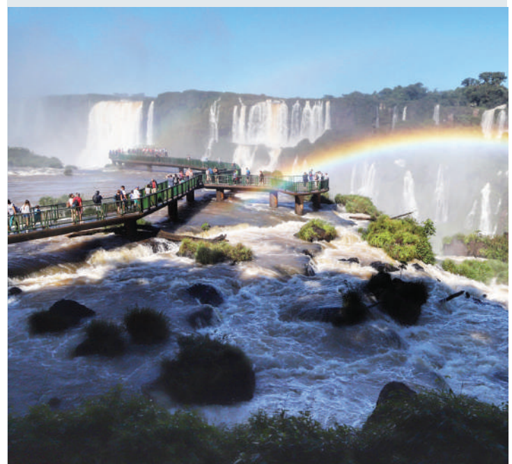
Maiores símbolos turísticos do Paraná, Parque Nacional do Iguaçu tem batido recordes mensais de visitação neste ano.

Sobre a movimentação da economia com o turis-