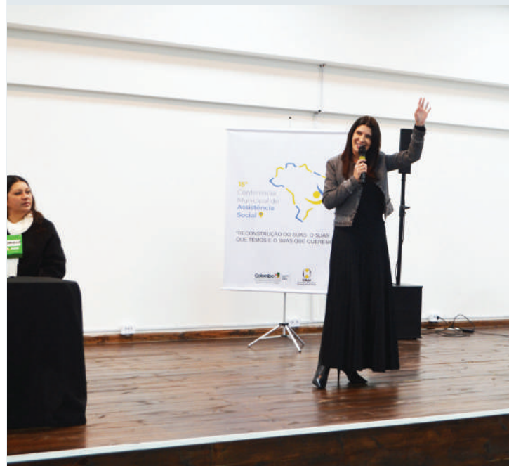
Evento antecede a Conferência Estadual, e serviu para a formulação de propostas e escolha dos representantes de Colombo na etapa estadual.

Durante o evento, os participantes foram divididos em grupos de trabalho, onde foram formuladas propostas a serem apresentadas na XIV Conferência Estadual de Assistência Social. Também foram escolhidos os delegados que representarão o município na etapa estadual.