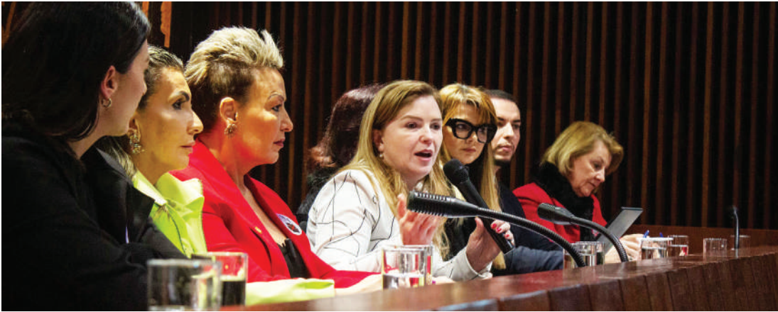
Ação prevê mobilização nas ruas, fóruns de debates e uma campanha publicitária contra qualquer forma de violência contra as mulheres.