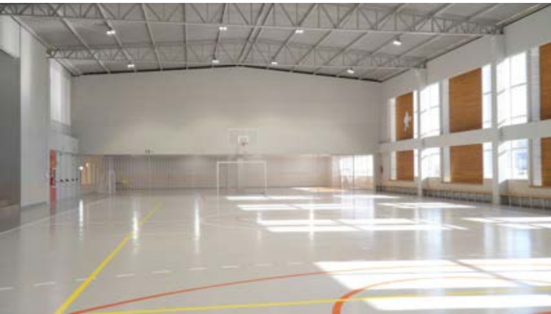
Com espaço para a prática esportiva, alunos da unidade de Colombo terão oportunidade de desenvolver mais que conhecimento teórico.

Atualmente, a Educação Adventista é a maior rede de ensino privado do mundo, marcando presença em 165 países, com mais 2 milhões de alunos e 8.500 instituições de ensino que vão, desde a Educação Infantil, até o Ensino Superior.