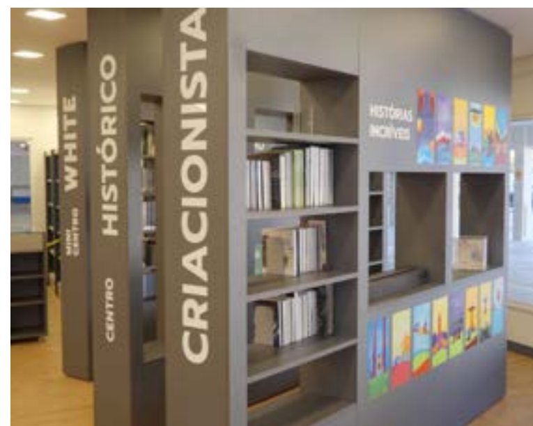
Metodologia de ensino investe na multidisciplinaridade e no apoio ao desenvolvimento individual como estratégia para formação humana dos alunos.