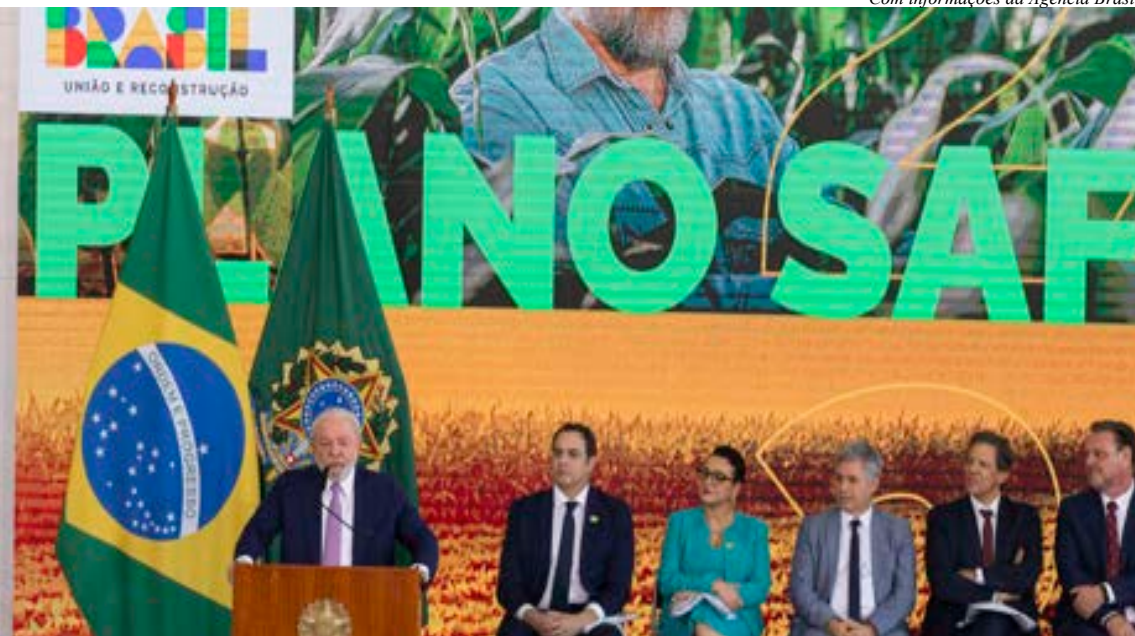
Recursos são quase 27% maiores do que do plano anterior. Frente Parlamentar Agropecuária reconheceu iniciativa do Governo.

O presidente Luiz Inácio Lula da Silva lançou, nesta terça-feira (27), o Plano Safra 2023/2024. Serão destinados R$ 364,22 bilhões para o financiamento da agricultura e da pecuária empresarial no país. O crédito vai apoiar grandes produtores rurais e produtores enquadrados no Programa Nacional de Apoio ao Médio Produtor Rural (Pronamp).