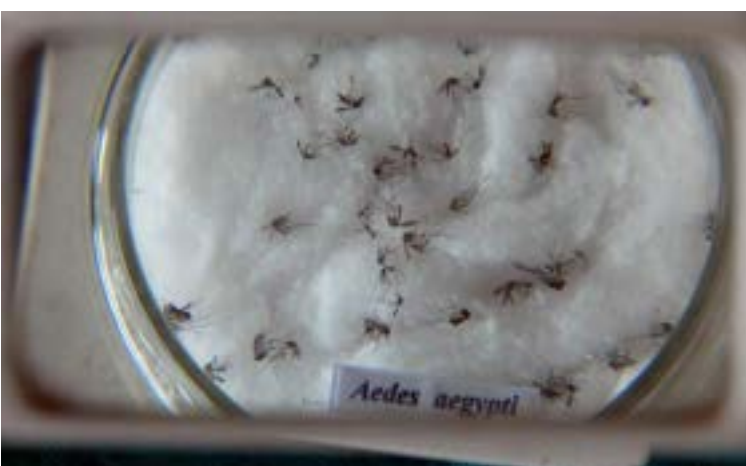
Vacina, aprovada pela Anvisa em março, estará disponível inicialmente apenas e laboratórios particulares.

A Associação Brasileira de Clínicas de Vacinas (ABCVAC) informou que uma nova vacina contra a dengue deve chegar ao Brasil nesta semana. Composta por quatro diferentes sorotipos do vírus causador da doença, a Qdenga, da empresa Takeda Pharma Ltda., foi aprovada pela Agência Nacional de Vigilância Sanitária (Anvisa) em março. De acordo com o órgão regulador, a dose confere ampla proteção contra a dengue.