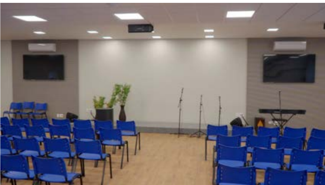
Colégio conta com auditório para realização de palestras e eventos com equipamentos novos e de qualidade.