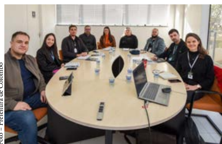
Trabalho de desenvolvimento do PDUI da Região Metropolitana é passo importante para integração e desenvolvimento dos municípios.