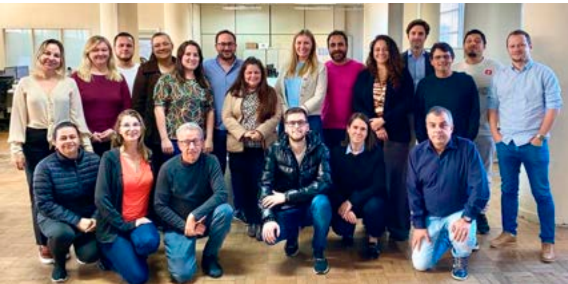
Programa proporcionou mais de US$ 235 milhões de investimentos em obras e elaboração de projetos estratégicos.

A Secretaria de Infraestrutura e Logística (SEIL), por meio do Departamento de Estradas de Rodagem do Paraná (DER/PR), realizou este mês uma reunião estratégica com o Banco Interamericano de Desenvolvimento (BID). O encontro serviu para avançar na discussão sobre a finalização do Programa Estratégico de Infraestrutura e Logística de Transportes do Paraná.