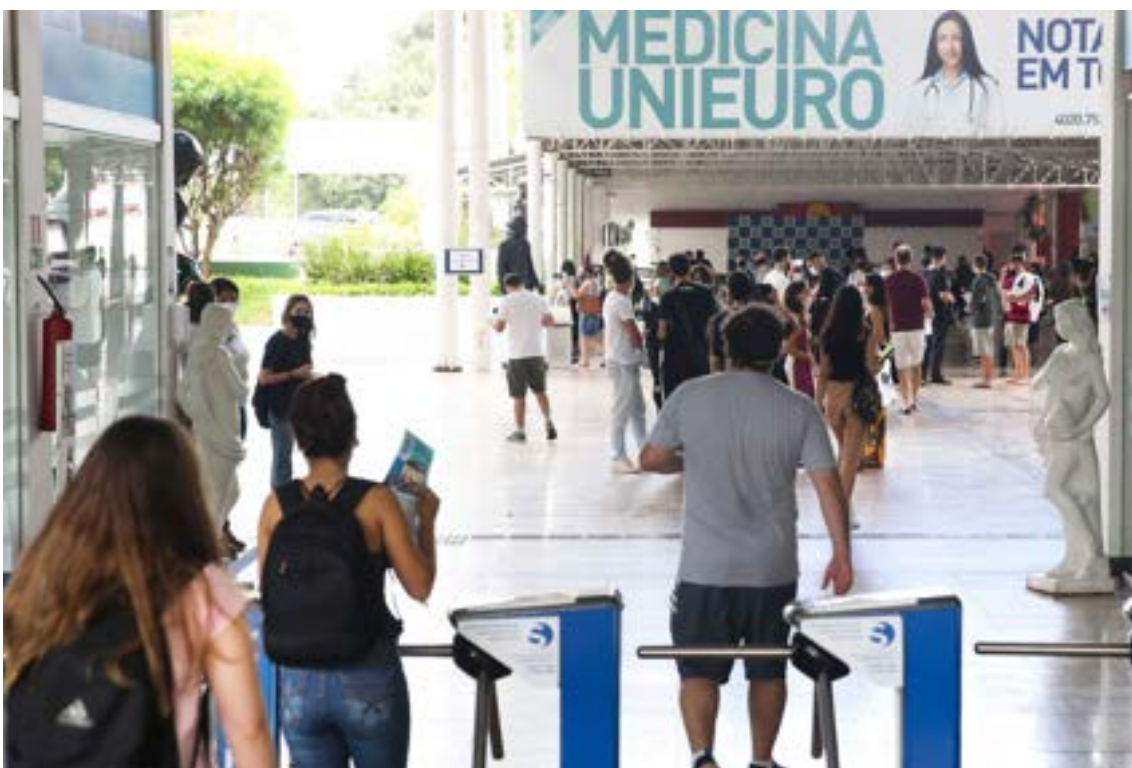
Período de inscrições segue até esta sexta-feira (30), e divulgação da primeira chamada acontece no dia 4 de julho.

Para ter acesso à bolsa integral, o estudante deve comprovar renda familiar bruta mensal de até 1,5 salário mínimo por pessoa. Para a bolsa parcial, a renda familiar bruta mensal deve ser de até três salários mínimos por pessoa.