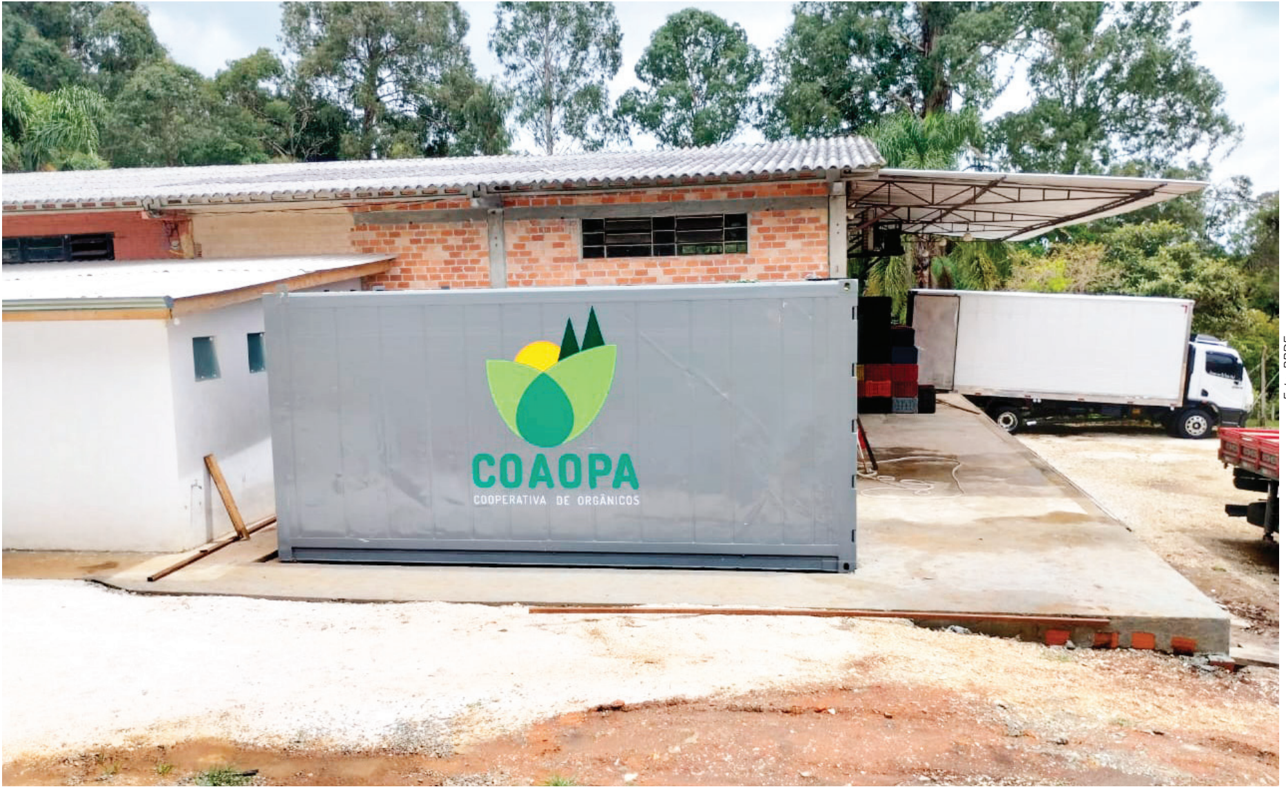
Melhorias estruturais permitem um suporte mais robusto à cadeia de produção dos seus 377 cooperados.