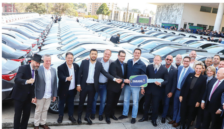
Com cinco veículos novos, Colombo foi o município que mais recebeu viaturas nesta entrega do Governo do Estado.

Com informações da Prefeitura de Colombo