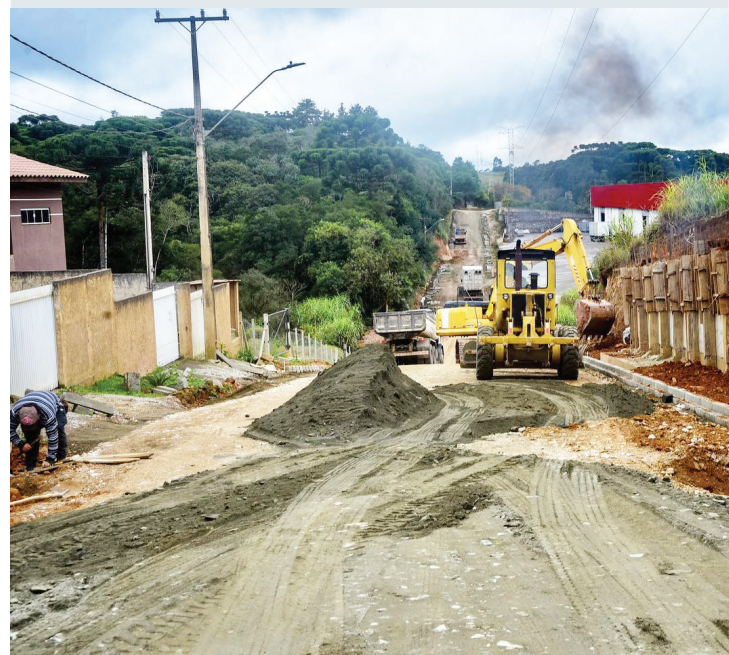
Obras de pavimentação nas duas vias representam investimento que ultrapassa R$ 2 milhões.

O projeto das duas vias públicas inclui base, sub-base, CBQU (Concreto Betuminoso Usinado Quente), meio-fio, calçadas, rampa para cadeirantes, paisagismo e arborização, sinalização horizontal, além de vertical e entrada para veículos e pedestres