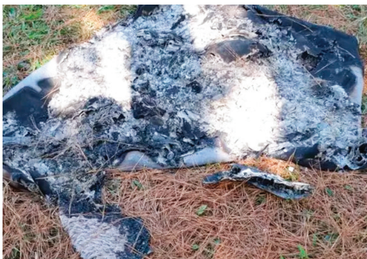
Polícia incluiu tapete na lista de buscas da investigação após notar falta do item na casa de Franciele.

No dia seguinte à prisão, a Polícia Civil localizou em Quatro Barras o tapete da casa de Franciele e Lago. Ele havia sido queimado e, no mesmo local, os investigadores ainda encontraram documentos do suspeito. A ausência do tapete foi sentida pelos próprios policiais, durante diligências na residência do casal.