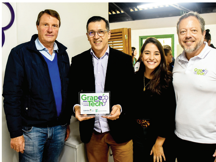
espaço integra o ecossistema de inovação que o município está criando, o Grape Tech.