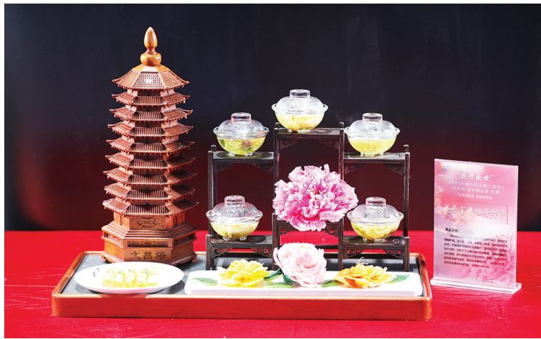
Participação no concurso de culinária: "Biscoitos de camarão com flores de peônia", contribuição do Hotel Yuncheng South Lake.