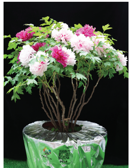
Participação no Concurso Nacional da Flor Peônia: "Hua Erqiao", contribuição da Cooperativa Especializada em Plantio da Peônia Heze Luhe.