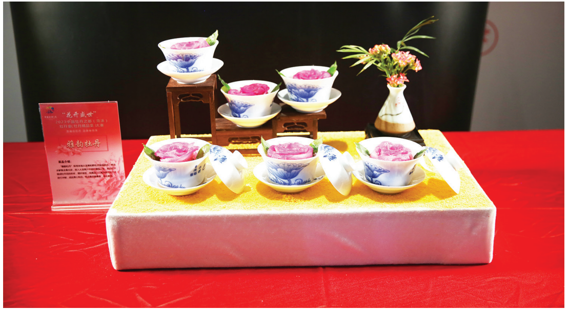
Participação no concurso de culinária: A elegância da Peônia

giões de Taiwan na China, das quais 184 inscrições ganharam os prêmios. Os trabalhos seletivos, vívidos e realistas foram um elogio às peônias, apresentando as melhores técnicas que retrataram o artesanato e a alma das flores em detalhes requintados. O evento permitiu que a cultura e a arte da peônia cruzassem o tempo e o espaço, bem como as fronteiras nacionais, continuassem a lenda da peônia e da cidade e abrissem uma janela para o mundo abraçar um futuro brilhante.