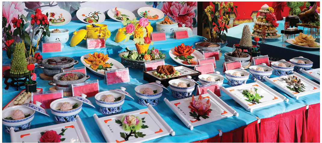
Participação no concurso de culinária: "Banquete de Peônias em Benefício da Saúde", contribuição do Hotel Internacional Yinsheng.