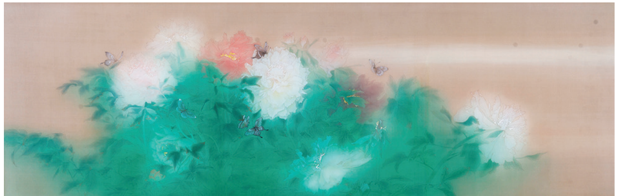
Participação no concurso de belas artes: "A estação florescente", contribuição de Li Qing.