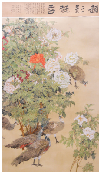
Participação no concurso de belas artes: "Sombra e Aroma", contribuição de An Jing.