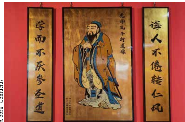
A obra “Confucius”