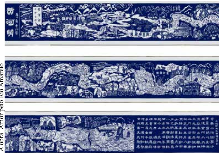
A obra “Amor pelo Rio Amarelo”

ticada há muito tempo. Durante a Dinastia Han, os habitantes locais tinham o costume de cortar folhas de ouro e prata, além de seda colorida em imagens de pássaros e flores para usá-las nos templos. Posteriormente, com a invenção do papel, o papel colorido foi recortado em imagens de animais e plantas,