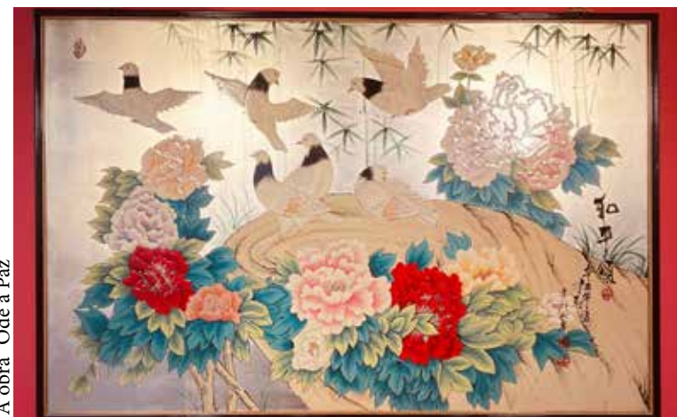
A obra “Ode à Paz”