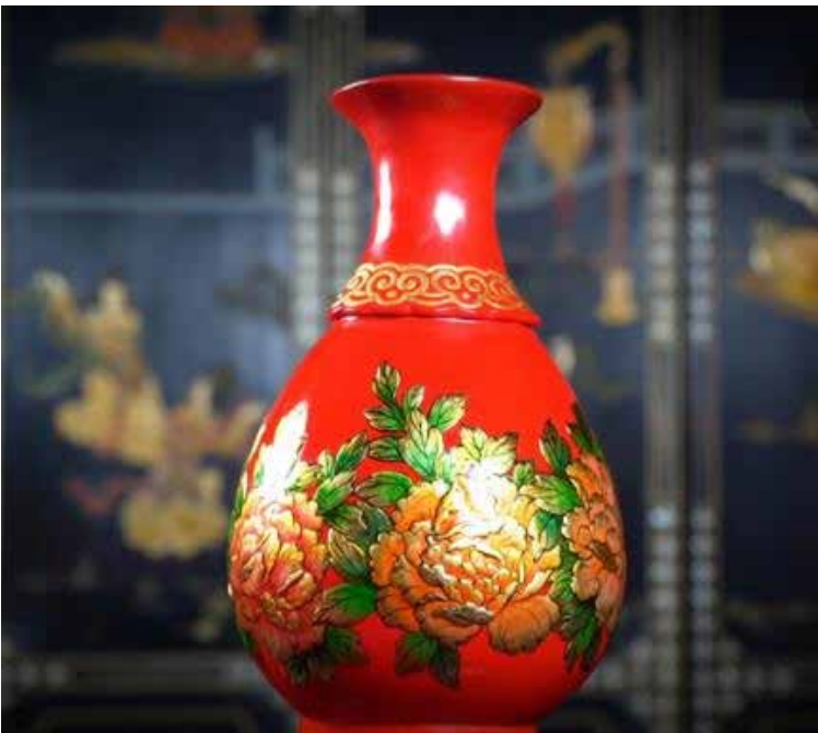
A obra “A Era do Florescimento”

Um mundo é incorporado em cada peça de laca. Em Yuncheng de Shandong, a técnica de lacagem foi listada entre os patrimônios culturais imateriais nacionais sob proteção. Como um dos berços da arte de laca, Shandong é abençoada