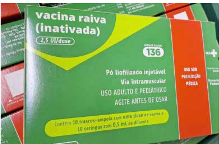
Imunizantes foram distribuídos às Regionais de Saúde e são suficientes para atender a demanda mensal dos municípios.

O Paraná recebeu, nesta terça-feira (20), 10 mil novas doses da vacina antirrábica humana. Esta zoonose (doença infecciosa transmitida entre animais e para as pessoas) tem alto índice de letalidade, e o lote recebido é suficiente para atender a demanda mensal das Regionais de Saúde.