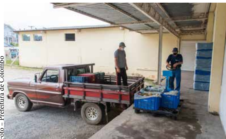
Ao adquirir o excedente da produção de hortifrutis, a Prefeitura gira a economia e ajuda a abastecer entidades de assistência social.

A Prefeitura de Colombo tem trabalhado para fomentar a agricultura familiar no município. Uma das formas de fazer isso é pelo Programa Municipal de Aquisição de Alimentos Direto do Agricultor Familiar, promovido pela Secretaria de Agricultura e Abastecimento. Além de girar a economia local, a iniciativa ajuda a levar alimentação saudável às mesas das famílias em situação de vulnerabilidade social.