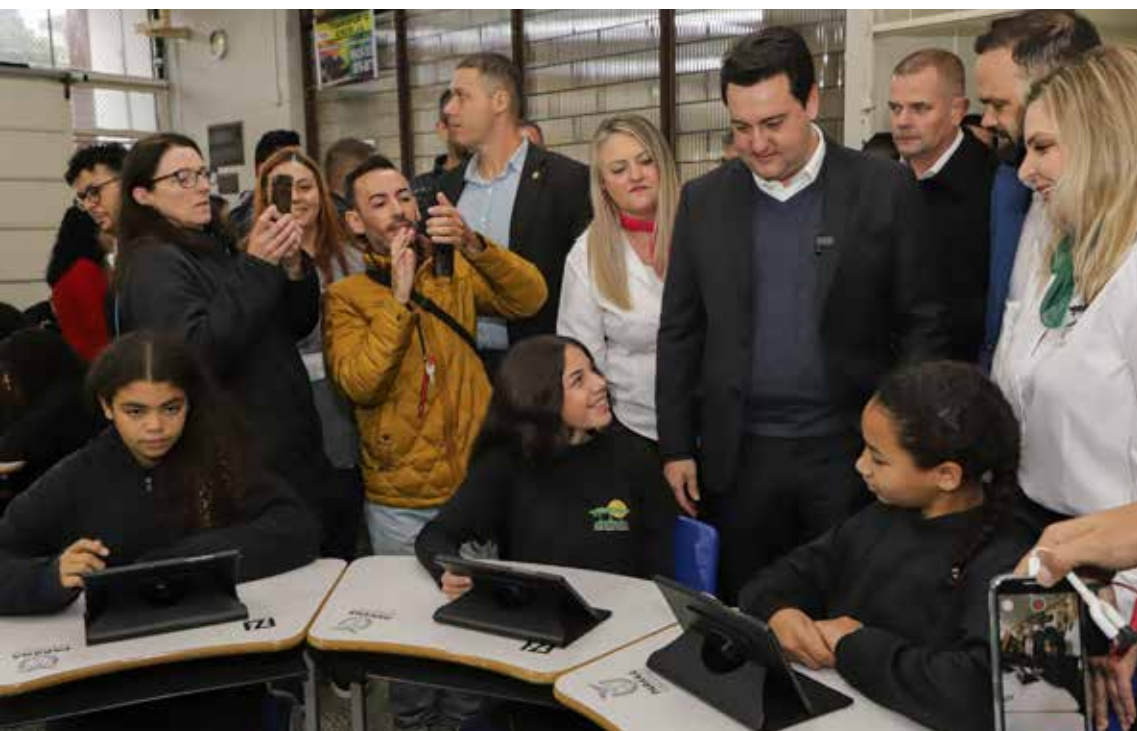
Foram entregues 18,2 mil equipamentos e outros 31,8 mil deverão chegar até o fim de julho.

Além dos tablets, a Secretaria distribuiu 77.300 equipamentos de informática às escolas da rede estadual de ensino. São novos computadores e notebooks, além de kits de robótica, que somam um investimento de aproximadamente R$ 200 milhões do Governo do Estado. Entre 2019 e 2022 foram adquiridos e distribuídos mais de 80 mil notebooks/computadores para os colégios.