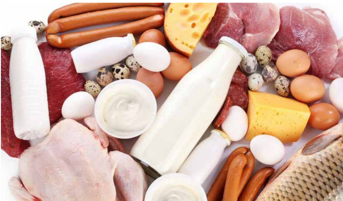
Serviço de Inspeção Municipal assegura qualidade e segurança dos produtos de origem animal de Colombo.

Atualmente, o município possui 13 empresas já cadastradas e com registro dos produtos comercializados. Estamos falando aqui de empresas de pescadao, de autosserviço, de entreposto de carnes e fábrica de embutidos.