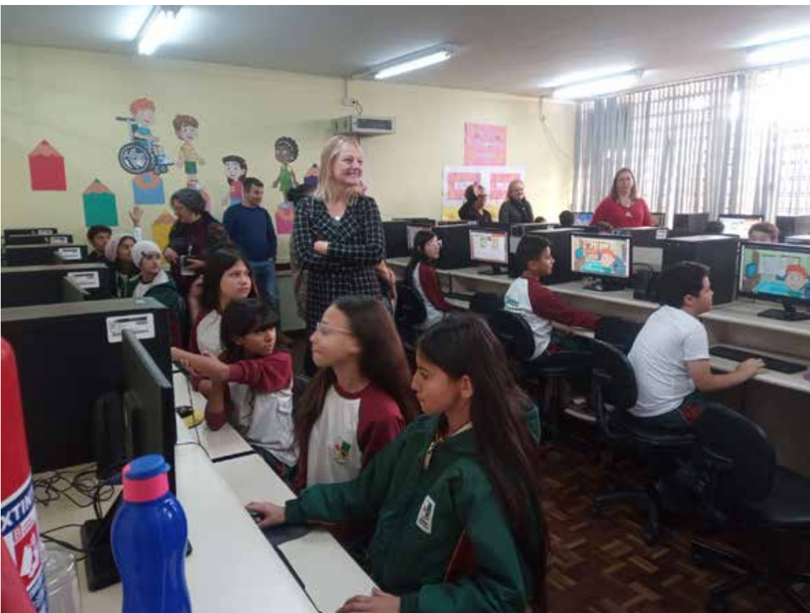
Aplicação da tecnologia para aumentar desempenho escolar dos alunos da Rede Municipal de Colombo tem sido reconhecida local e nacionalmente.

O uso de novas tecnologias na educação, prática adotada e cada vez mais fomentada pela Prefeitura de Colombo, tem tornado o município uma referência na área. Laboratório de Informática Educativa, Portal Educacional, Lousa Interativa, Mesinhas Interativas para a educação infantil e outras iniciativas têm ajudado a ampliar o conhecimento de cerca de 27 mil alunos da Rede Municipal.