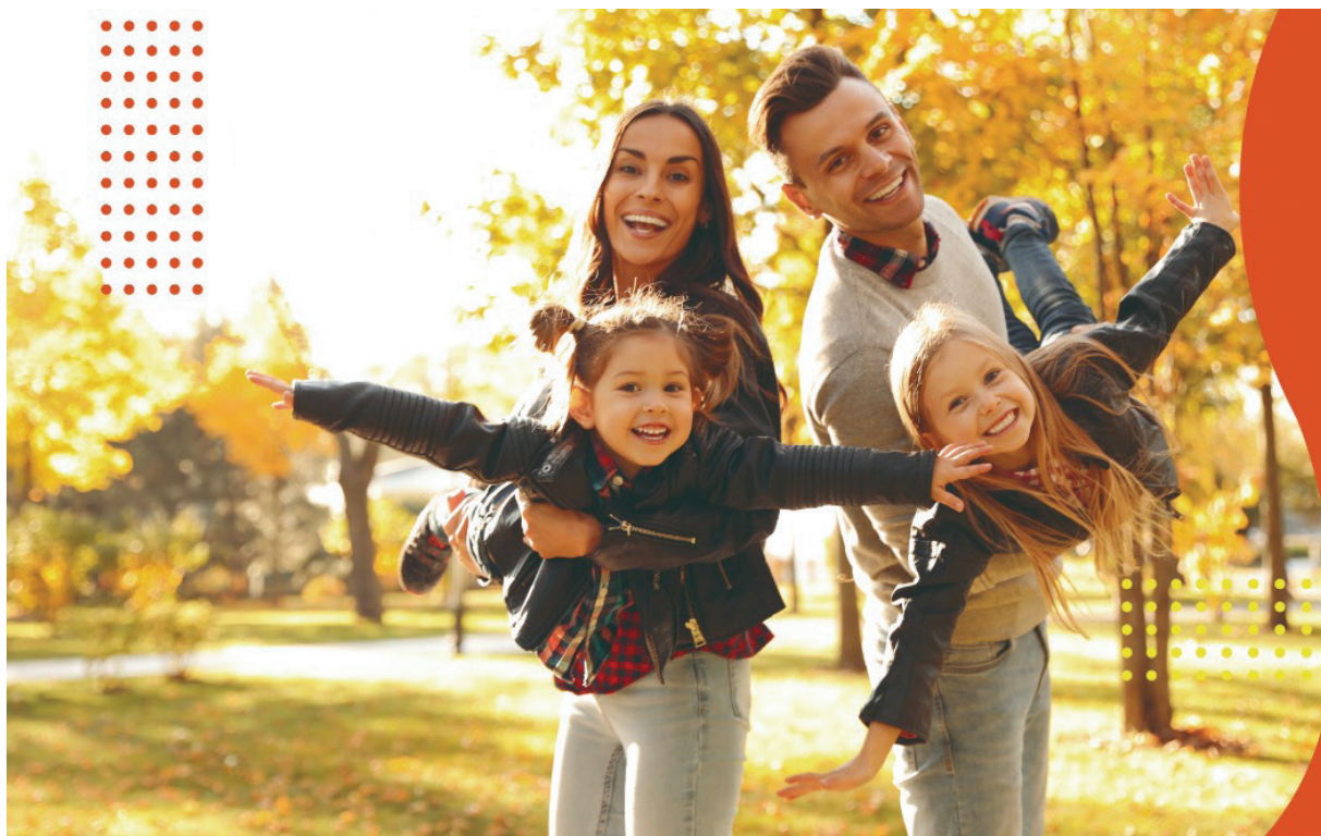
Inscrições para exames EJA do ensino médio começam nesta segunda-feira (24)

Já pensou em se tornar associado do maior Clube da América Latina?