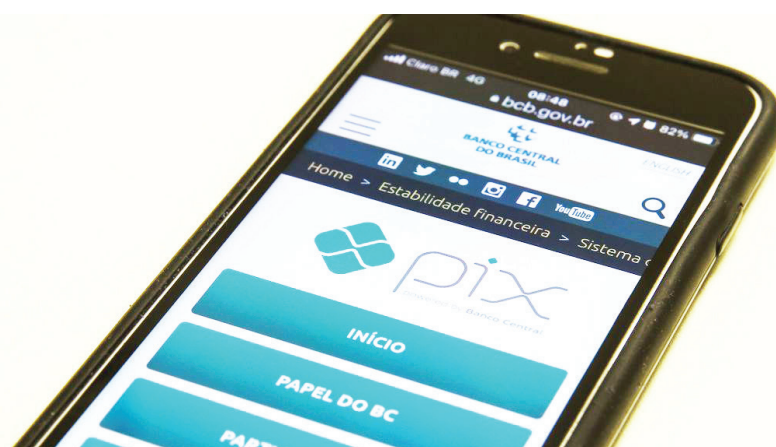
Valor movimentado em março bate recorde e atinge R$ 1,28 trilhão.

Principal meio de pagamento dos brasileiros, o Pix bateu recorde em março. Segundo números divulgados nesta quarta-feira (19) pelo Banco Central (BC), ocorreram 3,003 bilhões de operações no mês passado.