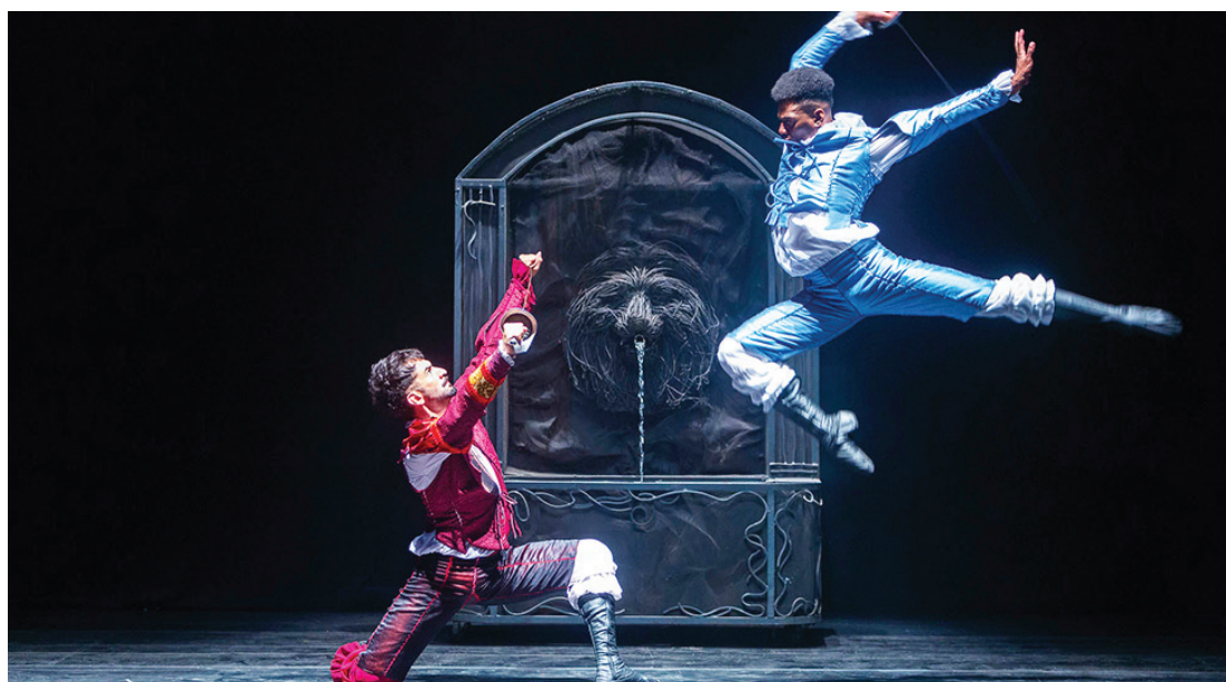
Balé Teatro Guaíra e Orquestra Sinfônica reinterpretem “Romeu e Julieta”