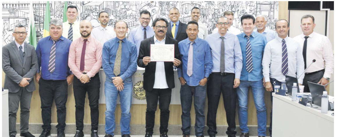
JP foi homenageado com o diploma de Votos de Congratulações pela sua significativa contribuição com o serviço social de mídia da cidade de Colombo

Atualmente, Jotapê exerce a função de assessor especial do Governador Ratinho Junior e