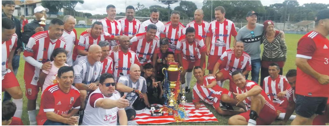
Nos pênaltis, o Imperial FC garantiu o título da LALIGA MÁSTER/45 Copa Libertadores (JC Maia)

A equipe do Imperial FC conquistou no último dia 8 de abril o título da LALIGA MÁSTER/45 Copa Libertadores (JC Maia), em jogo único contra o Quarenta Graus, no Estádio Solar do Bosque, pertencente a A.E.R Renovicente, em Curitiba.