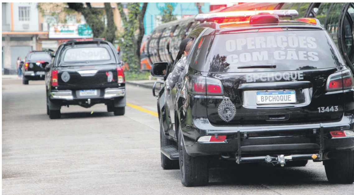
Polícia Militar do Paraná atendeu 2.231 ocorrências durante a Operação Páscoa

A Polícia Militar do Paraná (PMPR) atendeu 2.231 ocorrências durante a Operação Páscoa, entre os dias 6 e 10 de abril, no feriado prolongado. A ação visou reforçar o policiamento ostensivo preventivo não só nos locais de maior movimentação de pessoas em todo o Estado, mas também nas rodovias estaduais, devido ao aumento do fluxo de turistas no período.