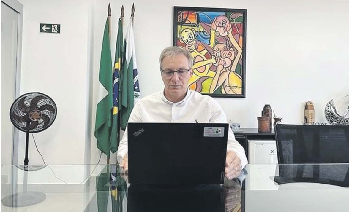
Prefeitura de Colombo