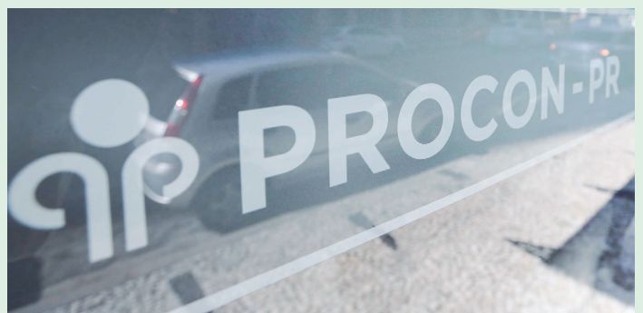
Mutirão é oportunidade de colocar a vida financeira em ordem e limpar o nome nos serviços de proteção ao crédito.

Terminado o prazo para resposta do fornecedor, o consumidor tem 20 dias para avaliar o retorno dado. Participam do Mutirão bancos e instituições financeiras.