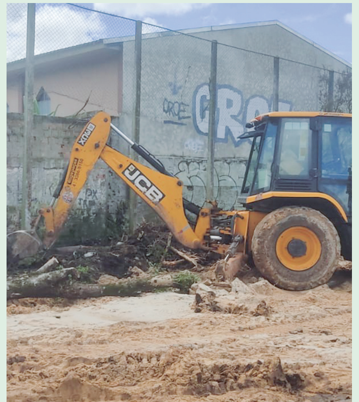
Prefeitura de Colombo tem investido na construção e revitalização de praças esportivas pelo município.

Além dessa, há ainda canchas de areia a serem entregues no Águas Fervidas, Jardim Macaé, Vila Liberdade, Jardim das Graças, Centro Industrial Mauá, Jardim Petrópolis, Jardim Modelo, Monte Castelo e Jardim Santa Cruz.