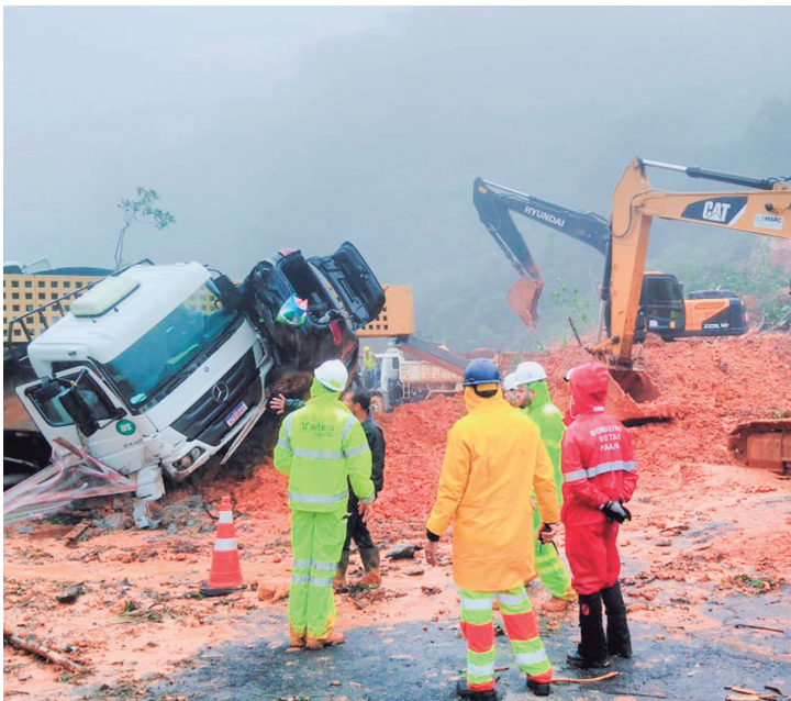
Apesar de pouco habitada, a Serra do Mar abriga um dos principais corredores logísticos do Paraná, com alto fluxo de veículos e caminhões.

De acordo com a Defesa Civil, foram registradas mais de 2.500 ocorrências relacionadas às chuvas, que foram de 230 mm ao longo de 48 horas. Devido ao acontecimento, quatro pessoas morreram e mil ficaram desalojadas. Ao todo, 18 mil pessoas foram afetadas.