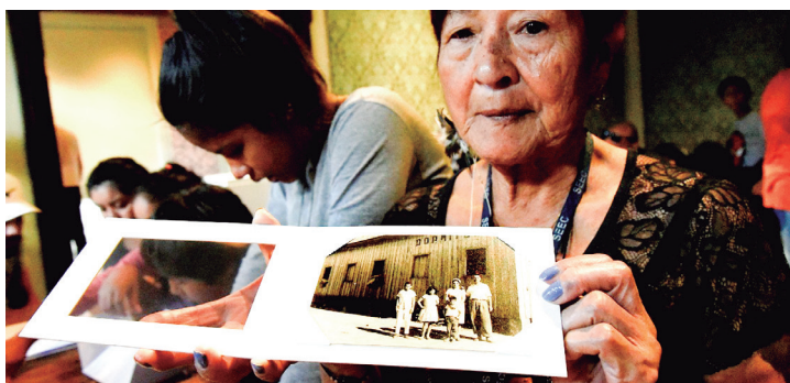
Esta é a área artístico-cultural que mais cresceu em inscrições comparativamente com a última edição do Profice.

Dúvidas devem ser encaminhadas para o e-mail profice@secc.pr.gov.br . Para mais informações, acesse o site cultura.pr.gov.br/PROFICE .