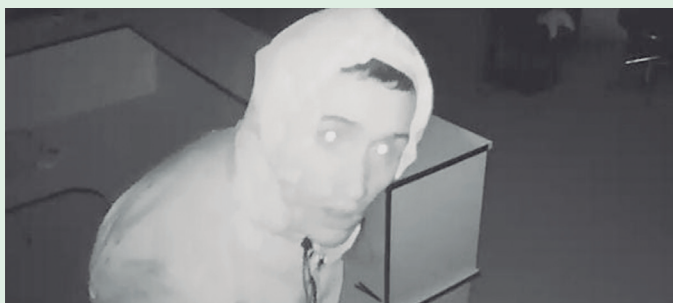
Polícia Civil pede a colaboração da população para identificação do homem que cometeu este assalto. Denúncias são anônimas.

O elemento dopou os cães do local e ainda destruiu o equipamento de segurança, o que não evitou dele ter sido filmado. Quem souber de alguma informação que possa identificar o indivíduo, pode ligar para o telefone 197 da Polícia Civil (Cepol). O anonimato é garantido.