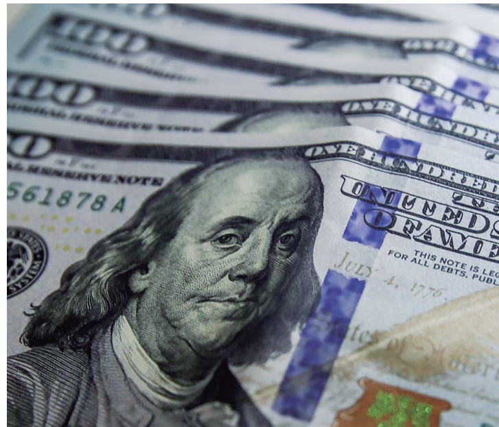
Boletim Focus aponta que 2023 deve fechar com inflação de 5,39%. Teto da meta inflacionária é de 4,75%.

“ A meta será considerada formalmente cumprida se oscilar entre 1,75% e 4,75% ”