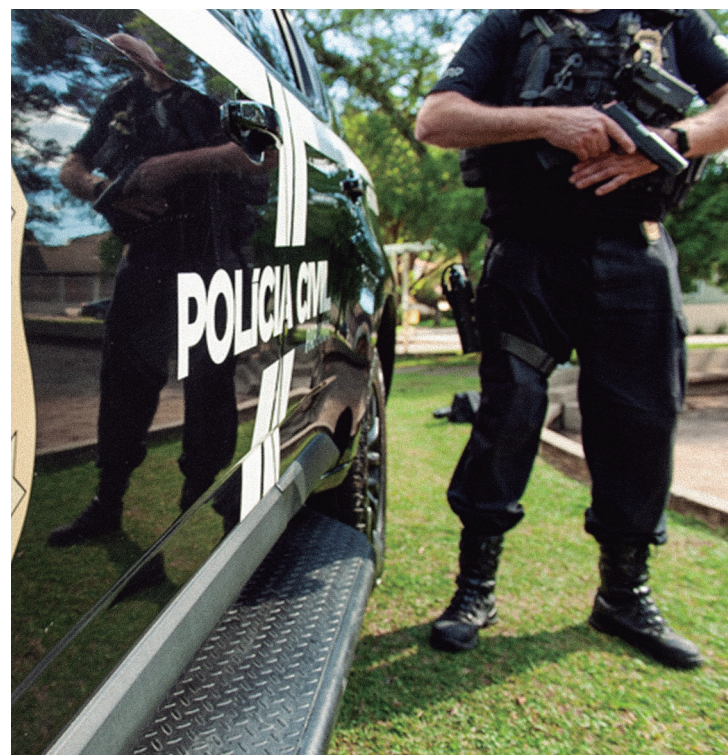
Denúncias anônimas após um furto de equipamentos no início do ano levou a polícia aos autores e receptores das mercadorias.

A Polícia Civil reforça a importância da colaboração da sociedade na solução de crimes. O repasse de informações