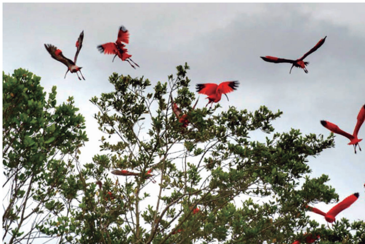
Espécie quase desapareceu entre 1928 e 2008. Ações de preservação e cuidado geral por parte da população são fundamentais.

Os cartazes estão distribuídos nas áreas de abrangência das aves com alertas aos turistas, como cuidados durante a aproximação das embarcações, que não devem fazer movimentos bruscos e ruídos excessivos ao se depararem com os bandos. A distância recomendada é de pelo menos 150 metros,