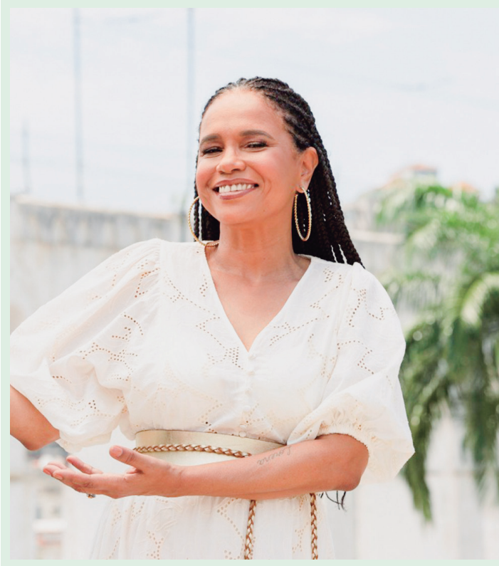
Edição 2023 da Oficina de Música marca a retomada da iniciativa de forma presencial após a pandemia.

A programação está disponível em oficinademusica.curitiba.pr.gov.br , e os ingressos à venda em minhaentrada.com.br e ticketfacil.com.br