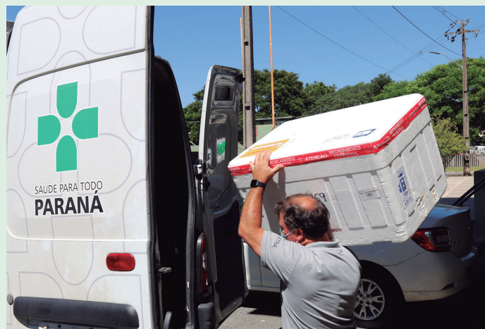
Estado inicia semana com distribuição de mais de 204 mil vacinas contra a Covid-19.

Segundo o Vacinômetro Nacional do Ministério da Saúde, desde o início da vacinação contra a Covid-19 o Paraná registrou mais de 28,5 milhões de doses aplicadas, sendo mais de 10,2 milhões primeiras doses; quase 9,5 milhões; 339,6 mil doses únicas; 6,3 milhões primeiras doses de reforço, quase 1,7 milhão de segundas doses de reforço e 461 mil doses adicionais.