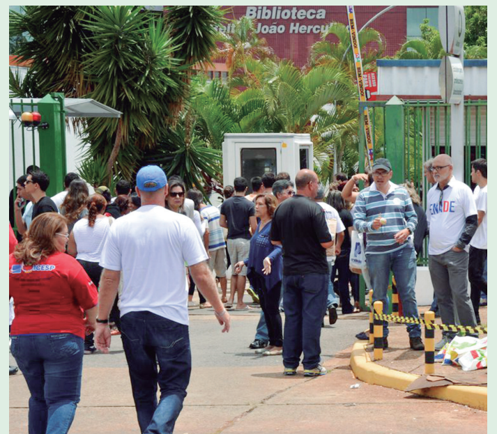
Pessoas com o pedido deferido serão automaticamente regularizadas desde que não tenham pendências no Questionário do Estudante.

No caso das instituições de ensino superior, é também possível aos coordenadores de curso registrar declarações referentes a estudantes que não foram inscritos no período previsto, deixaram de ser informados pela instituição sobre sua inscrição; não tiveram indicação correta do polo de apoio presencial, não tiveram seu município de prova alterado em decorrência de mobilidade acadêmica ou foram inscritos indevidamente.