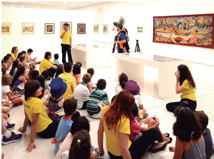
MON promove amplo uso do espaço do museu durante atividades da Colônia de Férias.

A programação é direcionada para crianças entre 7 e 10 anos que devem estar acompanhadas de um adulto responsável. Diariamente, uma das ações sempre será um ateliê aberto que funcionará das 13h30 às 17h (com entrada permitida até 16h30), no Espaço de Oficinas. Nas atividades será possível experimentar algum material ou técnica pelo tempo que cada um