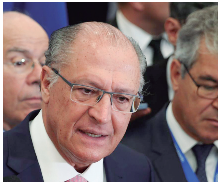
Segundo Alckmin, governo federal trata como prioridade a reforma tributária, bem como o fim do IPI.

“ Temos que aproveitar a legitimidade do processo eleitoral e avançar o máximo ”