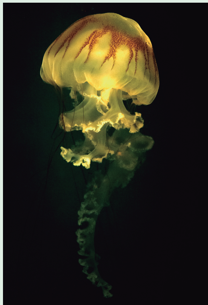
Em contato com a pele humana, as toxinas liberadas podem causar quadros de dor, vermelhidão e inchaço.

Ocorrências podem ser informadas ao Centro de Controle de Envenenamentos do Paraná 0800-410148 (CCE/PR).