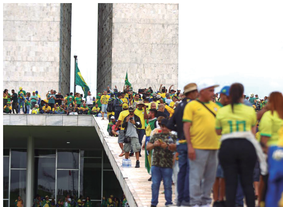
No domingo (8), apoiadores do ex-presidente Jair Bolsonaro vandalizaram a Praça dos Três Poderes, em Brasília.

Almagro disse ainda que, na condição de secretário-geral da OEA, soube imediatamente da invasão aos prédios representativos dos três poderes e que acompanhou de perto o desenrolar dos acontecimentos.