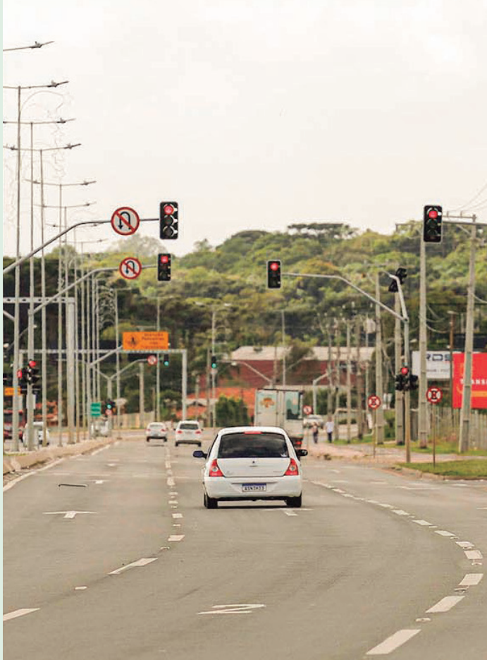
Condições da pista após restauração "convidam" a acelerar mais, e excesso de velocidade tem causado acidentes graves na Rodovia da Uva.