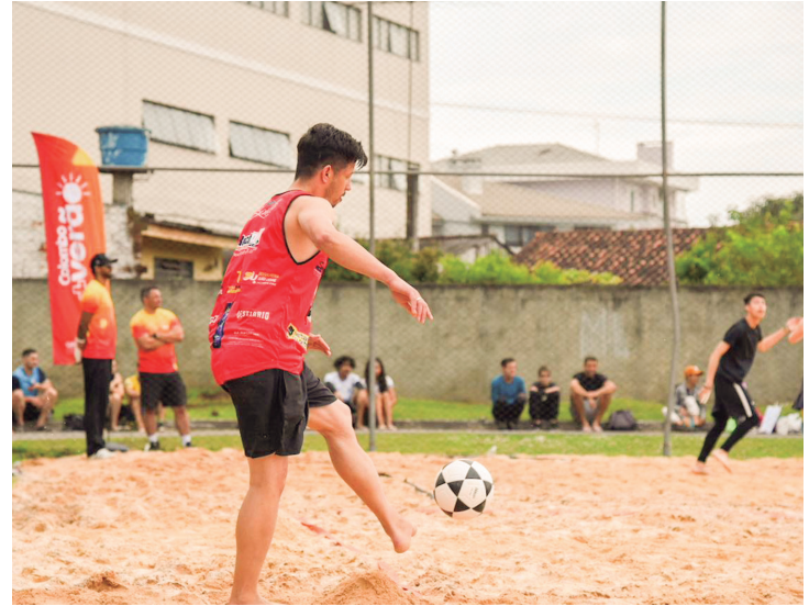
Futevôlei é uma das modalidades que tem atraído praticantes para as praças esportivas públicas.

Depois dos trabalhos, a praça recebeu eventos do programa Colombo Mais Verão, como disputas de Beach Tennis, Vôlei de Praia e Futevôlei. Isso tem motivado que adeptos dessas modalidades frequentem o local com mais frequência, atraindo olhares