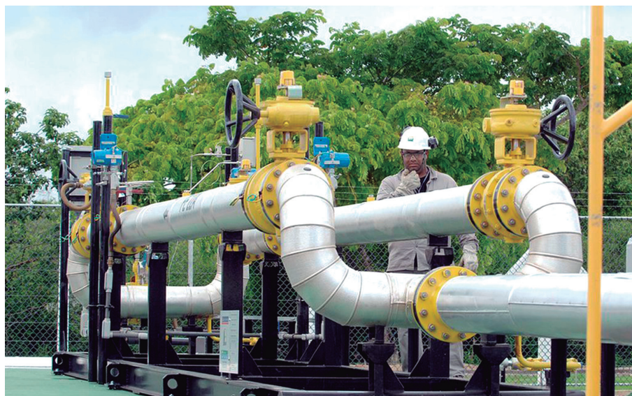
Contratos da Petrobras prevêm atualizações trimestrais e vinculam a variação do preço do gás às oscilações do petróleo Brent e da taxa de câmbio.

As tarifas ao consumidor também dependem de aprovação pelas agências reguladoras estaduais.