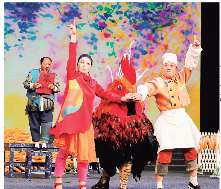
"O Aniversário do Galo"

da Noiva" foi apresentada na Ópera Nacional das Trupes (ou Companhias) de Base e ganhou o primeiro prêmio na categoria de pequenas obras de arte com tema rural, na província de Shandong. O Centro tem enviado a ópera para áreas rurais durante todo o ano, com mais de 800 apresentações gratuitas anualmente. A trupe Liangjiaxian também lançou uma campanha Trazendo a Ópera Liangjiaxian para o campo, que enriquece a cultura da zona rural e promove ainda mais a herança cultural imaterial da China.