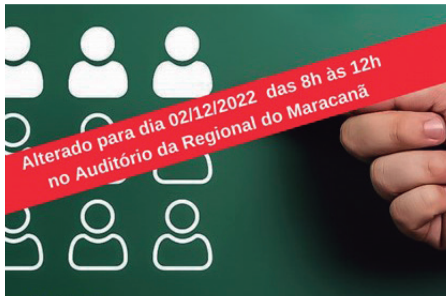
A Secom Colombo informa que o Edital de Convocação do Conselho do FUNDEB foi reagendado para o dia 2 de dezembro de 2022.