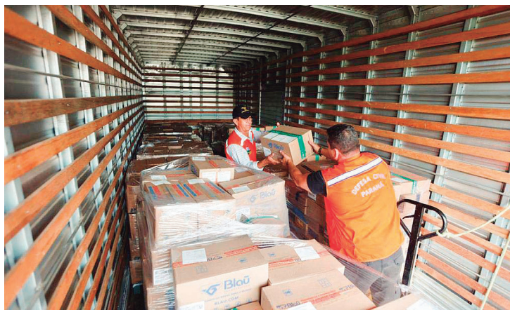
O caminhão com quase 900 volumes vai sair do Centro de Medicamentos do Paraná (Cemepar).

Embora não haja desabastecimento nestas localidades, a medida é preventiva e pretende assegurar um volume adicional de materiais, considerando a situação na região, integrada por sete municípios. Cerca de 100 cilindros de oxigênio também serão transportados pela Defesa Civil até Paranaguá para atender unidades que encontrem eventual limitação.