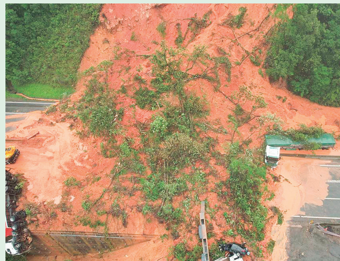
Trabalhos seguem com auxílio de equipes por terra e imagens aéreas.

O corpo da segunda vítima vai passar por perícia no Instituto Médico Legal (IML). Foi aberto um canal direto com os familiares e conhecidos de pessoas que poderiam estar no local do deslizamento, o que pode ajudar na identificação das vítimas.