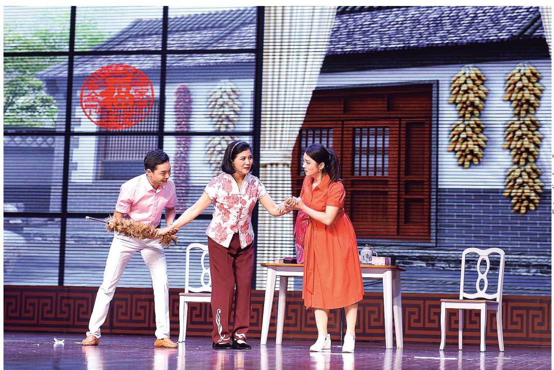
"O Reembolso do Dote da Noiva"