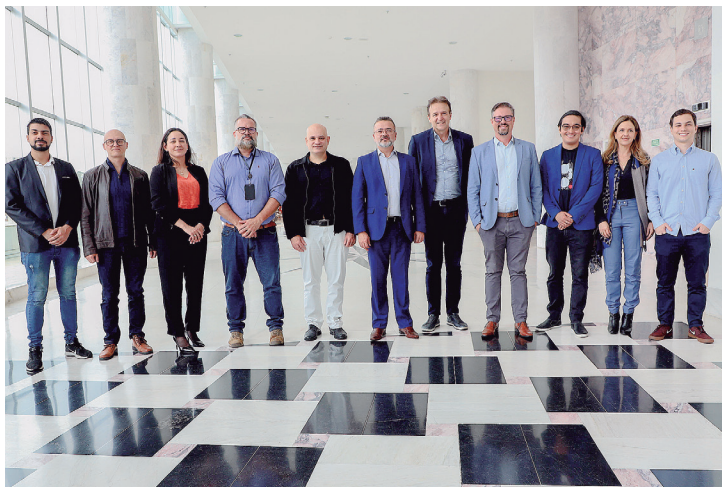
Programa Qualifica Mais – Inova Paraná visa atender a demanda crescente por profissionais qualificados na área.

De acordo com o head de Community & Ecosystem da DIO, Victor Haruo, a empresa já planeja ampliar a ação realizada em conjunto com o