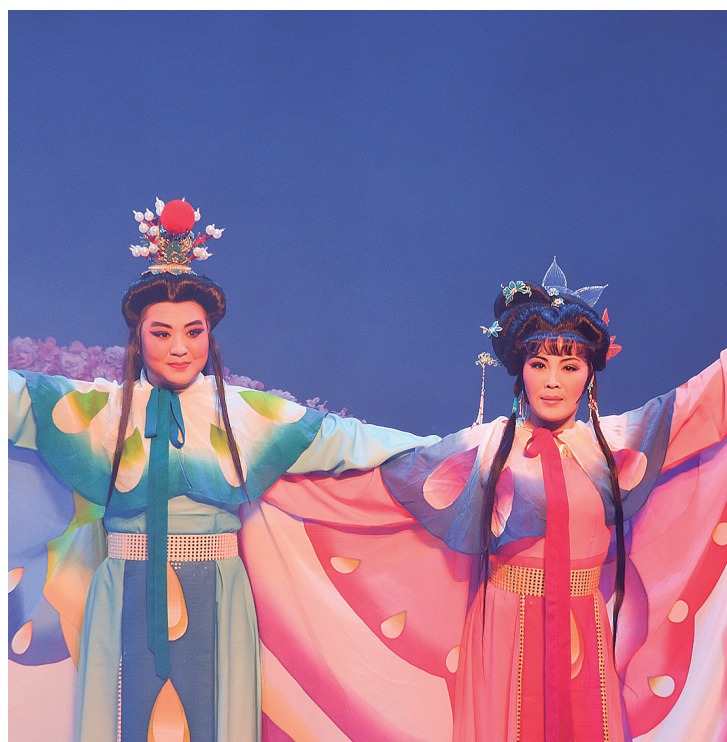
"Os Amantes Borboleta"