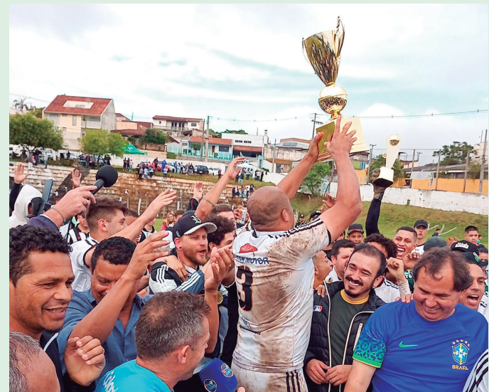
A equipe do XV de Novembro é a grande campeã da temporada 2022 da Liga de Colombo.