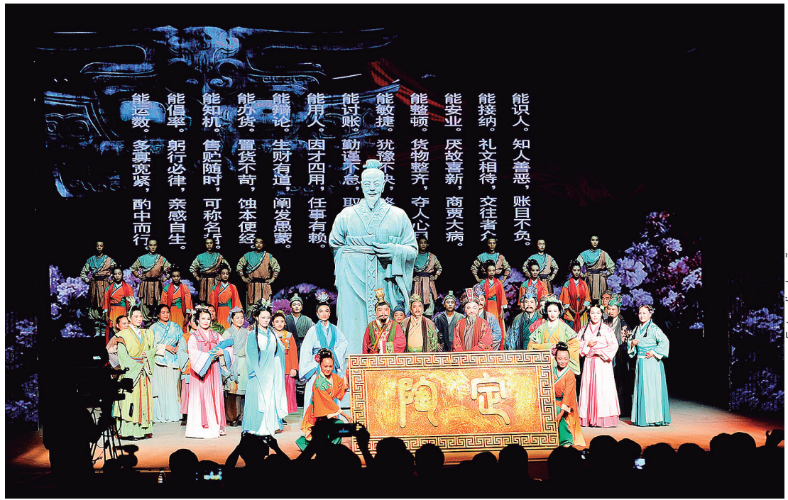
"O Magnata dos Negócios dos Períodos da Primavera e do Outono" (ou O Magnata dos Negócios da Primavera e do Outono"

da Noiva" foi apresentada na Ópera Nacional das Trupes (ou Companhias) de Base e ganhou o primeiro prêmio na categoria de pequenas obras de arte com tema rural, na província de Shandong. O Centro tem enviado a ópera para áreas rurais durante todo o ano, com mais de 800 apresentações gratuitas anualmente. A trupe Liangjiaxian também lançou uma campanha Trazendo a Ópera Liangjiaxian para o campo, que enriquece a cultura da zona rural e promove ainda mais a herança cultural imaterial da China.