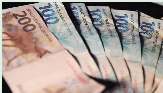
Liberação do lote residual do IRPF representa valor de R$ 1,2 bilhão, beneficiando mais de 500 mil contribuintes.

Caso o contribuinte não resgate o valor de sua restituição no prazo previsto, deverá requerê-lo pelo Portal e-CAC, disponível no site da Receita Federal.