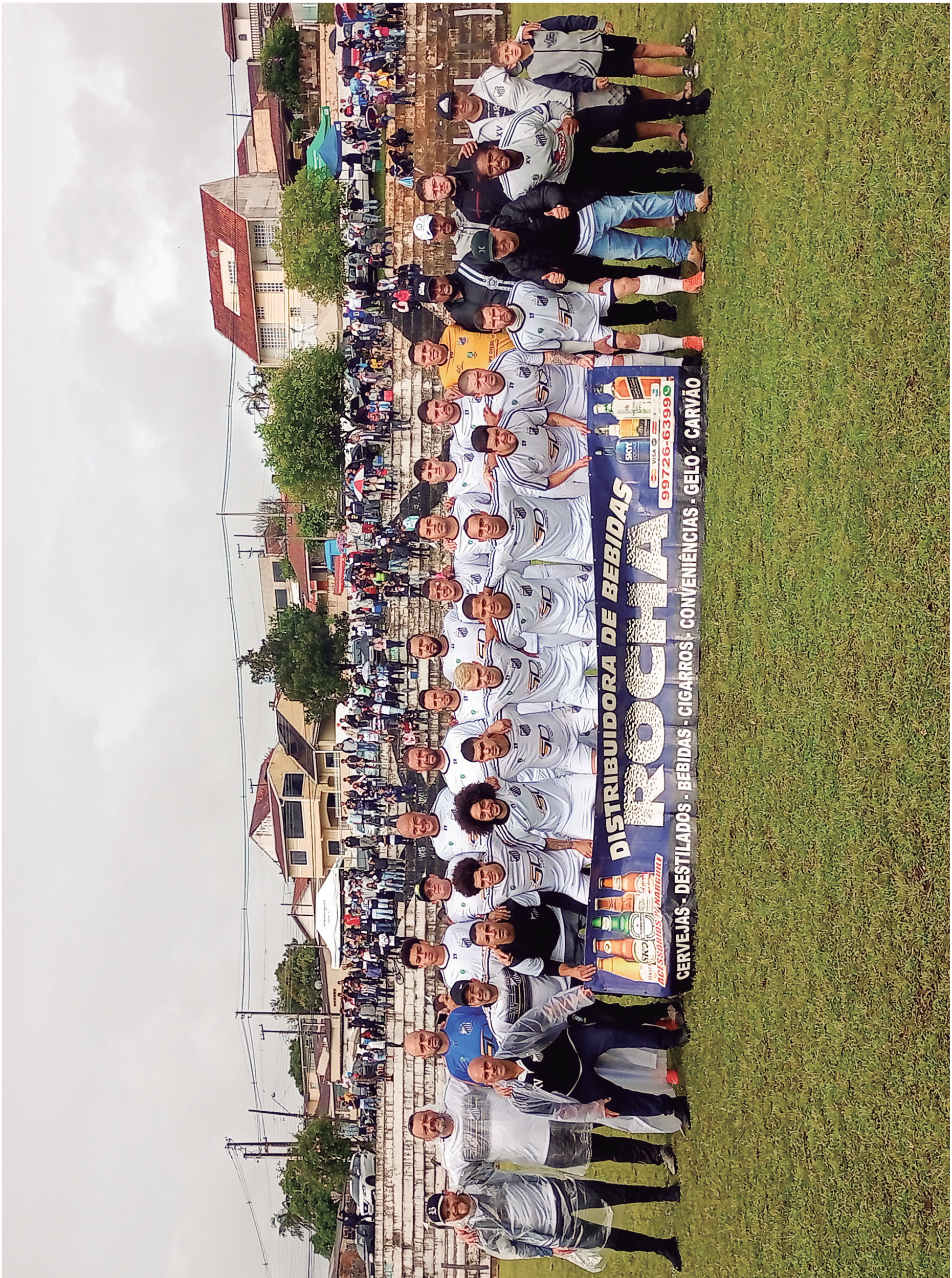
Lucas Lopes/Jornal de Colombo