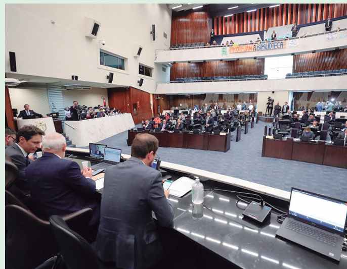
Nova agência irá substituir a atual Coordenação da Região Metropolitana de Curitiba (COMECC)

De acordo com a matéria, o órgão será interfederativo e vinculado à Secretaria de Estado do Desenvolvimento Urbano do Paraná (Sedu), com a finalidade de assessorar o Governo do Estado e os municípios da Região Metropolitana de Curitiba na formulação de políticas públicas e na implementação de programas voltados ao desenvolvimento do transporte coletivo na região. Segundo a matéria, o conselho será formado por um representante da Sedu; um da Secretaria de Estado de Infraestrutura e Logística; um membro da Secretaria de Estado da Fazenda; um representante da Agência de Assuntos Metropolitanos; um representante de cada município da Região Metropolitana de Curitiba, participante da Rede Integrada Metropolitana de Transporte; e membros da sociedade civil organizada.