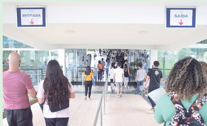
MEC ainda não divulgou o quantitativo de vagas disponíveis em cada processo seletivo.

Já o Fies estará com inscrições abertas entre 14 e 17 de março. Trata-se de um fundo voltado para o financiamento integral ou parcial das mensalidades do curso de escolha do beneficiado. Dessa forma, o aluno pode arcar com custos de forma reduzida ou apenas após completar sua formação. Podem participar do processo seletivo os estudantes que realizaram alguma edição do Enem realizada desde 2010. O resultado da chamada única será conhecido em 21 de março.