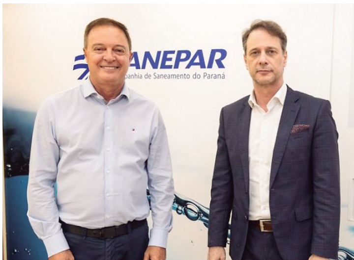
Obras preveem a ampliação do sistema de abastecimento de água do município de Colombo.

A juíza federal Vera Lucia Feil, da 6ª Vara Federal de Curitiba, decidiu que "há probabilidade no direito invocado, porquanto a pretensão encontra respaldo em remansosa jurisprudência do Tribunal Regional Fede-