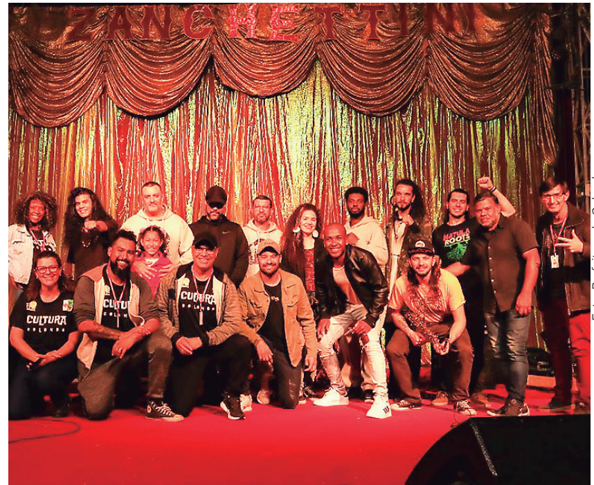
Evento reuniu diversos artistas colombenses ao longo de três noites de apresentações.