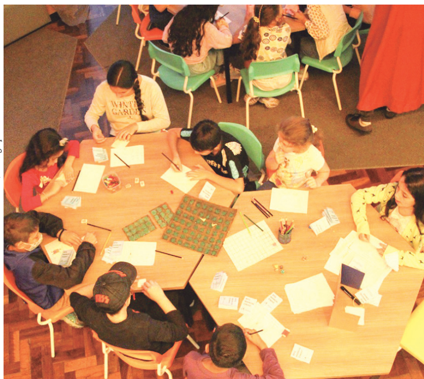
Inscrições na Seção Infantil da BPP de segunda a sexta, das 8h30 às 18h30.

A Biblioteca Pública do Paraná promove no dia 26 de novembro a 17ª edição do projeto Uma Noite na Biblioteca — acantonamento para crianças de 7 a 10 anos. A programação começa no fim da tarde de sábado e termina na manhã de domingo, com um café de confraternização para as famílias dos participantes e funcionários da BPP. As atividades incluem apresentações teatrais, contação de histórias e jogos. As inscrições são gratuitas e devem ser feitas diretamente na Seção Infantil, de segunda a sexta, das 8h30 às 18h30. As vagas são limitadas. Informações também podem ser solicitadas pelo telefone (41) 3221-4980. Durante a maratona cultural, que neste ano trata do tema "Meu lugar no mundo", as crianças são convidadas a criar laços afetivos e percorrer diferentes espaços da Biblioteca por meio de cenas teatrais, mediações literárias e proposições artísticas.