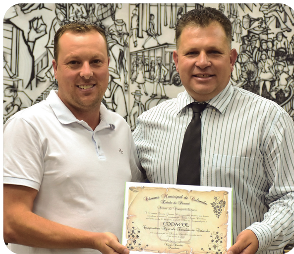
Votos de Congratulações à Cooperativa Agrícola Familiar de Colombo, COOACOL, pela realização da 10ª Festa do Agricultor, ocorrida no dia 21 de agosto de 2022.