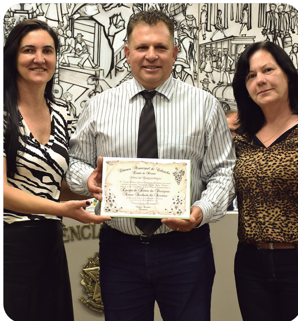
Votos de Congratulações à Equipe de festas da Paróquia Nossa Senhora do Rosário pela realização da festa em homenagem à Padroeira no dia 09 de outubro de 2022.