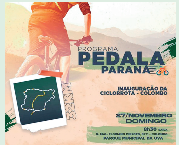
Ciclorota de Colombo é a primeira do município dentro do Programa Pedala Mais Paraná

O percurso também contará com três pontos de apoio, com ferramentas e bomba de ar, para que os participantes possam utilizar em caso de necessidade. A inscrição é gratuita e já está disponível no site da Prefeitura de Colombo.