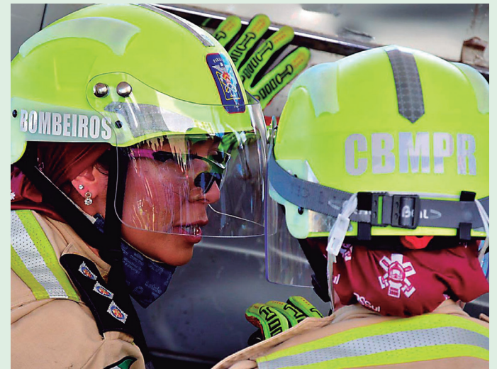
A iniciativa visa a melhoria na execução do orçamento para a compra de equipamentos e a preparação oficial