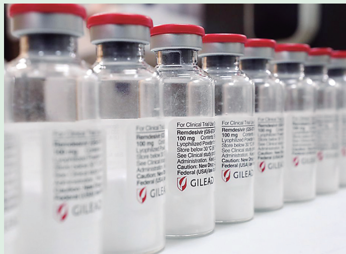
Remdesivir é um antiviral injetável de uso hospitalar

A substância age impedindo a replicação do coronavírus no organismo, diminuindo o processo de infecção. Cerca de 50 países já autorizam o uso do medicamento.