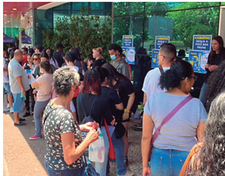
O Exame Nacional do Ensino Médio (Enem), após 2 anos de pandemia, volta a patamares de ausências considerados dentro da normalidade histórica

“ Mais da metade dos estudantes inscritos no Enem Digital não compareceram ao exame ”