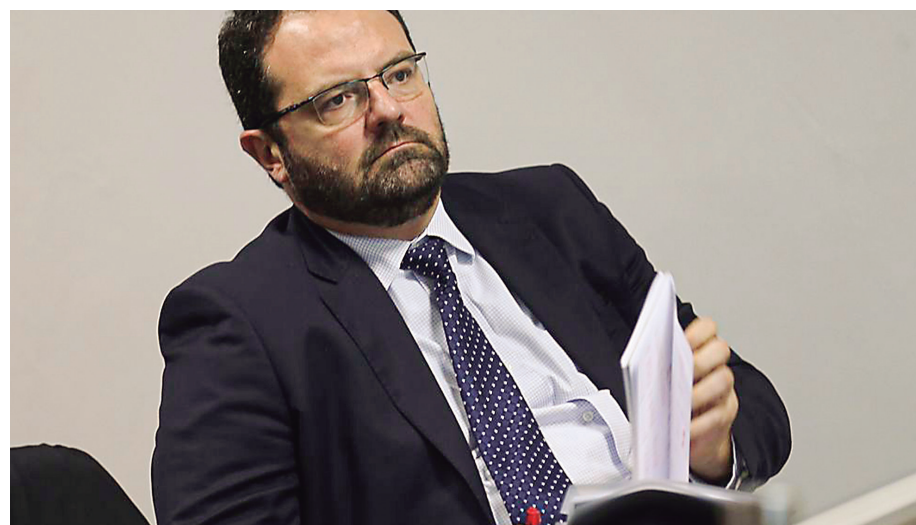
Equipe de transição afirma que aprovação da PEC é essencial para assegurar investimentos em 2023

Na semana passada, a equipe de transição apresentou proposta de