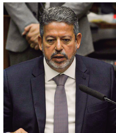
Na opinião de Lira, o Brasil deveria começar a avaliar a adoção de um regime semiparlamentarista

Lira defendeu ainda que, nos próximos anos, o Congresso não só mantenha esse poder de decisão sobre o Orçamento como também que amplie a atuação sobre as políticas públicas. "É errado retroceder. Nós avançamos um pouco nas prerrogativas que, ao