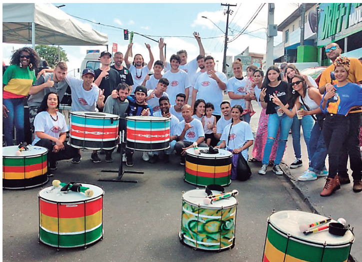
Apresentações culturais marcaram a feira, que contou com boa presença de público ao longo do dia