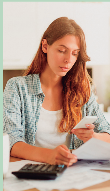
Alternativa para sair de juros altos pode ser trocar uma dívida por outra mais em conta.

Para quem procura juros mais baixos, o consignado pode ser uma opção. Quando se tem mais de duas dívidas, por exemplo, uma alternativa é pegar um empréstimo para pagar todas as demais e ficar apenas com uma maior, porém com juros mais baixos. “Essa modalidade de empréstimo oferece taxas mais atrativas e prazos maiores, além disso, as parcelas são descontadas diretamente na folha de pagamento, já que é voltada para servidores públicos, aposentados e pensionistas”, explica o CEO. Empréstimo com garantia Essa modalidade de crédito utiliza o carro ou o imóvel como garantia de pagamento. “As parcelas costumam ter juros mais baixos, muito inferiores ao rotativo do cartão, além disso, o parcelamento é mais longo. Costumo indicar para quem tem dívidas altas e para longo prazo”, finaliza Robson.