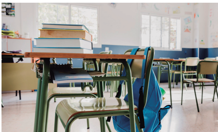
Lei determina aviso injustificados para evitar evasão escolar.