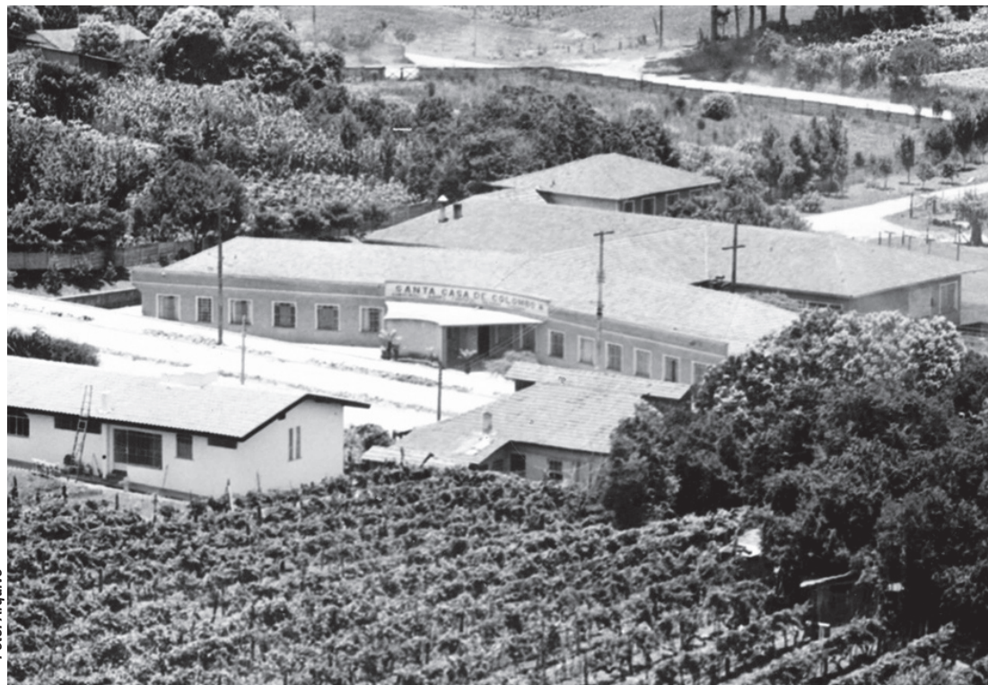
Hospital Santa Casa no início da sua história em Colombo