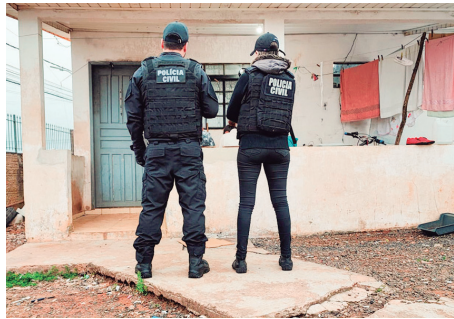
Ainda foram cumpridos quatro mandados de busca e apreensão, em que foram apreendidos celulares e porções de maconha.