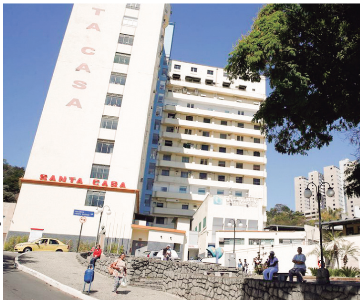
Programa foi aprovado por 383 votos favoráveis e 3 votos contrários.

A Câmara dos Deputados aprovou, por 383 votos favoráveis e 3 votos contrários, na última terça-feira o projeto de lei que destina R$ 2 bilhões para o custeio de serviços prestados por Santas Casas. As entidades privadas sem fins lucrativos complementam o atendimento do Sistema Único de Saúde (SUS). De acordo com o texto, os recursos serão originados de saldos de repasses da União constantes dos fundos de saúde e de assistência social de estados, Distrito Federal e municípios, que poderão ser utilizados até o final de 2023. Caso os saldos sejam insuficientes para o paga-