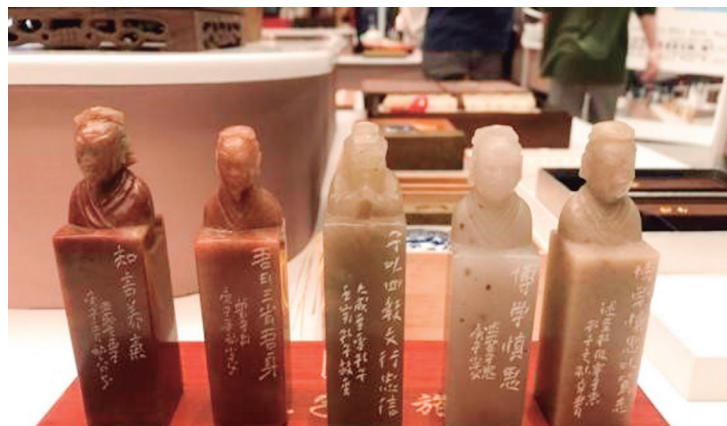
A série de carimbos dos "Cinco Santos e dos Carimbos Chineses"

de interação através da qual os convidados puderam apreciar a boa cultura tradicional chinesa e sentir o charme da "hospitalidade e dos sabores de Shandong". Assim, mais de 30 exposições e atividades culturais foram lançadas. Entre elas: uma exposição de trabalhos de caligrafia, entalhes de carimbos realizados por artistas chineses famosos, uma apresentação do tradicional teatro de sombras com o tema "Confúcio e os pensadores do mundo", um tour imersivo no espaço de demonstração da "criatividade e da originalidade" cultural e uma experiência de Medicina Tradicional Chinesa (MTC) no local.