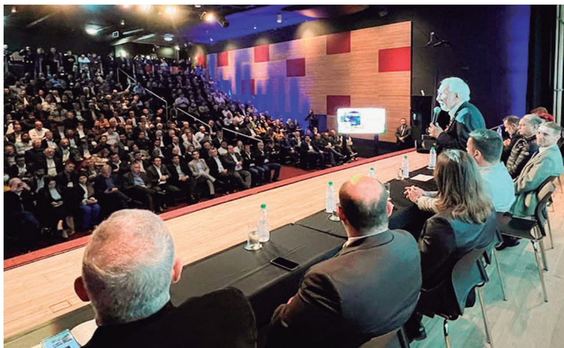
Governador em exercício destacou a importância da atuação conjunta entre o órgão e municípios de todo o Estado e a disponibilidade para sanar dúvidas dos participantes.

"A nossa instituição trabalha desde o pequeno até o maior município sem distinção, por isso estamos buscando diálogo com outros órgãos que nos ajudam nessa administração. São 399 municípios com realidades diferentes, regiões que merecem cuidado diferenciado. Essa sensibilidade com as particularidades nos deixa mais tranquilos", ressaltou.