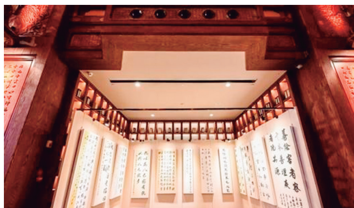
O poder da tinta de Shandong