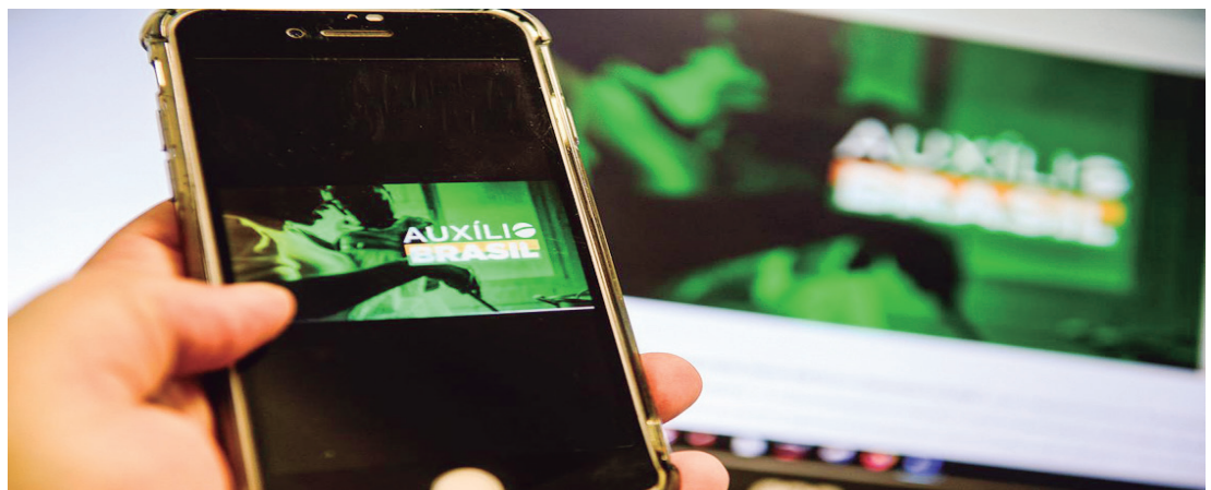
Medida é para família que não renova informações há mais de 2 anos.

Os beneficiários do Auxílio Brasil que não atualizam seus registros no Cadastro Único (CadÚnico) há mais de 2 anos têm até esta sexta-feira para retificar as informações, sob risco de perder o benefício caso não o façam. A data limite para os beneficiários prestarem as informações foi estabelecida em julho, por meio de Instrução Normativa Conjunta que alterou o cronograma de averiguação e revisão dos dados das famílias inscritas no CadÚnico, estendendo por mais 3 meses o prazo de revisão