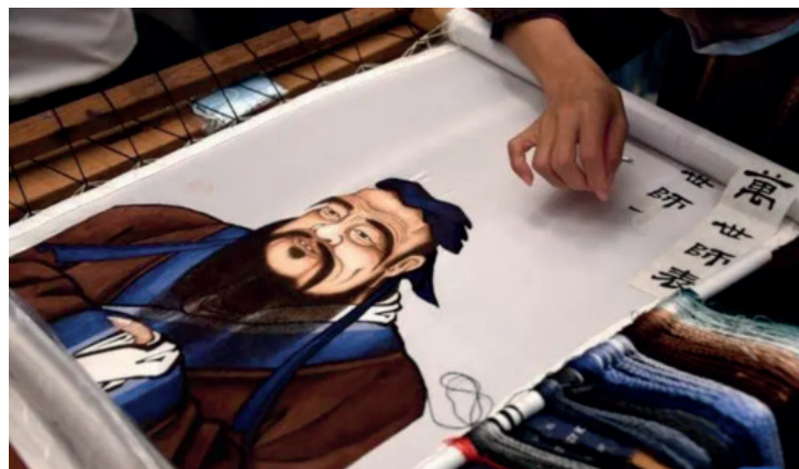
O Bordado de Shandong, com o retrato de Confúcio