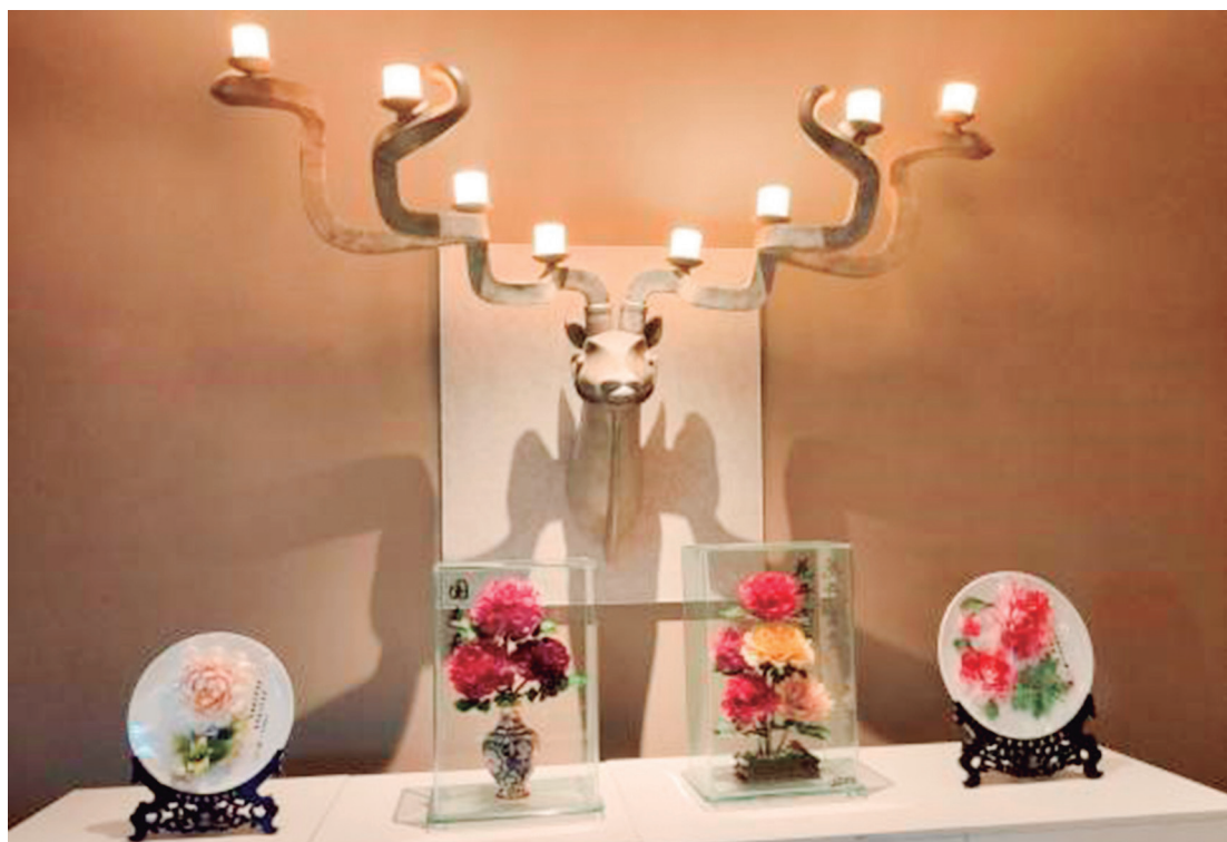
O salão de exposições especial de Heze, a capital das peônias na China

O fórum deste ano contou com uma experiência