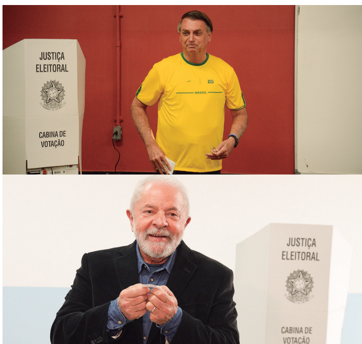
Neste ano, participarão do segundo turno das eleições gerais os candidatos a presidente da República, Jair Bolsonaro e Luiz Inácio Lula da Silva, além de 24 candidatos que disputam os governos de 12 estados.

A norma e as exceções constam do Artigo 236 do Código Eleitoral (Lei 4.737/1965). A lógica do dispositivo, herdado de normas eleitorais mais antigas, é impedir que alguma autoridade utilize o seu poder de prisão para interferir no resultado das eleições. No caso de prisão de algum candidato, a partir do próximo sábado, a previsão é que o detido seja levado à presença de um juiz para que seja verificada a legalidade