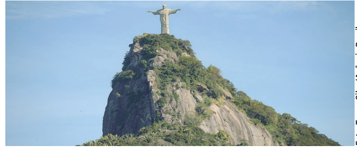
Data foi celebrada com Missão em Ação de Graças

O Santuário do Cristo Redentor está completou ontem 91 anos de inauguração. Para marcar a data, foi celebrada a missa em Ação de Graças presidida pelo arcebispo do Rio, cardeal Orani João Tempesta. Em seguida, foi distribuído o tradicional bolo comemorativo, preparado pela tradicional organização Sociedade Amigos da Rua da Carioca e Adjacências (Sarca). Dando sequência à programação, no próximo domingo, dia 16, às 19h30, o Santuário terá uma cerimônia pelo Dia Mundial da Alimentação, com o objetivo de alertar para a importância do acesso à alimentação adequada e saudável, que é um direito de todo ser humano. Ao final, o monumento ao Cristo Redentor terá uma iluminação especial na