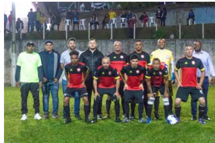
O time da Câmara Municipal acabou ficando com a vice colocação no campeonato.