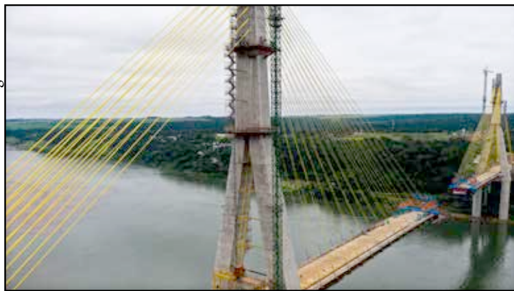
A obra começou em 2019, em uma parceria entre a Itaipu Binacional, comandada por Brasil e Paraguai, e o governo do estado do Paraná.

No lado paraguaio, a ponte chegará ao município de Presidente Franco. Ela terá 760 metros de comprimento e um vão livre de 470 metros, o maior da América Latina. Serão duas pistas simples com 3,6