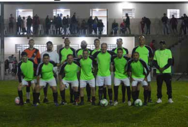
A equipe da Educação conquistou o ouro da competição.