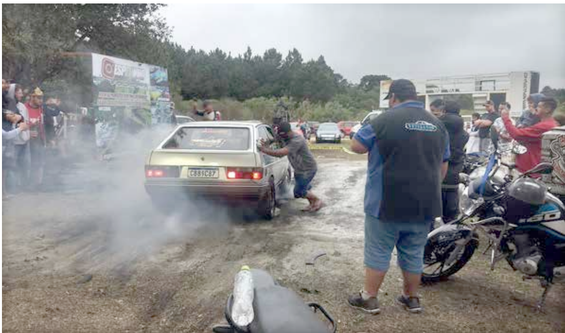
O evento contou com fritão de carro também.