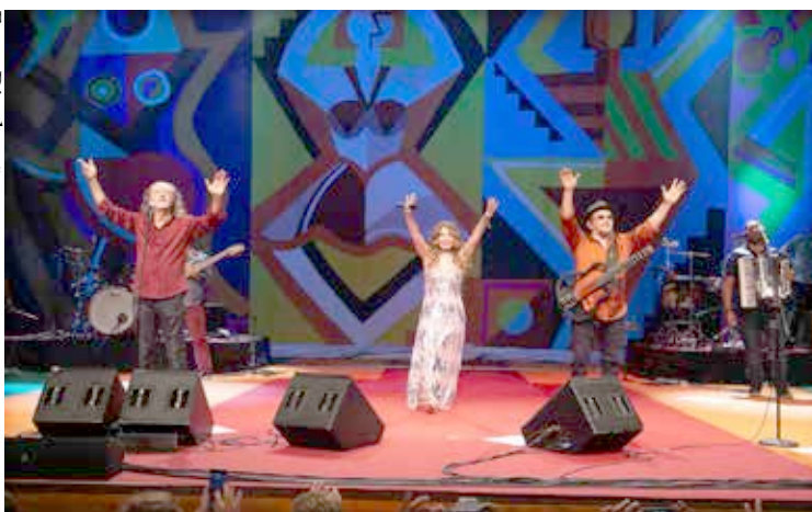
Eles vão comemorar com o público os mais de 20 anos desse projeto, que é um dos mais bem-sucedidos da música brasileira.

e Alceu dobram vozes em "Flor de Tangerina", tema da novela "Velho Chico".