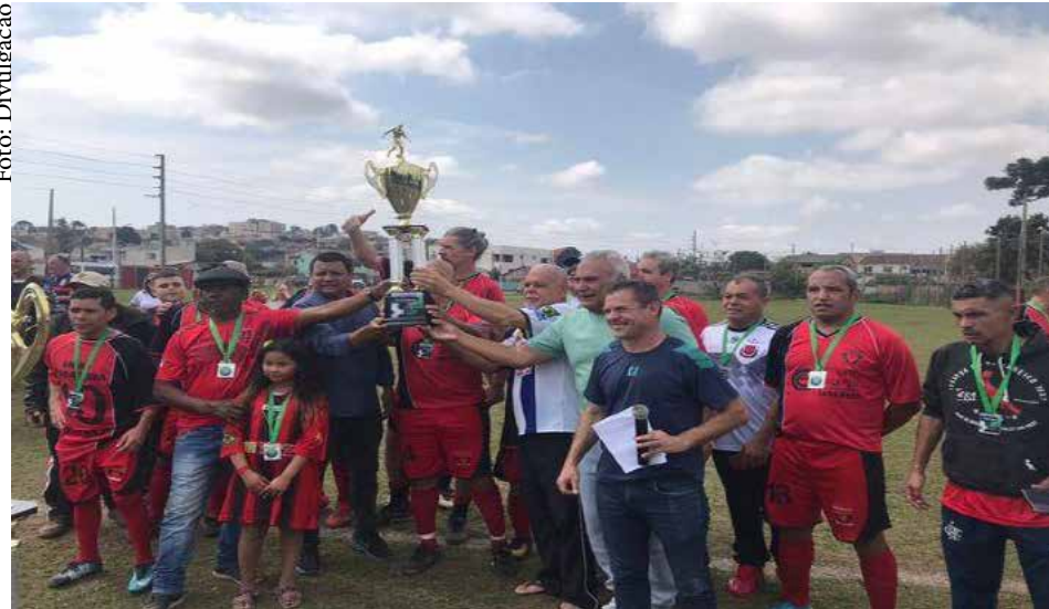
O vice Campeão, União Guaraituba, fez uma bela campanha na competição.