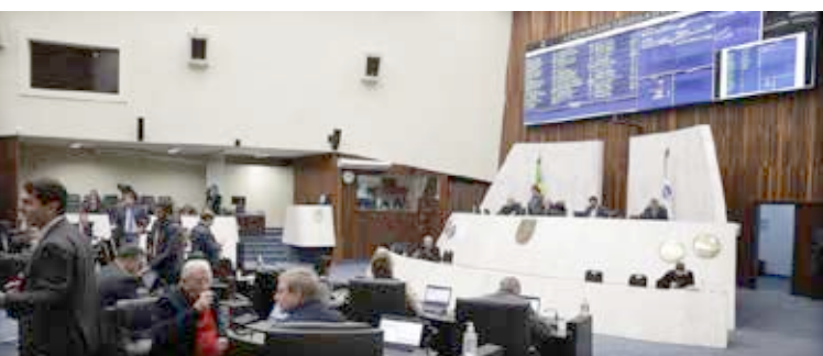
Reunião extraordinária da CCJ foi realizada na última segunda-feira.

A Comissão de Constituição e Justiça (CCJ) da Assembleia Legislativa do Paraná aprovou na última segunda-feira, em reunião extraordinária, o projeto de lei 403/2022, do Poder Executivo, que autoriza o Estado a conceder crédito presumido do ICMS aos produtores ou distribuidores paranaenses de etanol hidratado combustível. Com a medida, fica autorizada a concessão, até 31 de dezembro de 2022, de créditos no valor de quase R$ 229 milhões. O montante será compensado pela União na forma de auxílio financeiro ao Paraná. De acordo com o Governo, a proposta visa reequilibrar a competitividade no setor de combustíveis. A medida tramita em regime de urgência.