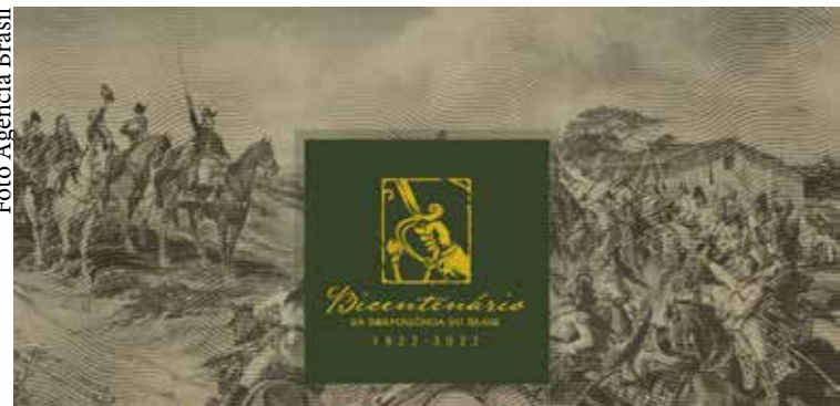
Pintura foi feita 66 anos após o momento emblemático.

Independência ou Morte, também conhecido como O Grito do Ipiranga, é o quadro que retrata o momento único da ruptura entre Brasil e Portugal. Mas a pintura de Pedro Américo foi feita anos depois da Independência e com muita dose de imaginação para recriar a história brasileira.