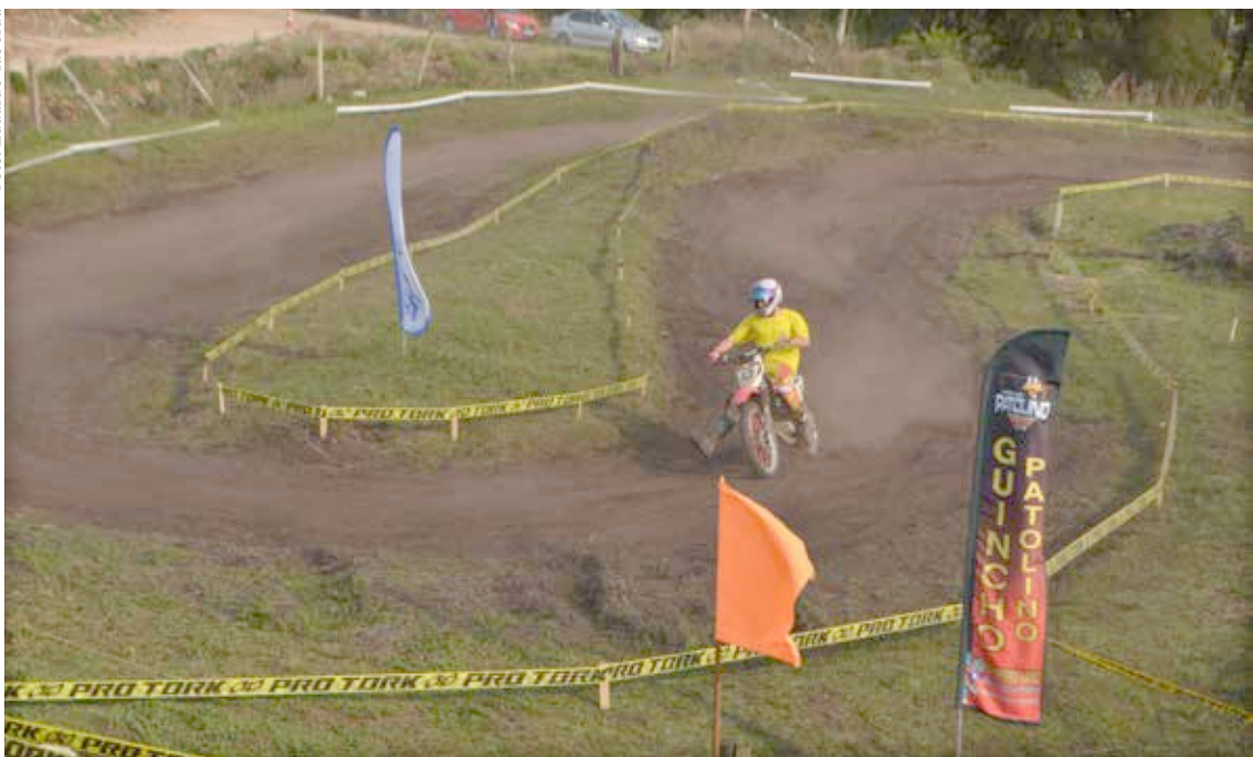
Durante o evento, uma das “competições” foi quem fez a melhor curva.