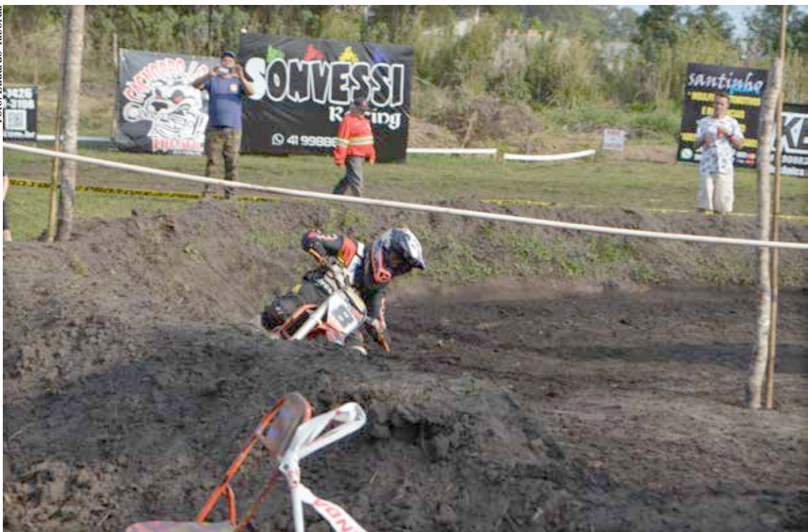
Evento foi realizado na Pista do Marisco, em Colombo.