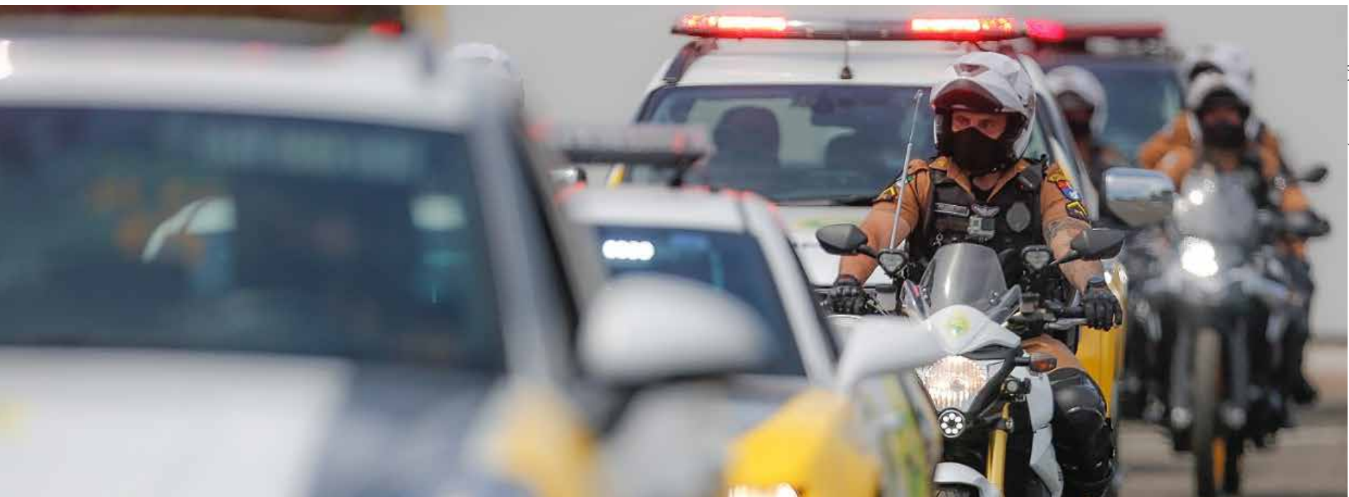
Ratinho Junior

Desde 2019 também foram investidos mais de R$ 454 milhões para a aquisição de equipamentos, armamentos e de 2,8 mil viaturas para as forças de segurança. Página 05