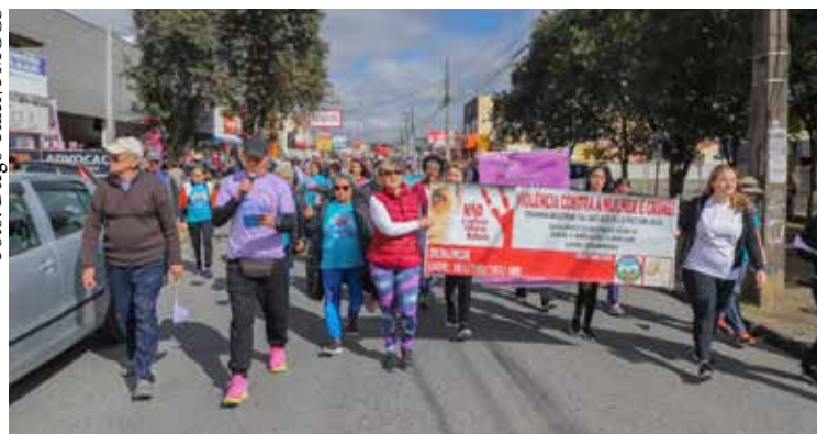
A ação de Campina Grande do Sul teve o objetivo de chamar a atenção da sociedade e incentivar mulheres a reagirem contra aos agressores.

Na última semana aconteceu a caminhada em conscientização pelo fim da violência contra a mulher com o tema "Justiça pela Paz em Casa", organizada pela Secretaria Municipal de Ação Social, Família e Cultura, em parceria com o Conselho da Comunidade de Campina Grande do Sul e Quatro Barras, e com o Poder Judiciário.