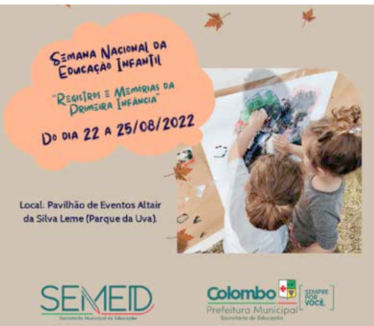
Local: Pavilhão de Eventos Altair da Silva Leme (Parque da Uva).

Seu objetivo principal é promover a conscientização da sociedade a respeito do direito fundamental das crianças.