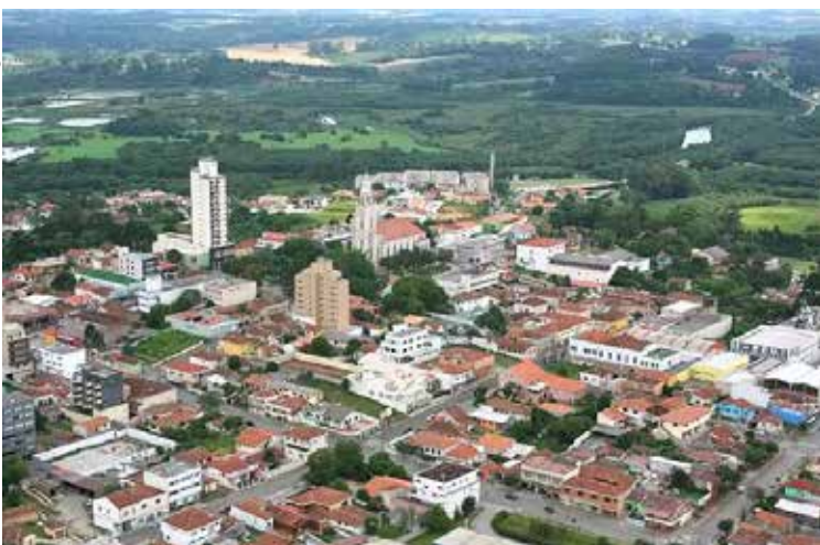
Os postos serão dirigidos a atender especialmente crianças e adolescentes e devem estar funcionando até 1º de dezembro de 2024.

adulto do município (abrangendo atendimento psicológico, inclusive individual).