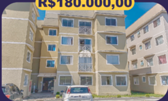
REF 943008 - Colombo - São Gabriel - 86m 2 Apartamento - 3 dormitórios - 2 vagas