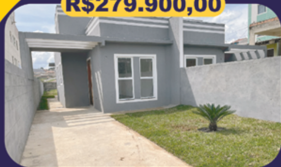
REF 939033 - Colombo - Jardim Osasco Casa - 3 dormitórios / 1 suíte - 58,98m 2