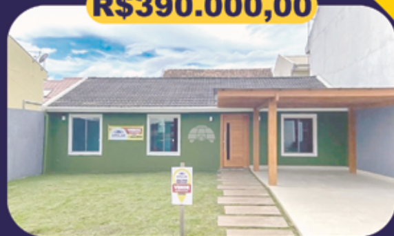
REF 943018 - Colombo - Santa Terezinha Casa - 3 dormitórios - 70m 2