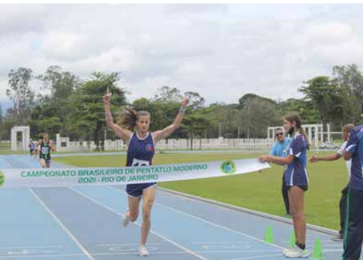
No dia de abertura das inscrições, a Superintendência Geral de Esportes fará uma live para esclarecer as dúvidas sobre o programa

As inscrições para os programas Geração Olímpica e Paralímpica 2022 serão abertas no dia 11 de abril, a partir do meio-dia, após uma live para esclarecer dúvidas. O prazo de inscrição seguirá até dia 21, às 23h59.