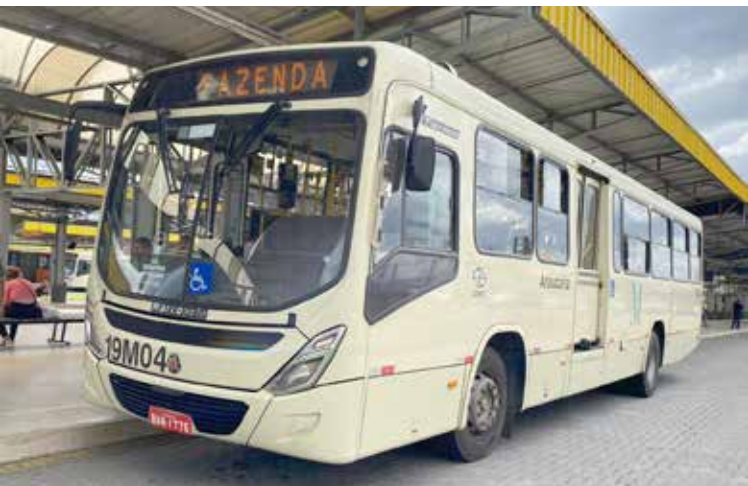
Nova linha atende uma demanda antiga dos usuários e busca desafogar o ônibus que liga Fazenda Rio Grande – Direto

Atendendo uma demanda antiga dos moradores de Fazenda Rio Grande e Araucária, na Região Metropolitana de Curitiba (RMC), a partir da próxima segunda-feira (11) a linha L11