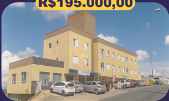
REF 153422 - Colombo - Jardim Monza Apartamento - 2 dormitórios - 48,37m 2