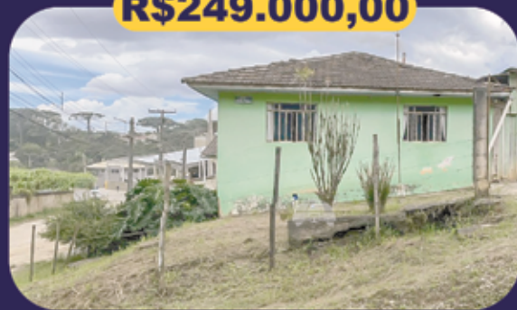
REF 936122 - Colombo - Centro Terreno - 382,50m 2