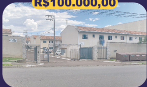
REF 943005 - Colombo - Jardim Fátima Apartamento - 2 dormitórios - 40m 2