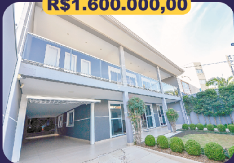
REF 201125 - São Jose dos Pinhais - Cidade Jardim Sobrado - 4 dormitórios / 1 suíte - 600m 2 Garagem para 4 veículos Sala de Jogos com teto Retrátil