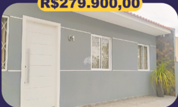
REF 945833 - Colombo - Jardim Monza Casa - 3 dormitórios - 50m 2