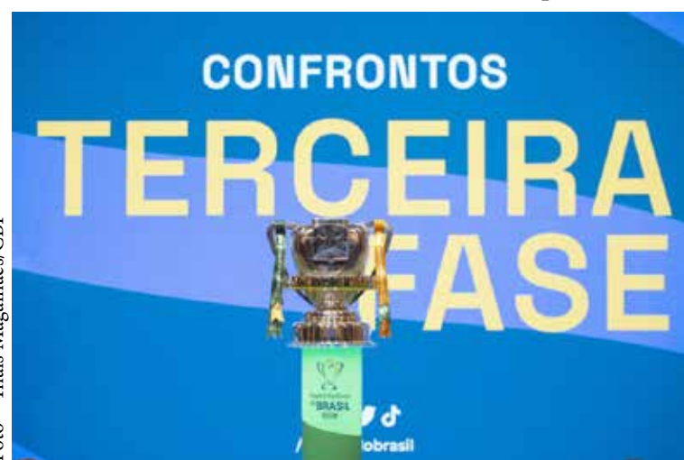
Athletico, Azuriz e Coritiba são os representantes do estado na competição nacional