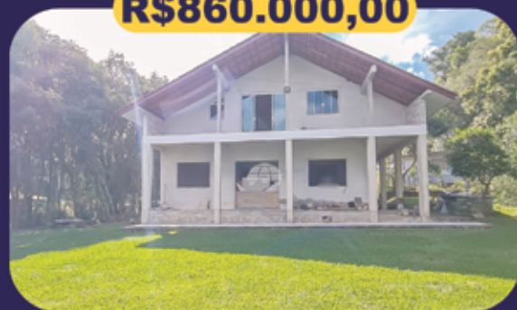
REF 943013 - Colombo - Colônia Faria Chácara - 9255m 2