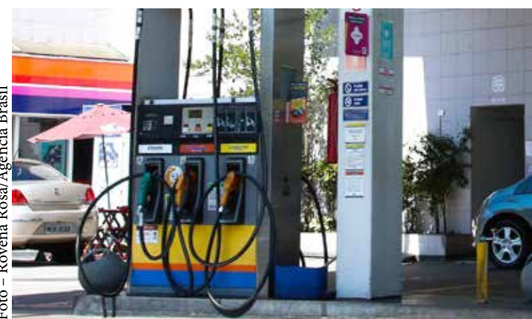
Aumento foi impulsionado pela alta no preço dos combustíveis