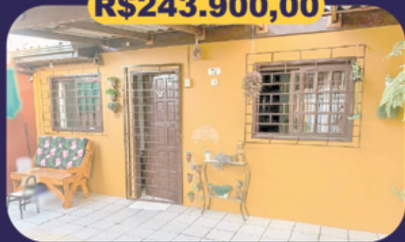
REF 943011 - Colombo - Alto da Cruz II Casa - 2 dormitórios - 48m 2