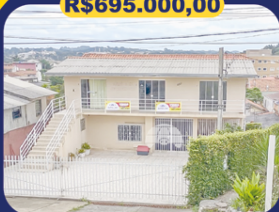
REF 936099 - Colombo - Roça Grande - Sobrado - 3 dormitórios - 130m 2