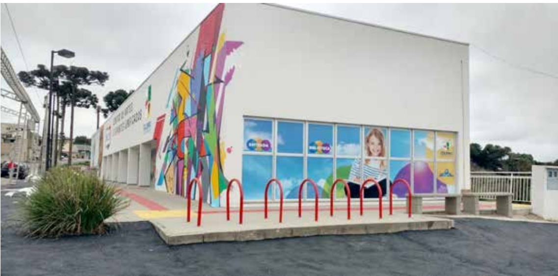
Os interessados poderão se inscrever nas duas modalidades oferecidas

O Centro de Artes e Esportes Unificados, em Colombo, por meio de uma parceria com a Academia de Luta Brazilian Dream e o Grupo Sonho e Liberdade, está oferecendo aulas de Muay Thai e Capoeira para a comunidade do município.