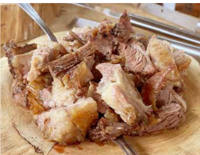
Costela e outros assados são servidos aos domingos no Dona Cirema

conta com um portfólio de mais de 30 especialidades médicas e oferecem mais de 1.200 tipos de exames, serviços odontológicos, centro de vacinação, psicologia, nutrição, fisioterapia, fonoaudiologia e tratamentos.