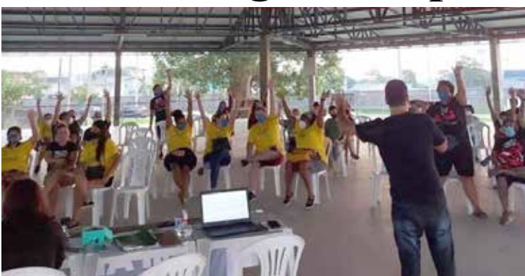
Além da paralisação, haverá protestos em frente à prefeitura da cidade

Os servidores da prefeitura de Araucária, na Região Metropolitana de Curitiba (RMC), anunciaram na última quarta-feira que entrarão em greve a partir do próximo dia 7. Os manifestantes pedem reajustes de acordo com a correção