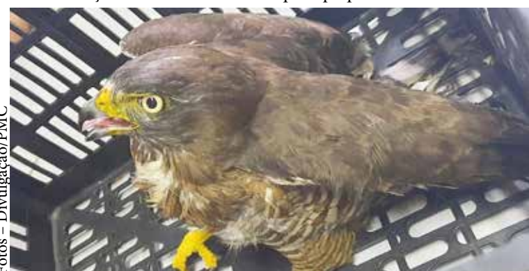
Animal foi encontrado na região do Atuba com uma das asas quebrada

O Instituto Água e Terra (IAT) foi acionado e na sequência a ave foi encaminhada para o Hospital da Universidade Federal do Paraná, onde será atendido e recuperado para que possa retornar à natureza.