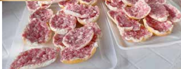
Frango aberto na grelha e "choripan boliviano" são opções exclusivas de assados nos finais de semana