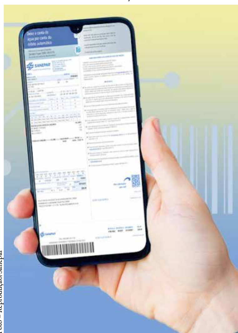
Inovação faz parte da política de sustentabilidade da empresa e busca facilitar a vida dos cidadãos

A inovação faz parte da política de sustentabilidade da Companhia, que possui o programa Sanepar Sem Papel já incluído em vários processos da empresa, com o propósito de reduzir o gasto de papel em prol da preservação do meio ambiente.