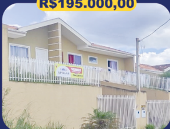
REF 936092 - Bocaiúva Do Sul Centro - Casa - 3 dormitórios - 67.44m 2