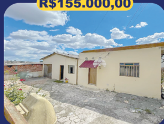
REF 942953 - Colombo - São Dimas Terreno - 480m 2