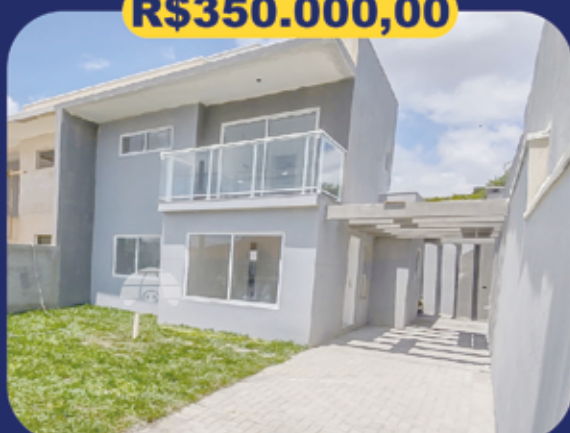
REF 931184 - Colombo - Planta Santa Tereza - Sobrado - 3 dormitórios - 80.36m 2