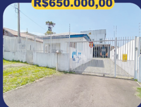
REF 939085 - Colombo - Guarani Casa e Barracão comercial - 353.54m 2