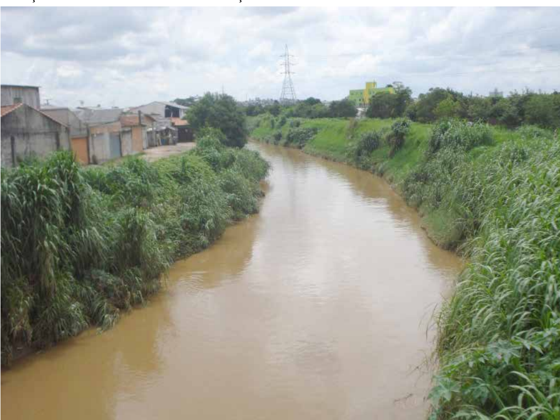
Dentre outras medidas, Pinhais terá que apresentar e executar o plano de recuperação ambiental do local

nagem das águas pluviais irregularmente despejadas em Curitiba, com a instalação, no prazo de um ano, de sistema substitutivo à atual estrutura. Além disso, a decisão judicial determina que o Município de Pinhais deixe de lançar qualquer substância indevida na localidade e apresente e execute Plano de Recuperação Ambiental, aprovado pelo Instituto Ambiental do Paraná, com o objetivo de minorar as consequências dos danos causados.