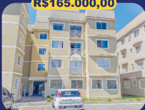
REF 942956 - Colombo - São Gabriel Apartamento - 3 dormitórios - 62.44m 2