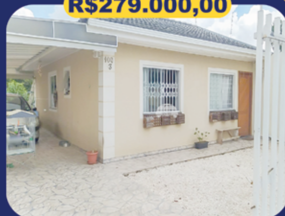
REF 942958 - Colombo - São Gabriel Casa - 3 dormitórios - 50.92m 2