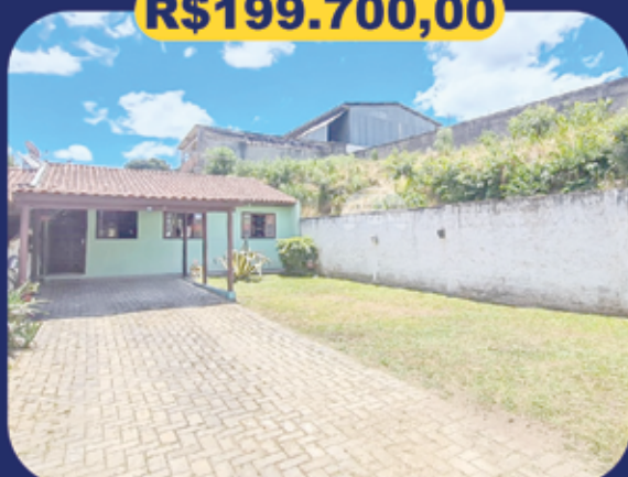
REF 942944 - Colombo - Jardim Das Graças - Casa - 3 dormitórios - 72m 2