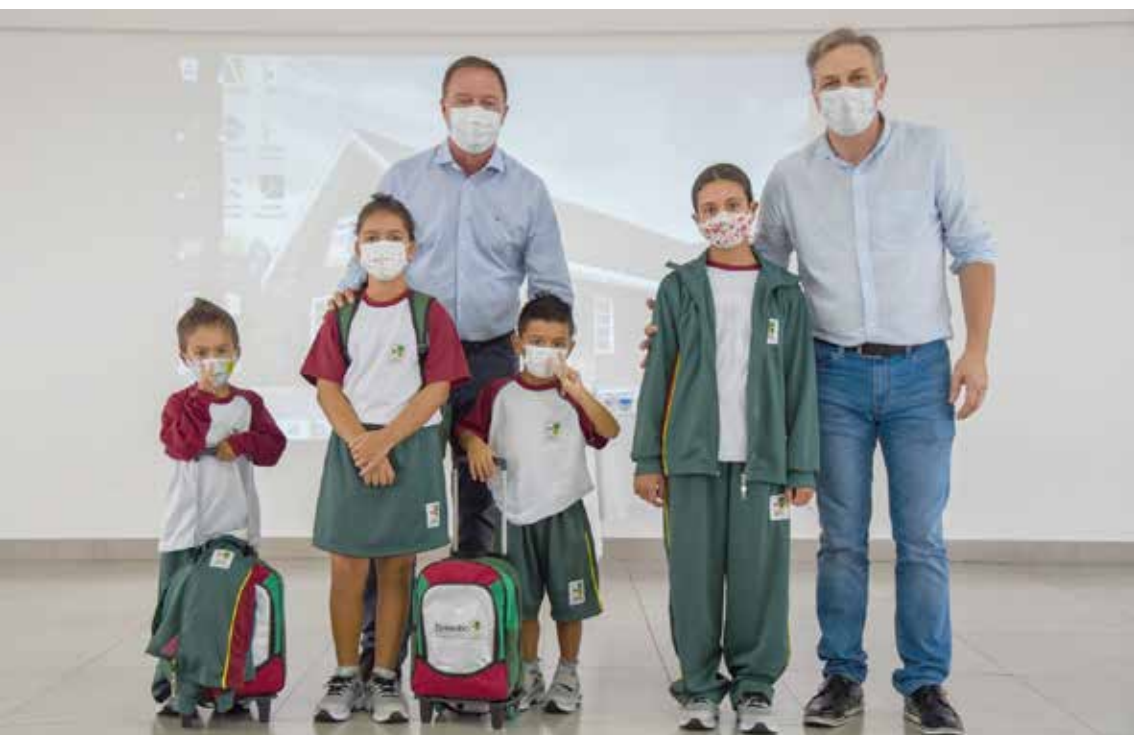
Em reunião com profissionais da educação, Prefeitura definiu as medidas de prevenção a serem tomadas na retomada das aulas e apresentou os novos uniformes para 2022

Na última terça-feira, a Prefeitura de Colombo e a Secretaria de Educação promoveram um encontro com a equipe de diretores de Escolas e Centros Municipais de Educação Infantil (CMEI'S) no auditório