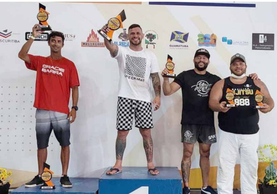
Na 1ª etapa do Campeonato Paranaense de Jiu-Jitsu 2022, a academia esteve no lugar mais alto do pódio em diversas categorias