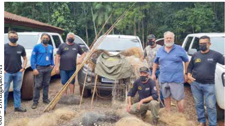
A piracema começou no dia 1º de novembro de 2021 e vai até o dia 28 de fevereiro de 2022

“O Estado promove ações de repovoamento dos nossos rios através do Programa Rio Vivo, mas a fiscalização é fundamental para garantir que as espécies possam concluir seu processo de reprodução. É preciso respeitar a piracema e as regras ambientais”, destaca o secretário do Desenvolvimento Sustentável e do Turismo (Sedest), Márcio Nunes.