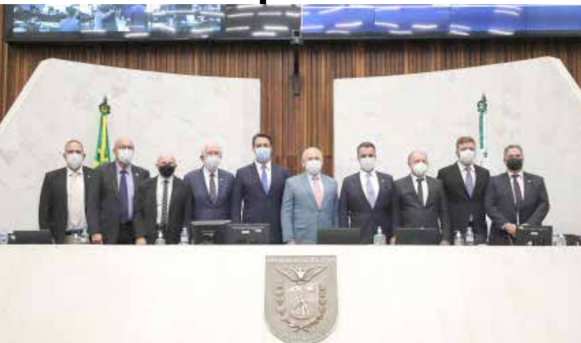
Abertura dos trabalhos contou com a presença do Governador Ratinho Júnior, de autoridades do Poder Judiciário e representantes civis

Na última quarta-feira, a Assembleia Legislativa do Paraná (ALEP) realizou uma sessão de instalação da quarta Sessão Legislativa da 19ª Legislatura. Na solenidade, o governador do Estado, Carlos Massa Ratinho Junior, entregou ao presidente da ALEP, deputado Ademar Traiano, a mensagem e o plano de governo do Poder Executivo para este ano. No documento, o Governo expõe a situação econômica e financeira do Paraná e as ações a serem desenvolvidas ao longo do período.