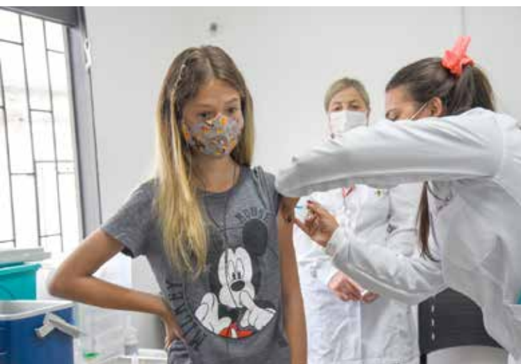
Atendimento exclusivo, abertura de novos postos e mutirões aos finais de semana são algumas das medidas adotadas pela Secretaria de Saúde na imunização das crianças

Iniciada no dia 18 de janeiro, a campanha de vacinação infantil contra a Covid-19 avança a passos largos em Colombo. O processo de imunização começou atendendo as crianças acamadas, imunossuprimidos, com deficiências ou comorbidades, mas agora, com pouco mais de duas semanas, já estão sendo feitas as aplicações de doses nas crianças a partir de 8 anos, com ou sem comorbidades.