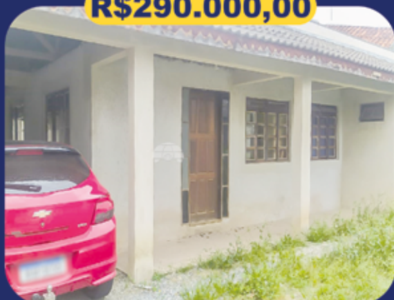
REF 940243 - Colombo - Guarani Casa - 3 dormitórios - 150m 2