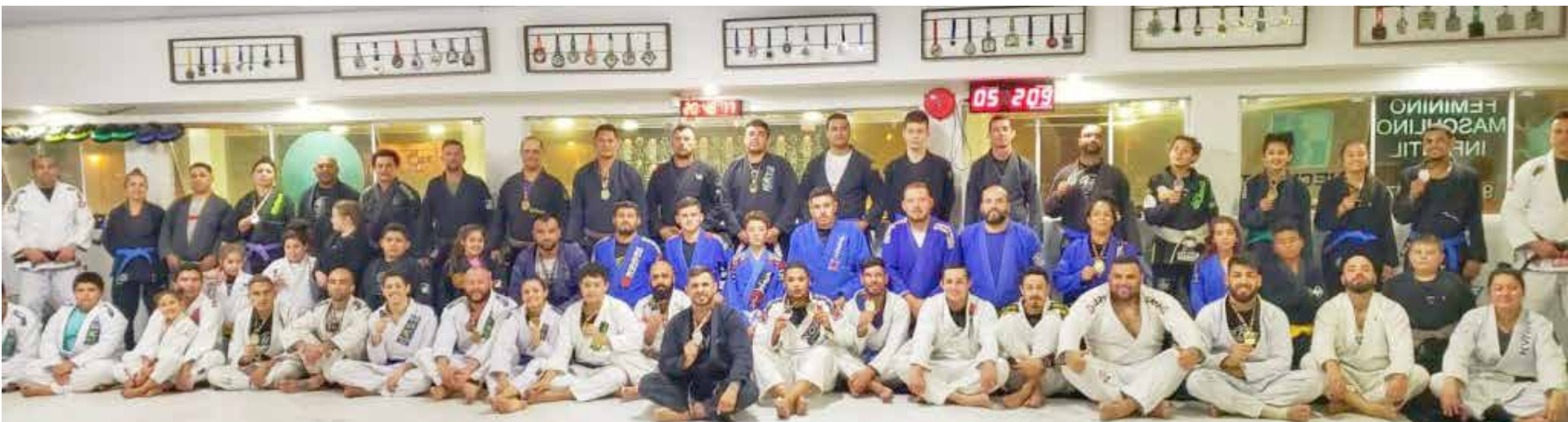
Entre títulos, medalhas e cinturões, Checkmat Colombo é destaque nas principais competições do jiu-jitsu (Foto - Divulgação/Checkmat)

Com a disseminação de referências às artes marciais na cultura que nos rodeia, a prática destes esportes tem se popularizado no Brasil cada vez mais. Dentre as diversas modalidades de lutas, uma das que mais se destaca é o jiu-jitsu, impulsionada principalmente pelo alcance do UFC no mundo todo.